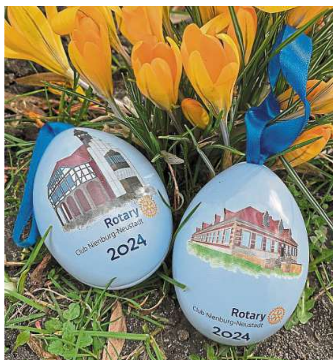
Mit dem Verkauf dekorativer Glückseier mit örtlichen Motiven will der Rotary Club Nienburg-Neustadt zu Ostern Menschen helfen, die traumatische Geschehnisse verarbeiten müssen.

„Den Erlös der Glückseier-Aktion stellen wir zur Verfügung,