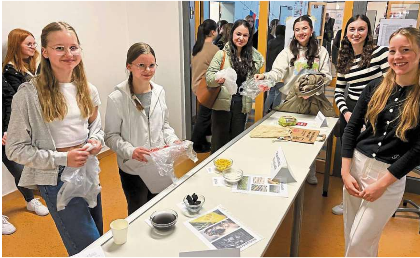
Die Schülerinnen und Schülern am Stand zum Thema „Bioplastik“.

Dieser Stoff aktiviert Bakterien, die das Nitrat zu völlig harmlosen Luft-Stickstoff umsetzen. In ihren Versuchen konnten sie nitratkontaminiertes Wasser vollständig nitrat-