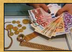
Für schönen Schmuck (bspw. mit Brillanten) gibt es sogar mehr als den Goldpreis