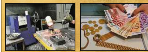
Eigene Schmelzöfen minimieren Kosten bei Der Goldmann