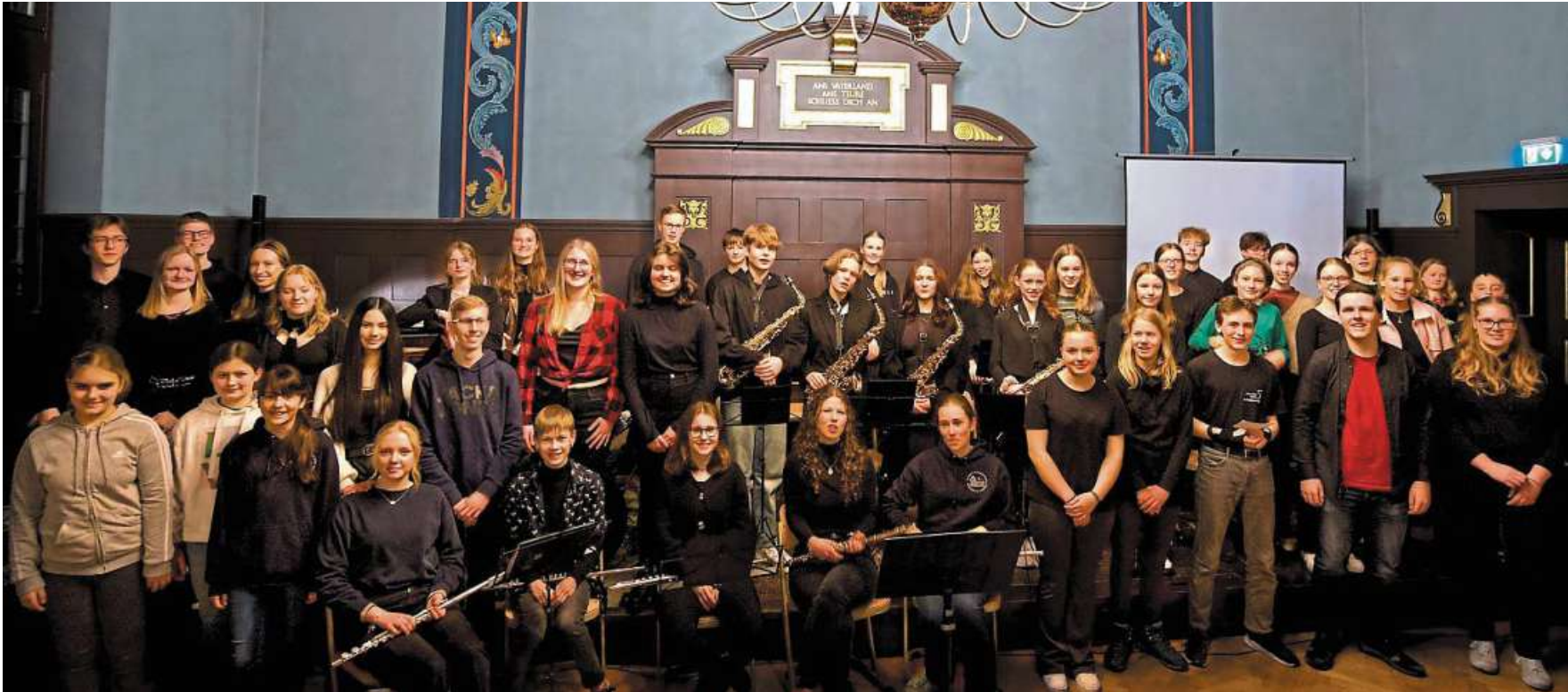
Auf das Publikum des ASS-Musik- und Kulturabends wartete ein abwechslungsreiches Programm, das ein Wechselbad der Töne und Emotionen bescherte – von gefühlvollen Stücken, die Gänsehaut verursachten, bis zu Darbietungen, die das Publikum zum anerkennenden Schmunzeln trieb.

Musik- und Kulturabend der Albert-Schweitzer-Schule begeistert im Giebelsaal