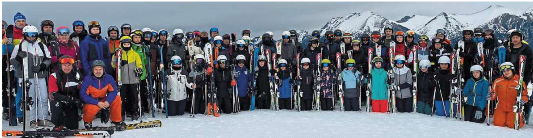
Die 59 Schülerinnen und Schüler wurden bei ihrem Skikurs im Salzburger Land von 16 Lehrkräften und Betreuern begleitet.

Die 59 Schülerinnen und Schüler wurden von 16 Lehrern sowie Betreuern, darunter sieben qualifizierte „Skilehrer“, begleitet, sodass jeder gemäß seinem Leistungsver-