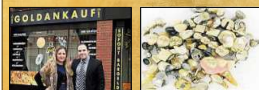
Seriös, kompetent, freundlich!