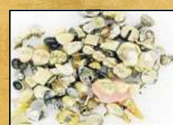
Zahngold (auch mit Zahnresten)

Nicht selten enthalten Schmuckschatullen wahre Schätze. Die explodierenden Goldpreise treiben verständlicherweise die Kunden zu „Der GOLDMANN®“ in Nienburg, der auch kleinste Mengen an Altgold entgegennimmt.