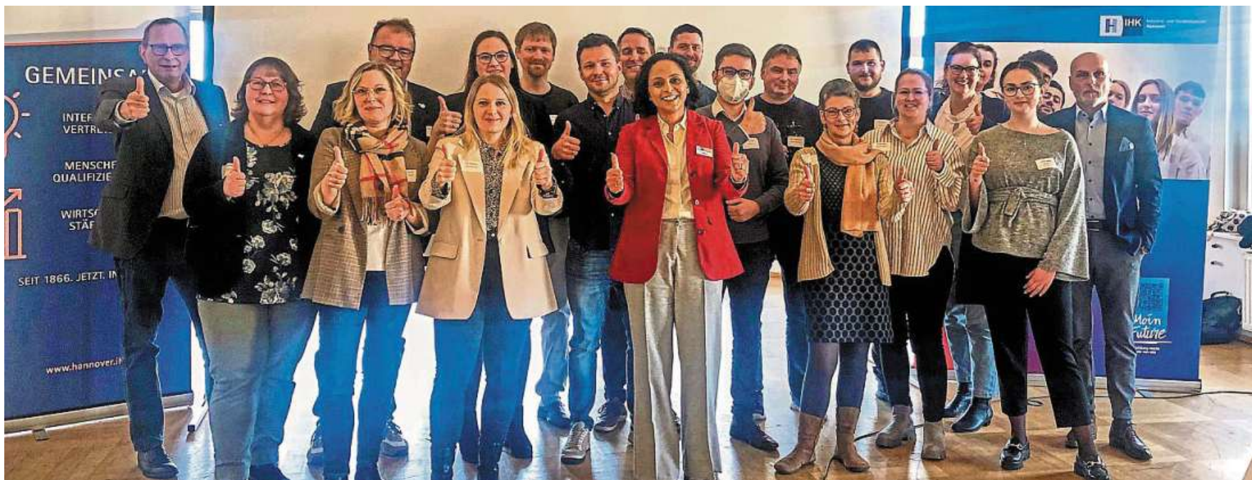
Spieglein an der Wand, bin ich der/die attraktivste Arbeitgeber/in im Land?: In Nienburg wurde jetzt das Netzwerk „Ausbildende 2024“ gegründet.

Gemeinsames Thema: Gewinnung von Fachkräften und Auszubildenden