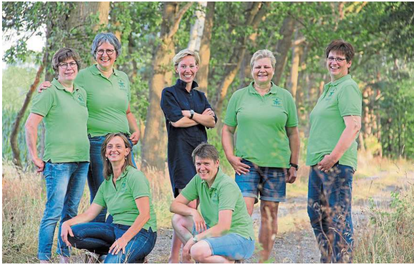
Familienmanagerinnen auf Zeit: die Dorfhelferinnen im Landkreis Nienburg.

Sie werden zentral im Evangelischen Dorfhelferinnen-