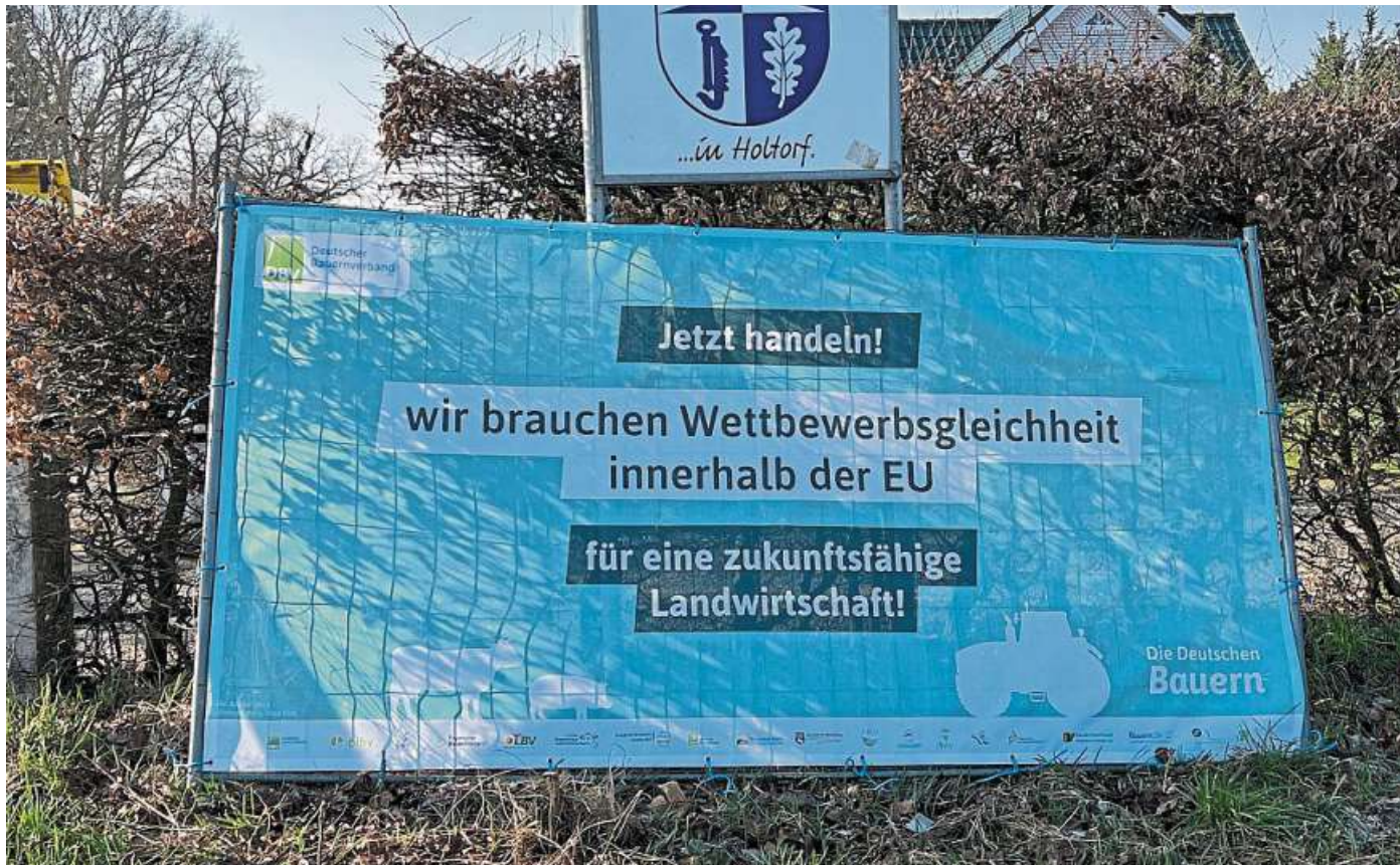
Auch am Ortseingang von Holtorf weisen die Landwirte auf Plakaten auf ihre Forderungen hin.

Im gesamten Verbandsgebiet des Landvolks Mittelweser stehen nun an auf großen Bannern die Forderungen wie Auflagenstopp und Wettbewerbsgleichheit innerhalb der Europäischen Union. Landvolk-Vorsitzender Christoph Klomburg führt weiter aus: „Wir brauchen die Einführung einer steuerfreien Risikoausgleichsrücklage und die Weiterführung der ausgereiften Regelung zur steuerlichen Gewinnglättung für unsere Betriebe.“ Auch der ausufernden Bürokratie müsse ein Ende gesetzt werden. „Durch nationale Alleingänge bei den Auflagen für die Landwirtschaft gerät Deutschland ins Hintertreffen“, so Klomburg. „Wir brau-