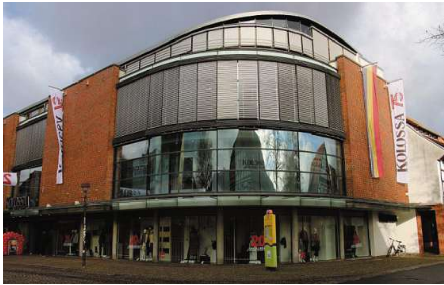
Außenansicht des Nienburger Modehauses Kolossa mit Fahnen zum Jubiläum.