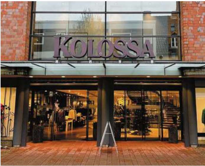
Hereinspaziert: Mode und mehr auf vier Etagen.