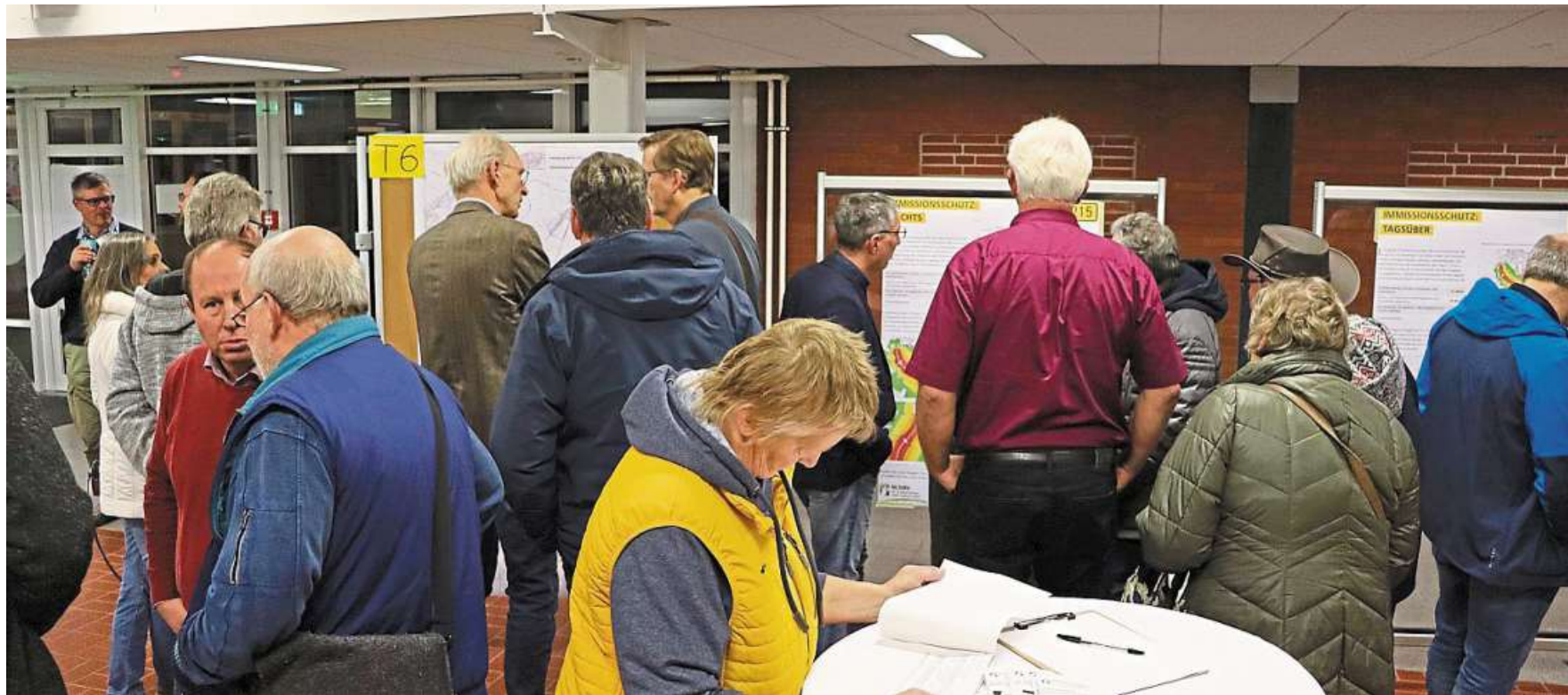
Der Infomarkt zur Verlegung der B215 in der Heemser Grundschule stieß bei den Bürgerinnen und Bürgern auf großes Interesse.

Infomarkt der Straßenbaubehörde zur künftigen Ostumgehung gut besucht