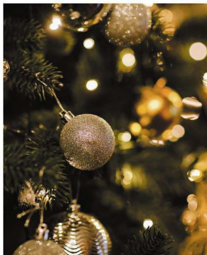
Der geschmückte Baum gehört bei den meisten Menschen zum Weihnachtsfest dazu.

Den Baum mit Netz in den Weihnachtsbaumständer stellen und dann das Netz von unten nach oben aufschneiden und abnehmen. DH