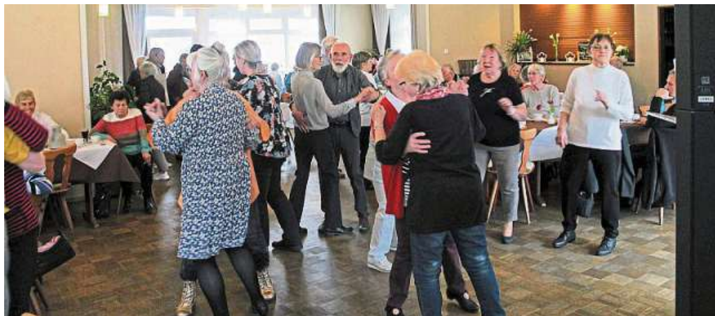
Die Gäste genossen es, zu den vertrauten Klängen zu tanzen.