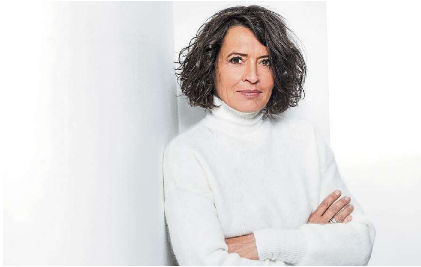
Die beliebte Schauspielerin Ulrike Folkerts liest in Haßbergen aus ihrem Buch „Ich muss raus“.

Haßbergen. Im Herbstpro- gramm holt das Veranstal- tungsteam der Alten Kapelle am Samstag, 2. Dezember, um 20 Uhr mit Ulrike Folkerts ein- ne bekannte und beliebte Schauspielerin nach Haßber- gen. Als Autorin liest Folkerts aus ihrem autobiographischen Buch „Ich muss raus“. In ihrem im April 2021 er- schienenen Buch geht es von der verhassten Tanzstunde im Rock über den Versuch, so wie alle für den tollen Typen zu schwärmen, vom Sexismus in der Schauspielbranche über das private und das öffentliche Outing, vom Festgelegt-Wer- den auf die Tatort-Figur bis zur Frage, wer denn die Dreh- bücher für Frauenfiguren schreibt: Offenherzig, direkt und humorvoll erzählt Ulrike Folkerts von ihrem Kampf ge- gen innere und gegen äußere Widerstände. Die beliebteste und am längsten dienende Tatort- Kommissarin hat in der Rolle der toughen Ermittlerin Lena Odenthal das Frauenbild im deutschen TV-Krimi revolution- nert. Doch bis sie ihre eigene Rolle im Leben gefunden hat, war es ein längerer und härte- rer Weg. Ihre Erfahrungen als prominente Frau in der Film- branche, als lesbische Frau, als kinderlose Frau, als älter werdende Frau spiegeln wider, was viele Frauen erleben. Um aus vorgesehenen Rollen aus- zubrechen, braucht es Kraft. Folkerts gibt Frauen den