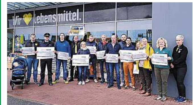
Beim Spendenmarathon des Nienburger E-Centers Hanekamp ging keiner der Teilnehmenden leer aus.