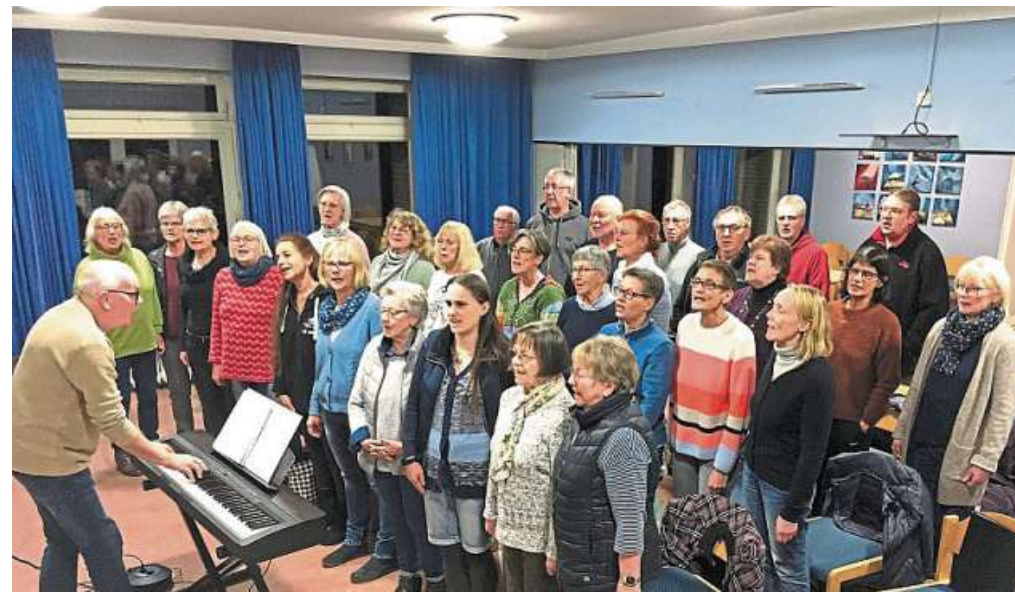
Das Foto zeigt den Liebenauer Kirchenchor „Himmlische Töne“ während eines Übungsabends für das Adventskonzert am 3. Dezember in der Sankt-Laurentius-Kirche.

Festliche Musik am 3. Dezember in der Liebenauer Kirche