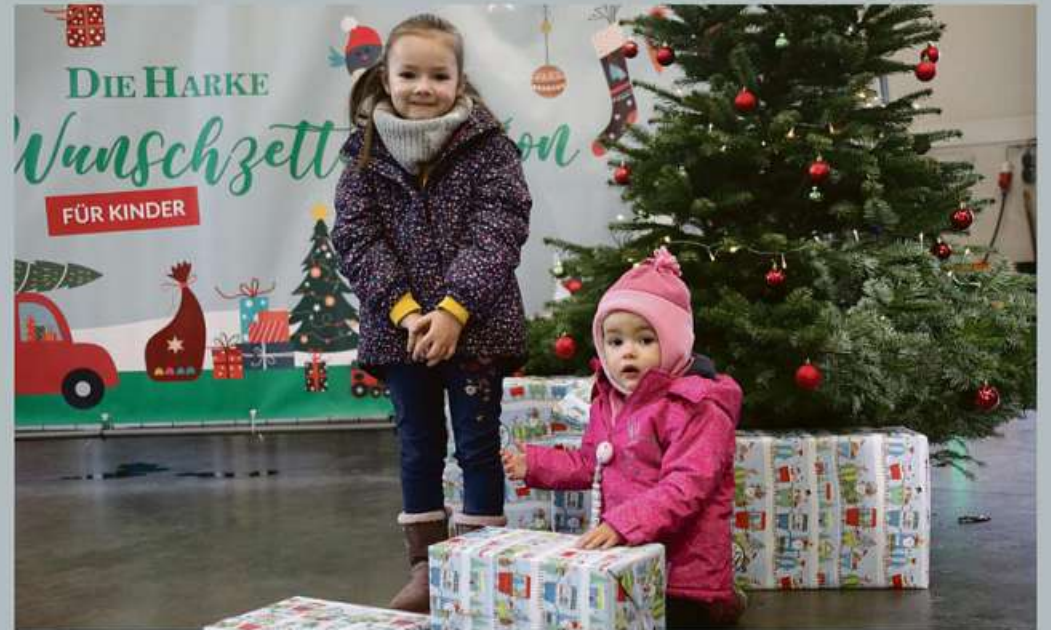
Doppelte Bescherung bei der Geschenkübergabe 2022.