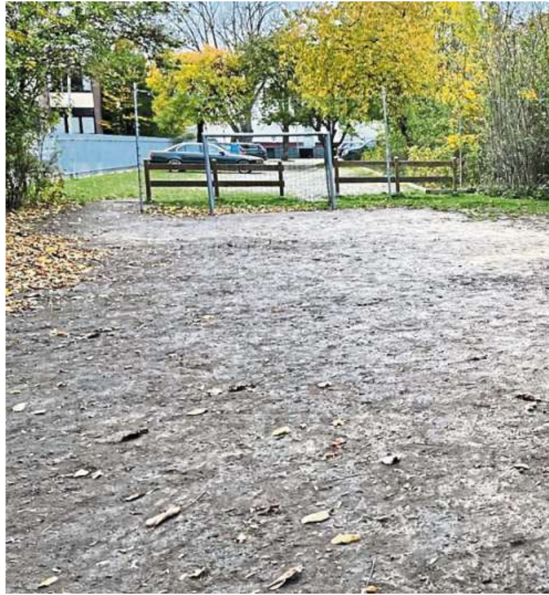
Soll durch einen nachhaltigen Kunstrasen ganzjährig zum Spielen und Toben zur Verfügung stehen: der „Bolzplatz“ der Rahn Schulen.

„Wir legen Wert darauf, dass man auch raus geht. In den Pausen sollen die Kinder sich im Außenbereich aufhalten“, erklärt der Schulleiter. Die Tatsache, dass an einigen Schulen die Pausen auch direkt im Klassenraum verbracht werden