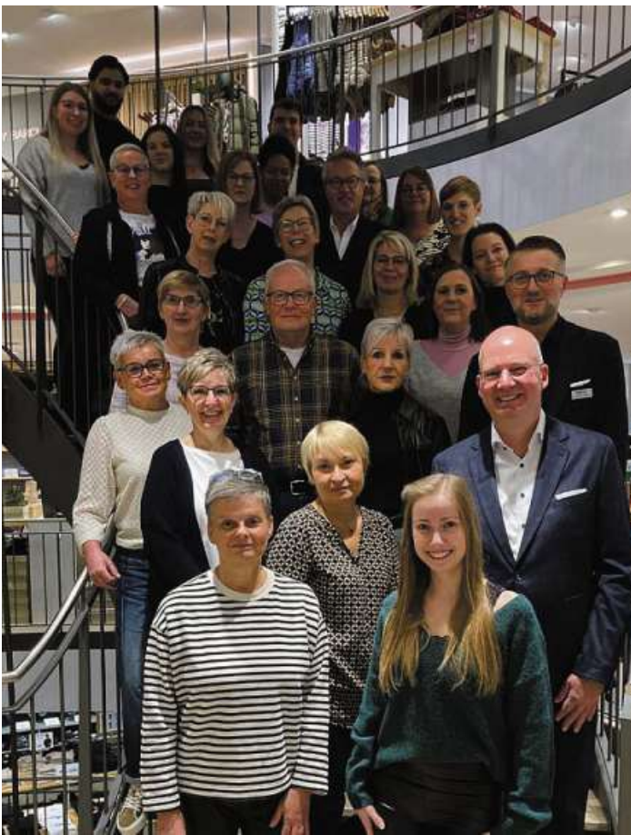
Das Nienburger Verkaufsteam möchte Einkaufen zum Erlebnis machen.

auch die Kunden gesagt: Wir gehen zum Kleiderberater. 1954 hat mein Großvater das Geschäft in Verden erworben. 1960 hat er das Grundstück in der Georgstraße 35 erworben und ist mit einem kleinen Laden in sehr guter Lage in einen großen Laden in Rاندlage umgezogen, was sehr mutig war. Es entstand ein Neubau, nach damals modernen Gesichtspunkten, mit einer Verkaufsfläche von 400 Quadratmetern.“ Die Georgstraße wurde dadurch aufgewertet.