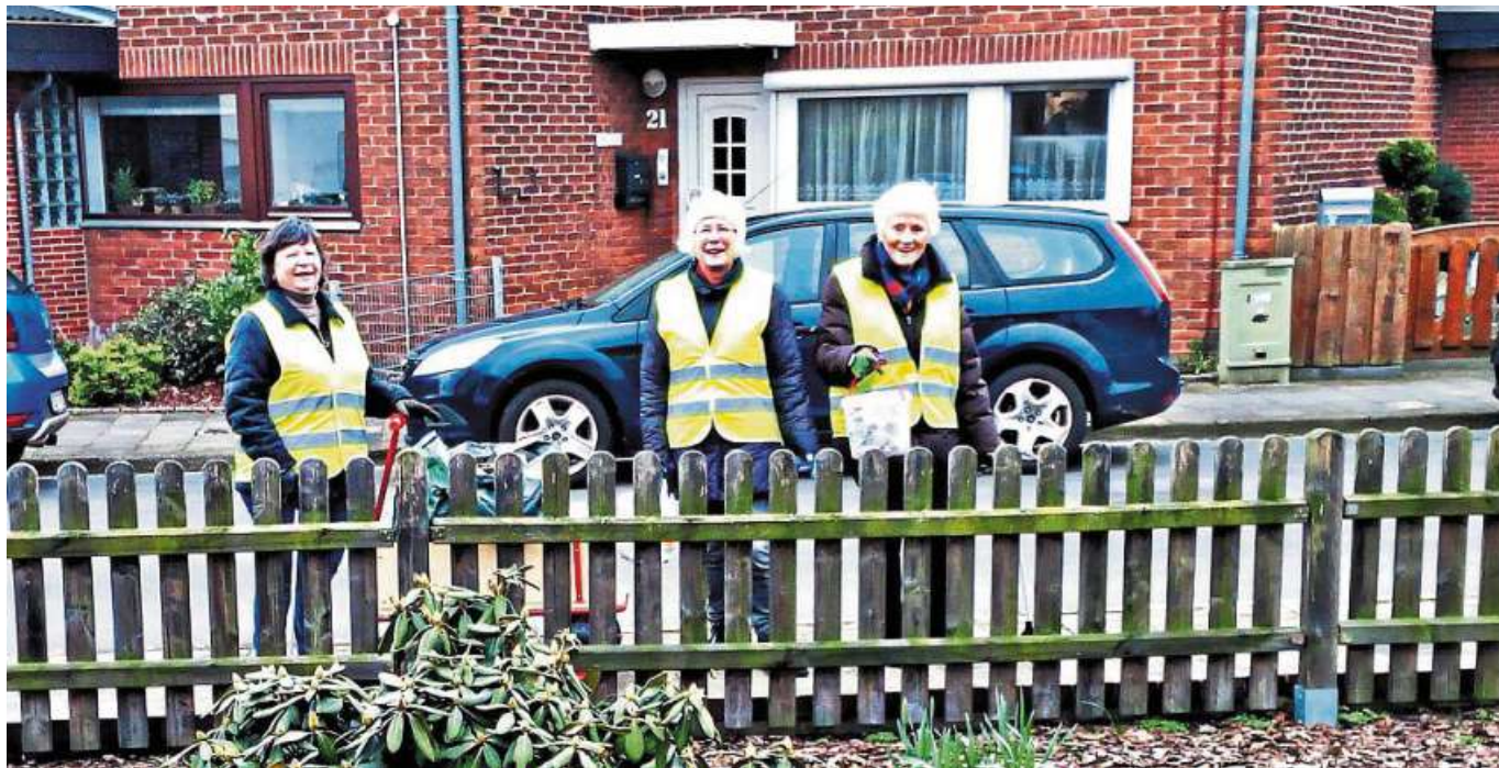
Müll sammeln in Gemeinschaft macht Spaß. Das wissen die Bewohnerinnen und Bewohner des Nienburger Nordertors aus Erfahrung.

Nächster Einsatz in Nienburgs Nordertor ist am 30. November