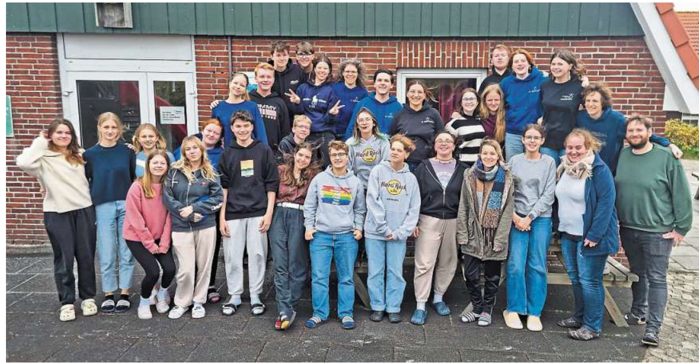
Viel Spaß, wenig Schlaf und jede Menge neue Erfahrungen: die Evangelische Jugend Nienburg auf Spiekeroog.