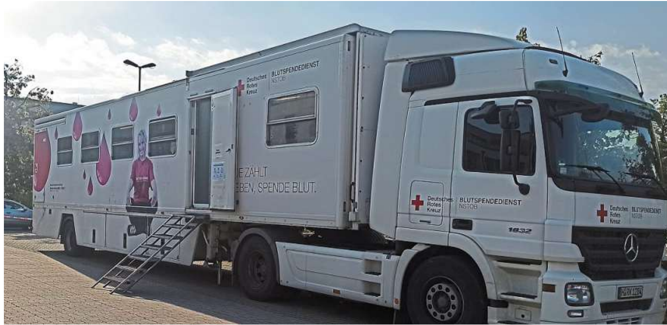
Blutspenden und Typisierungen waren vor dem Nienburger Krankenhaus möglich.