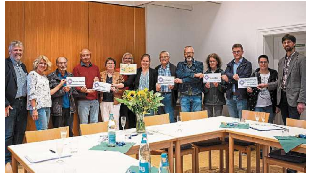
Gemeindevertreter bei der Vertragsunterzeichnung.

Weitere Kooperationen geben bei zurückgehenden Mitgliederzahlen und ab-