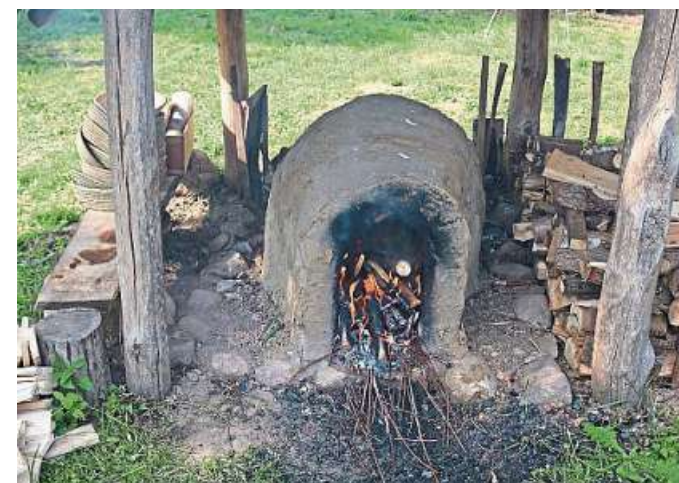
Frisches Brot gibt es aus dem Lehmbackofen.

Außerdem lohnt sich ein Besuch in der archäologischen Ausstellung „Auf Sand gebaut – von Sand begraben“ im Gebäude Lange Straße 50 in Liebenau. Dort können sich Besucherinnen und Besucher auch bei Kaffee und Kuchen stärken. DH