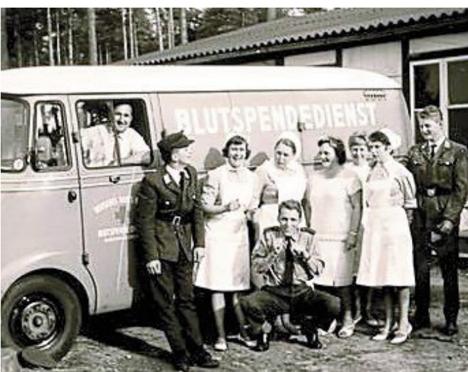
Die erste DRK-Blutspende in Liebenau 1963.

Liebenau. Das Deutsche Rote Kreuz (DRK) Liebenau lädt herzlich zu einem besonderen Blutspenden am Montag, 11. September, von 16.30 bis 19.30 Uhr in die St. Laurentius Grundschule an der Schloss- straße in Liebenau ein. Dieser Termin steht unter dem Motto „60 Jahre Blut- spende in Liebenau“, denn genau vor 60 Jahren hatte der erste Blutspendetermin bei der Bundeswehr in Liebenau statt- gefunden. Aus diesem Anlass soll jede Spenderin und jeder Spender, der an diesem Tag zur Blut- spende in die Grundschule Liebenau kommt, ein kleines Dankeschön erhalten. Aufzei-