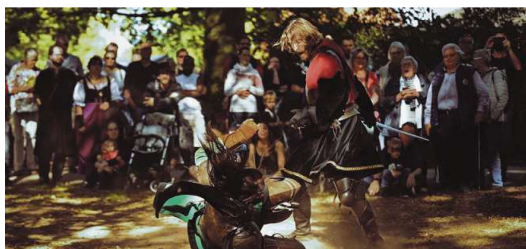
Showkämpfe sind Teil des Marktes und beliebt beim Publikum.

Am Samstag beginnt das Fest um 13 Uhr und dauert an bis Mitternacht. Am Sonntag beginnt der Festtag um 10 Uhr mit einem Gottesdienst in der Martinskirche. Auch dabei werden unter anderem Musikanten auf historischen Instrumenten spielen. Der Markt wird vom Nachtwächter durch ein Signal am Abend gegen 19 Uhr beendet. Der Eintritt beträgt acht Euro pro Person, eine Familienkarte kostet 15 Euro. nis