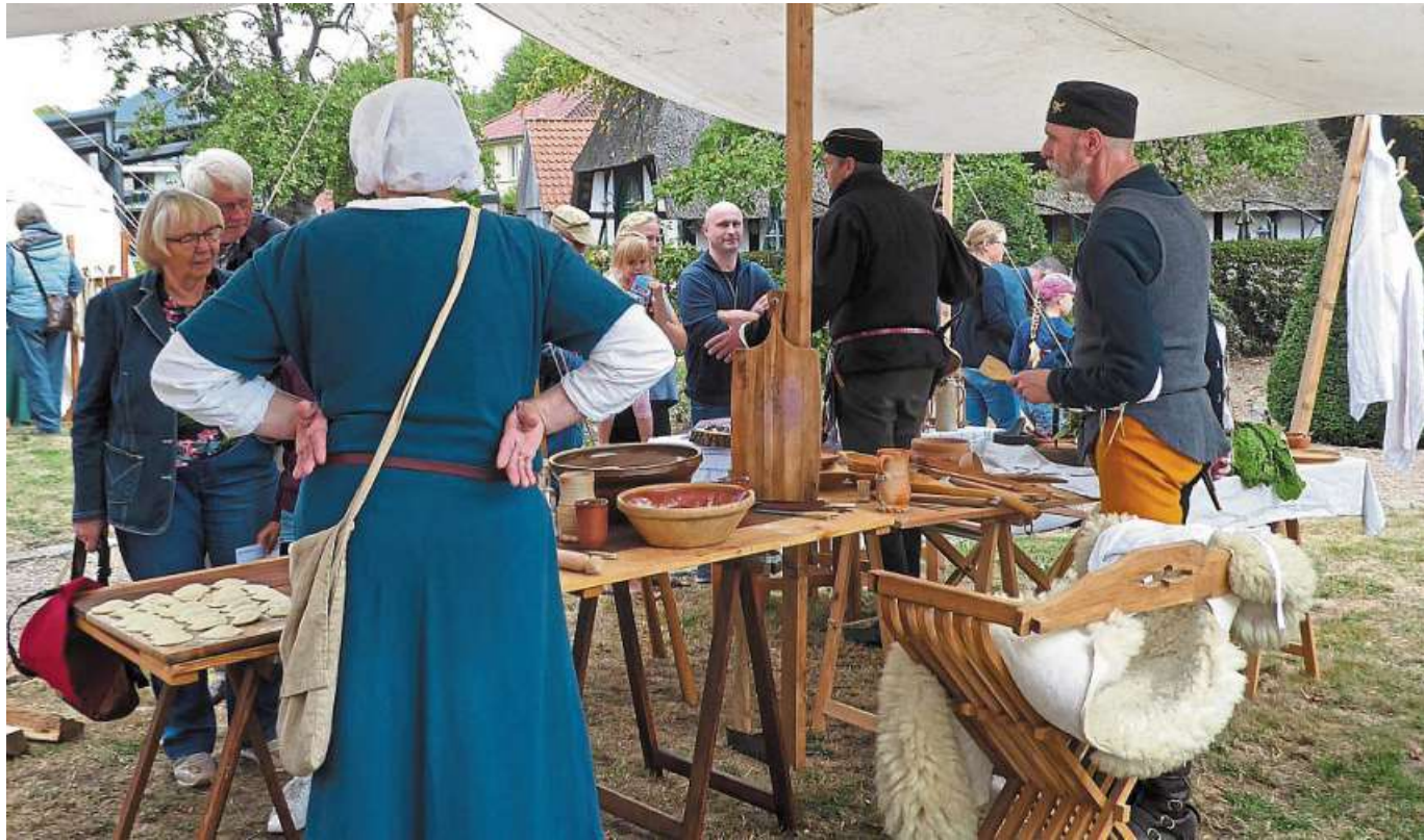
Gäste und Aussteller beim Fachsimpeln über mittelalterliche Kochkunst.

Manfred Freytag ist am selben Tag über 100 Kilometer sportlich unterwegs. Gefahren wird von Hagenburg über Egesdorf, Springe nach Lauenau. Treffpunkt ist der Parkplatz der Kirche Hagenburg an der B 441 um 10 Uhr. Anmeldungen nimmt er an unter Telefon (0151) 56 96 16 68. DH