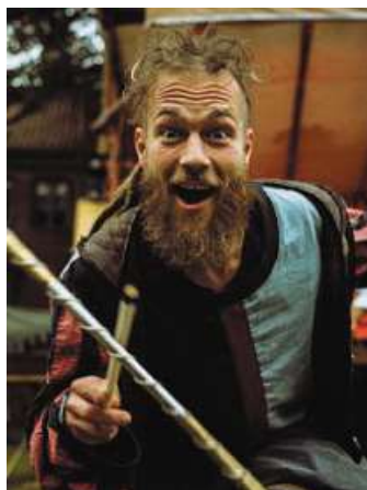
Gaukler sind auf dem Markt unterwegs.

HÖREN SEHEN VERSTEHEN HUTH HOYA (04251) 26 15