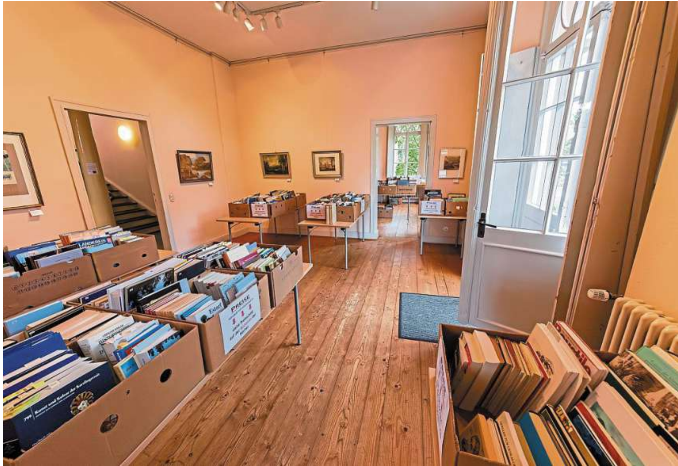
Bücher aus diversen Bereichen werden im Quaet-Faslem-Haus angeboten.

Nienburg. Der Fachbereich 18 – Veterinärwesen und Lebensmittelüberwachung des Landkreises Nienburg zieht am kommenden Dienstag, 12. September, zieht in neue Räume am Amalie-Thomas-Platz 2 in Nienburg. Daraus resultiert eine eingeschränkte telefonische Erreichbarkeit ab dem Mittag des Vortags. Auch in den folgenden Tagen kann es noch vereinzelt zu Einschränkungen kommen, teilt die Kreisverwaltung mit. Der Fachbereich ist jedoch durchgehend erreichbar über die E-Mail-Adresse vetamt@kreis-ni.de . Es wird darum gebeten, in der kommenden Woche nach Möglichkeit bevorzugt diesen Kommunikationsweg zu nutzen. Die bisherigen Durchwahlen der Mitarbeiterinnen und Mitarbeiter bleiben unverändert. DH