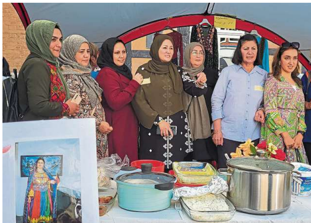
Frauen aus Afghanistan hatten ein kleines Fest vorbereitet.