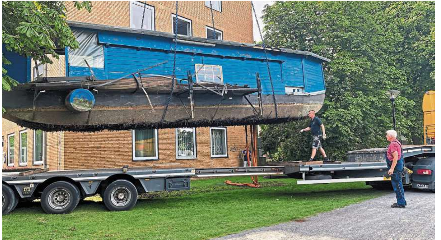
Die blaue Schute wird von einem Kran der Firma Schlamann auf einen Tieflader verfrachtet.

Der Anleger des über 60 Jahre alten Barkassenboots „Kleine Nienburgerin“ war am Sonntag, nur einen Tag nach dem Fischerstechen und