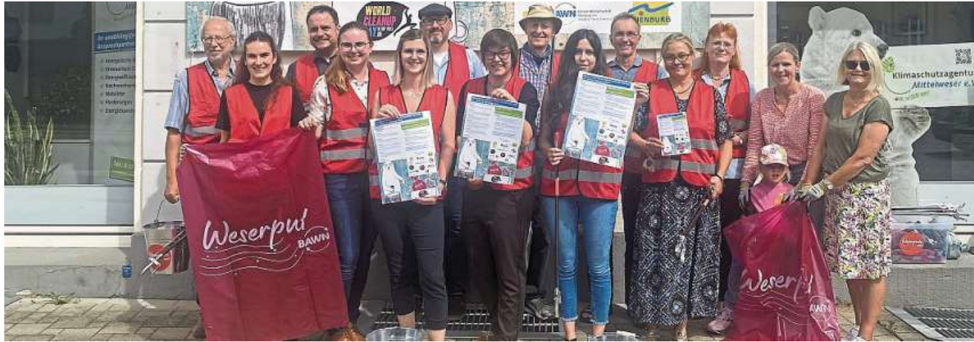
Die Kooperationspartner bereiten sich auf den World Cleanup Day vor.

Nienburg. Aufgrund der geänderten Verkehrsführung im Zusammenhang mit dem Rückbau des Fahrradschutzstreifens auf der Hannoverschen Straße erfolgt seitens der Stadt Nienburg der Hinweis, dass es Radfahrerinnen und Radfahrer auch weiterhin möglich ist, die Fahrbahn der Hannoverschen Straße zu befahren. Es besteht keine Pflicht die Nebenanlage der Hannoverschen Straße zu benutzen, da dies durch Beschilderung gemäß der Straßenverkehrsordnung nicht vorgeschrieben ist. Wer sich dennoch unsicher fühlen sollte, auf der Fahrbahn zu fahren, kann auf die Nebenanlage ausweichen, teilt die Stadtverwaltung abschließend mit. DH