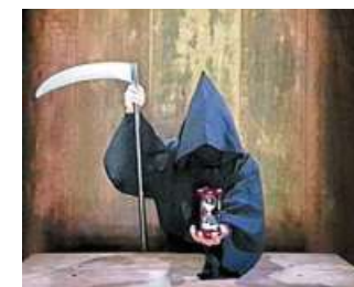
Unter anderem zum „Tod“ lädt die Selbsthilfekontaktstelle ein.

der modernen Gesellschaft“, kündigen die Veranstalter an. Der Eintritt ist kostenlos. Wer mag, darf für das Projekt „Sonnenstrahl“ vom Dasein-Hospiz Nienburg spenden. Auch dort werden Gruppen im Foyer informieren. Anmeldungen zu der Vorstellung sind erforderlich bei der Kontaktstelle unter Telefon (05021) 922413 oder (05021) 922415. nis