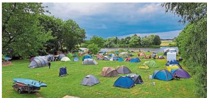
Am Waldheim zelteten die Jugendlichen.

Landesbergen. Es ist bereits eine kleine Tradition. Schon in den letzten beiden Jahren, teilweise noch unter dem deutlichen Eindruck der Covid-19 Pandemie, kam aus der Offenen Jugendarbeit in der Samtgemeinde Mittelweser ein klares Zeichen: Wir wollen wieder raus! In den Sommerferien soll ab jetzt ein regelmäßiges Zeltlager veranstaltet werden. Der letzte Sommer im Waldheim des CVJM Landesbergen war für alle Teilnehmenden ein absolutes Highlight. Und so stand außer Frage, alles in Bewegung zu setzen und in diesem Jahr eine Fortsetzung zu ermöglichen. Für Kinder und Jugendliche waren die Jahre der Pandemie besonders belastend. Gewohnte Treffpunkte, wie Schulen aber auch Jugendhäuser waren nur noch eingeschränkt für sie erreichbar. Bei allem, was durch kreative Lösungen aufgefangen wer-