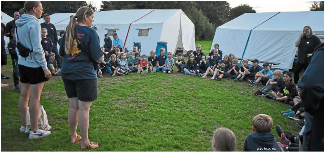
Über eine rege Beteiligung freuten sich die Organisatoren des Stadtkinderfeuerwehrlagers in Erichshagen-Wölpe, hier bei der Siegerehrung der Dorfrallye.