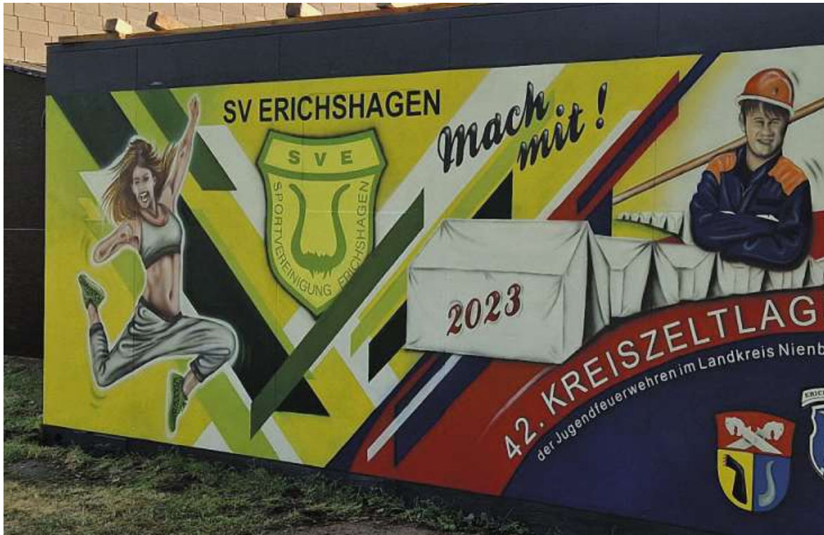
Ein Hingucker: Die Gestaltung zum diesjährigen Kreiszeitlager.