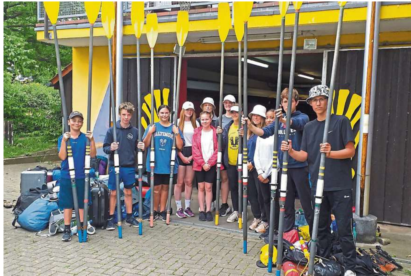
36 000 Ruderschläge später: Die Ruderriege der Nienburger Albert-Schweitzer-Schule ist wieder zuhause.

■ Etappe 1: Kassel - Hann. Münden auf der Fulda (etwa 30 Kilometer) Die besondere Herausforderung der ersten Etappe bestand darin, insgesamt vier Mal zu schleusen. Dabei passierte die Ruderrie-