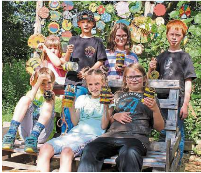
Um fleißige Bienen und Nisthilfen ging es im BUND-Garten in Nienburg.

Um auch den Wildbienen in Steierberg zu helfen, bastelten die Kinder kleine Nisthilfen. Alle bekamen eine leere Konservendose, die mit ver-