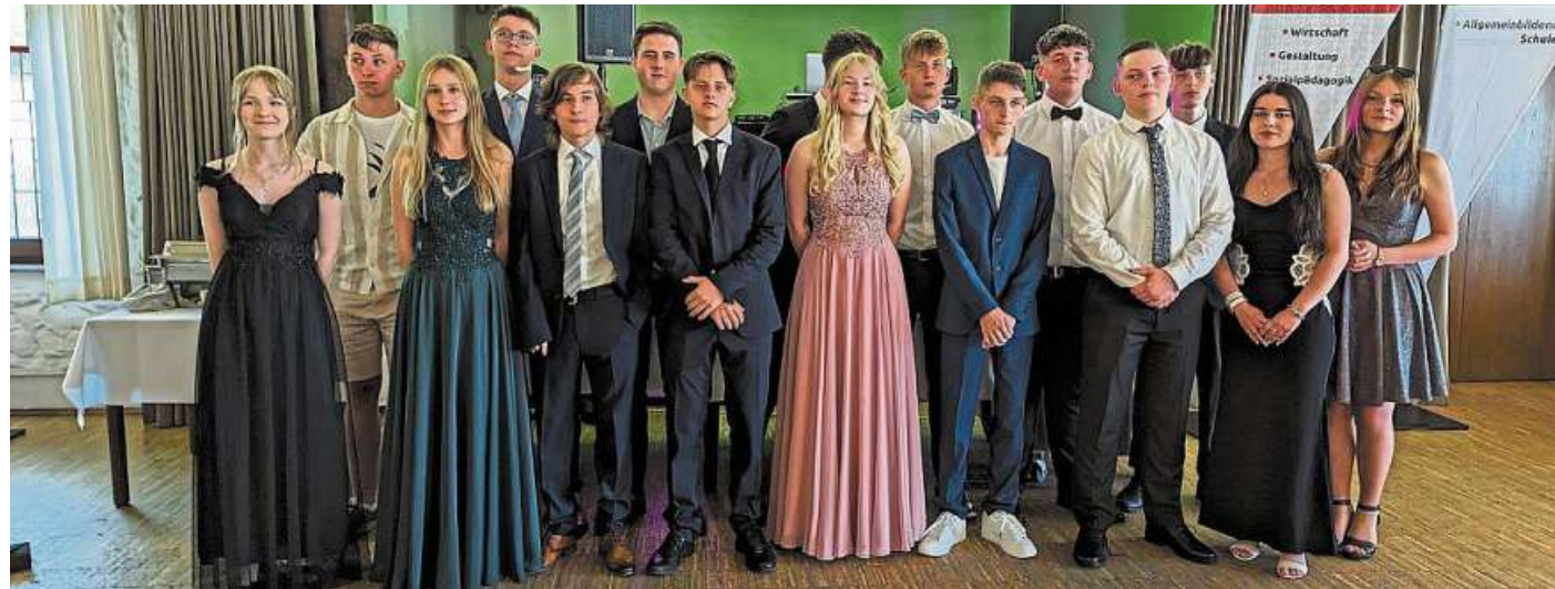
Die Absolventinnen und Absolventen der Realschule.