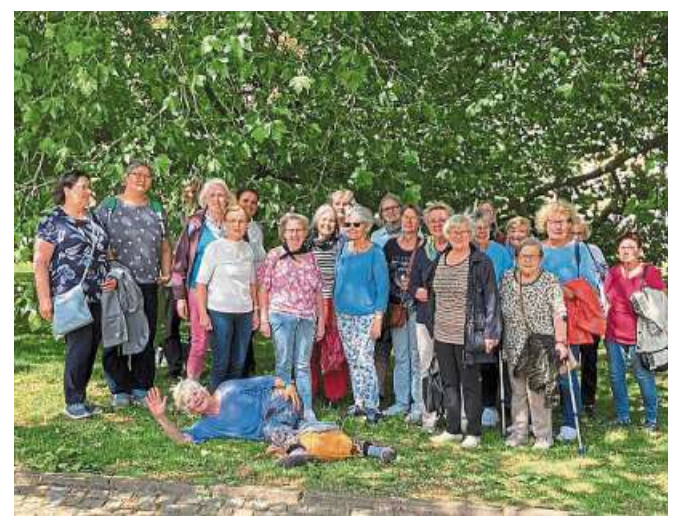
Über Möglichkeiten der Grabgestaltung informierten sich die Hospiz-Frauen in Celle.