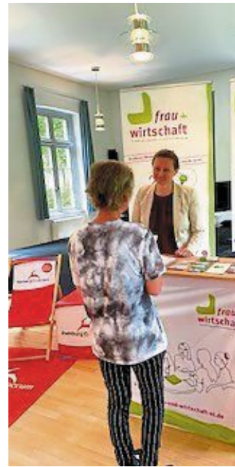
frau+wirtschaft war in Bad Rehburg vor Ort.