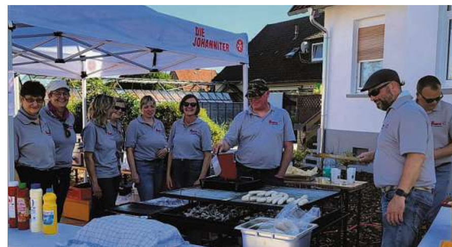
Die fleißigen Ehrenamtlichen der Johanniter Landesbergen.

Seit 1995 hat die SEKURA Kranken- und Altenpflege GmbH ihren Sitz in Leese. Das Unternehmen ist stetig gewachsen und beschäftigt heute mehr als 90 Mitarbeitende. Um den steigenden Anforderungen gerecht zu werden, hat die SEKURA ein neues Verwaltungsgebäude bezogen: Die Loccumer Straße 36 ist jetzt Hauptadresse des Unternehmens. Es bietet ausreichend Platz für fünf Verwaltungskräfte, inklusive einer Auszubildenden zur Kauffrau im Gesundheitswesen, und für sieben Leitungskräfte inklusive der Geschäftsführung. Weiterhin können beide Mentoren einen extra Raum für die generalisierte Pflegeausbildung, zurzeit vier Azubis, nutzen. In dem Gebäude hatte bis Ende der 1950er-Jahre Leesees Gemeindegewerkschaft, Schwester