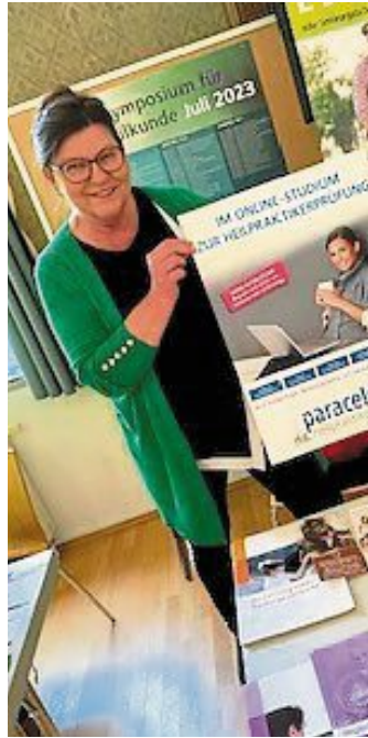
Die Paracelsus-Schulen waren ebenfalls vor Ort.

Imagefilme und Werbefotografie anbietet – haben sich als familienfreundliche Unternehmen präsentiert.