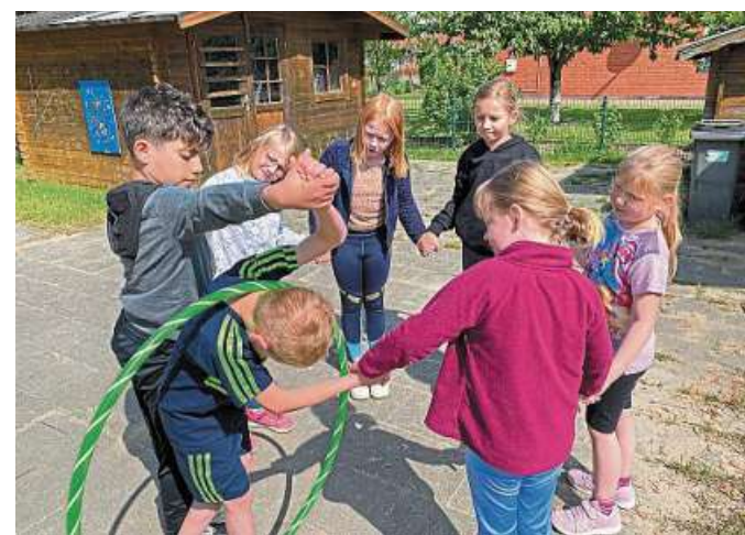
Sport in der Gemeinschaft macht Spaß.