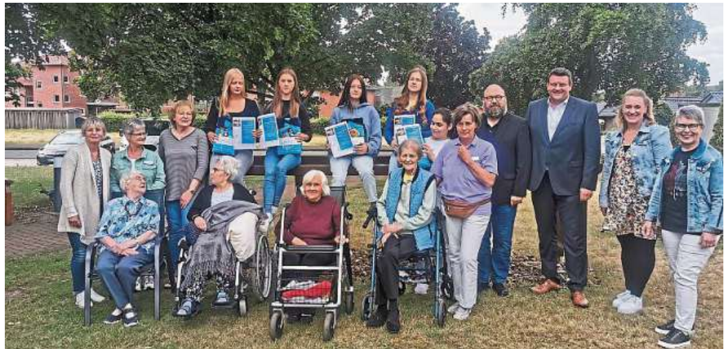
Ein halbes Jahr lang haben sich fünf Schülerinnen der OBS Uchte um den Umgang mit den älteren Menschen verdient gemacht.

Mit dem Zertifikat wird den Schülerinnen ihr freiwilliges und soziales Engagement bescheinigt. Ein halbes Jahr haben sie Einblicke in die Welt der Seniorenpflege erhalten. Einmal wöchentlich besuchten sie gemeinsam mit einer Altenpflegekraft des Cura-Zentrums und einer Betreuerin