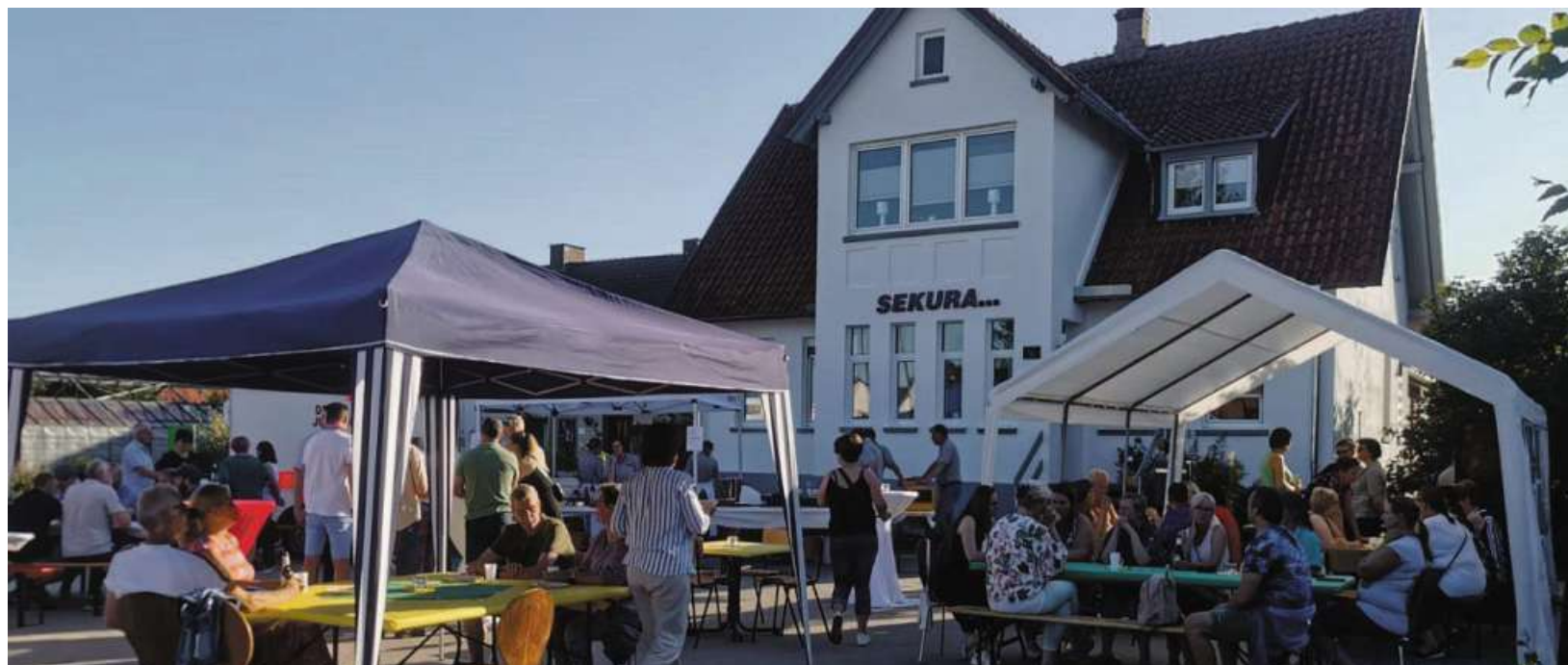
Der Tag der offenen Tür fand bei Kaiserwetter auf dem Hof vor dem neuen Verwaltungssitz statt.

4 Ein unverbindliches Leasingbeispiel der HYUNDAI Finance, ein Geschäftsbereich der Hyundai Capital Bank Europe GmbH, Friedrich-Ebert-Anlage 35-37, 60327 Frankfurt am Main. Verbraucher haben ein gesetzliches Widerrufsrecht. Verpflichtung zum Abschluss einer Vollkaskoversicherung. Kostenpflichtige Sonderausstattung möglich. Überführungskosten in Höhe von 1290,00 EUR für den IONIQ 5 und in Höhe von 1290,00 EUR für den IONIQ 6 enthalten. Alle Preise inkl. gesetzlicher MwSt. Angebot gültig bis 31.07.2023.