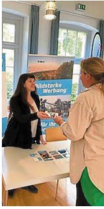
Ebenso das Start-Up-Unternehmen Jenlex.