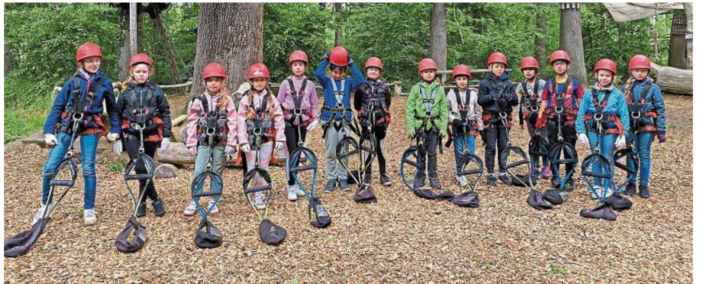
Die Sportwoche führte die Klassen 3 und 4 nach Mardorf in den Kletterpark.

In der Grundschule Haßbergen war vor den Ferien viel los