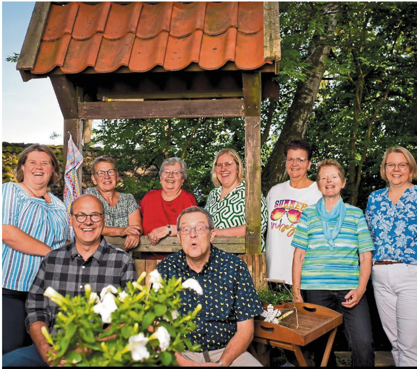
Das Team der Freilichtspiele Stöckse freut sich auf die neue Spielzeit.

Die Aufführungstermine sind: Samstag, 15. Juli, um 20 Uhr, Sonntag, 16. Juli, um 15 Uhr, Samstag, 22. Juli, Sonntag, 23. Juli, Mittwoch, 26. Juli, Sams- tag, 29. Juli, Sonntag, 30. Juli, und Freitag, 4. August, jeweils