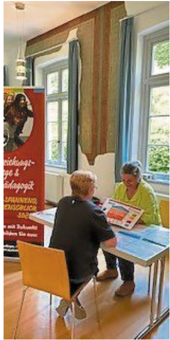
Infos gab's auch bei der PLSW Stadthagen.