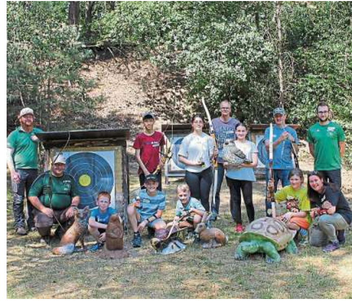
Die Bogenschützen des BSV Argus Wellie waren ebenfalls bestens auf die Kinder aus Steierberg vorbereitet.

kleine Nisthilfen für Wildbienen reicher und die Kinder haben einen tollen Beitrag zum Umweltschutz geleistet.