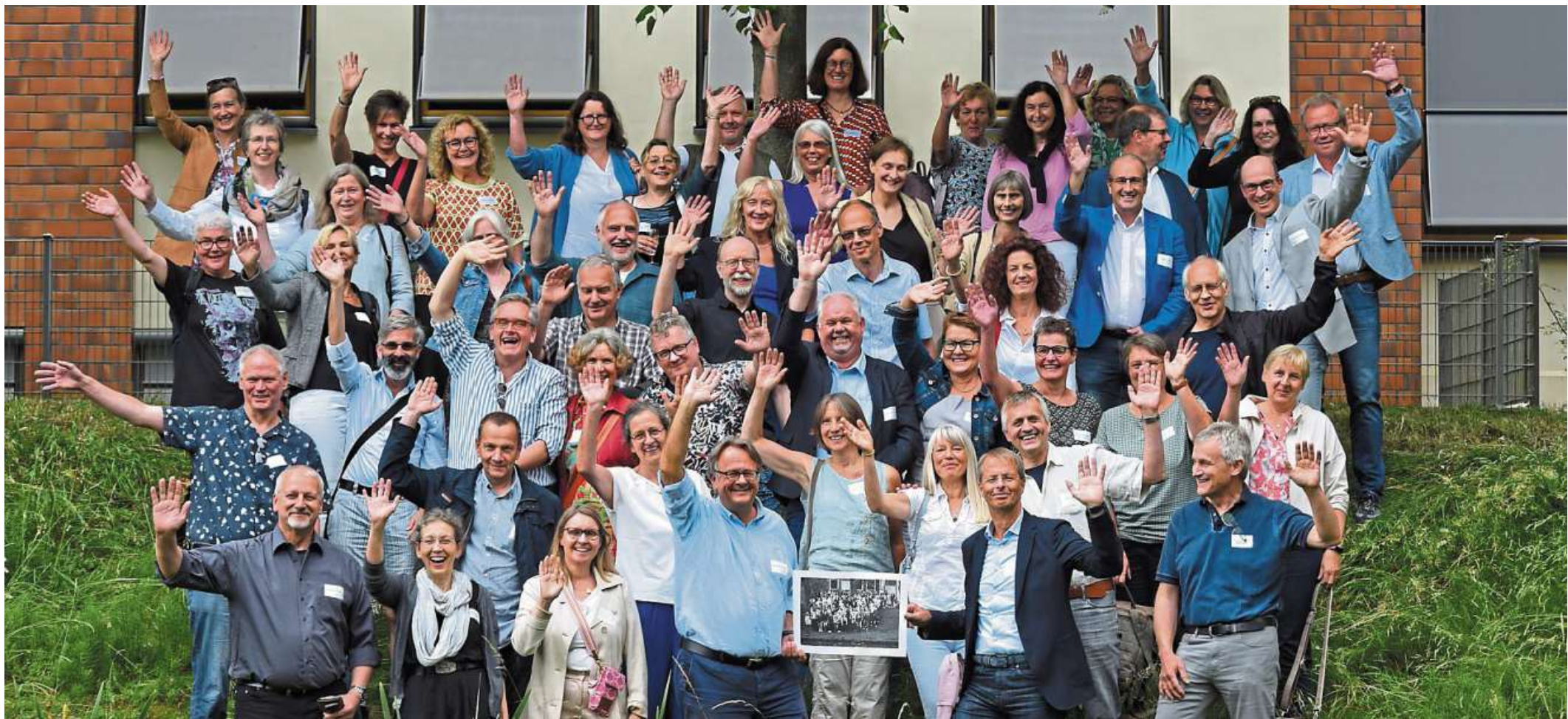
Die Abiturjahrgänge 1963, 1973, 1983 und 1998 haben sich am 17. Juli im heutigen Marion-Dönhoff-Gymnasium getroffen.