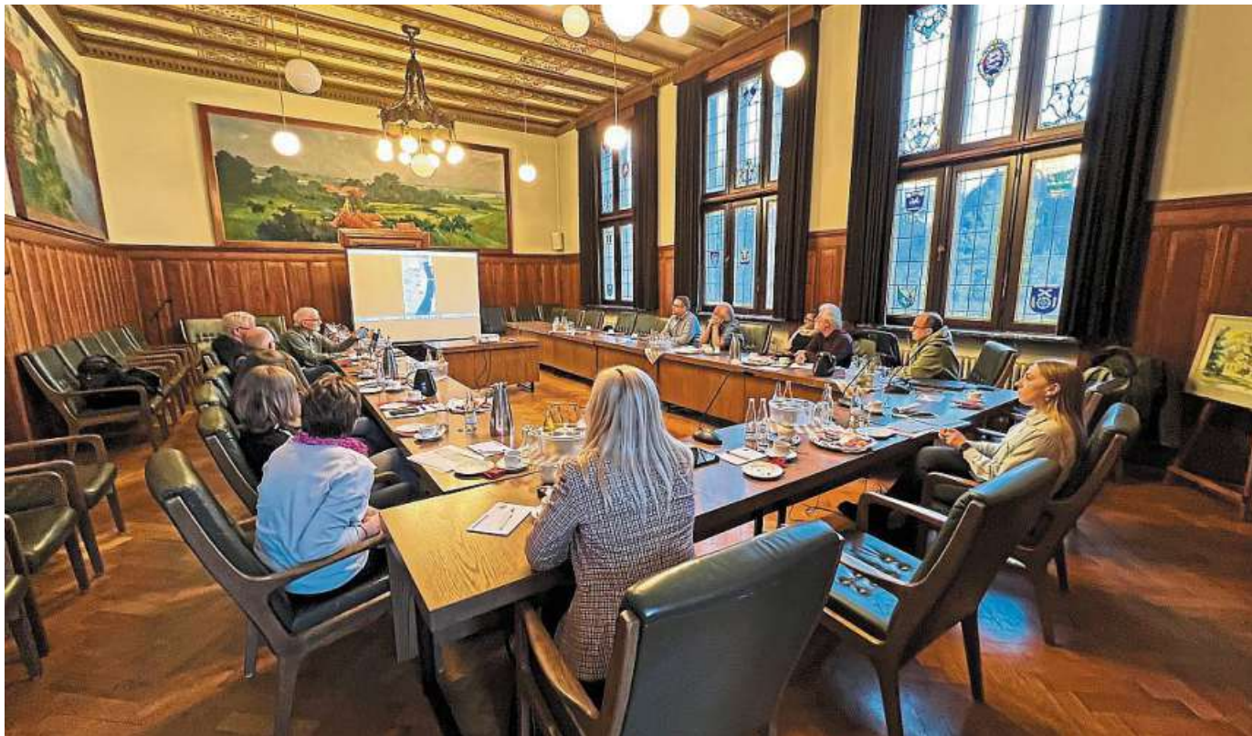
Kürzlich fand im Rathaus ein Hoya ein weiteres Treffen mit Mappern und Touristikern statt.

Mittelweser-Touristik hatte erneut zu Mapper-Treffen eingeladen