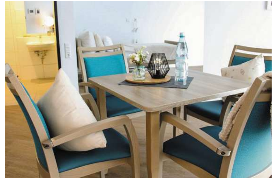
80 helle und wohnlich eingerichtete Einzelzimmer stehen zur Verfügung.