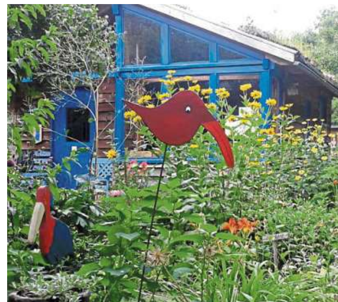
Kreativ können Gäste im BUND-Garten werden.

Um das Wochenende gut abzurunden, findet am Sonntag, 21. Mai, das Königsfrühstück mit festlichem Umzug statt. Begleitet wird das Dorf dabei vom Feuerwehrmusikzug Leese und vom Spielmannszug Rehburg. Nachmittags klingt das Schützenfest bei Kaffee und Kuchen am Zelt aus. DH