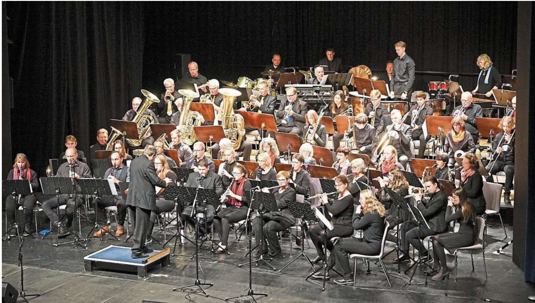
Das über die Grenzen des Landkreises bekannte Orchester der Musikschule Nienburg spielt Science-Fiction-Filmmusik im Nienburger Theater.