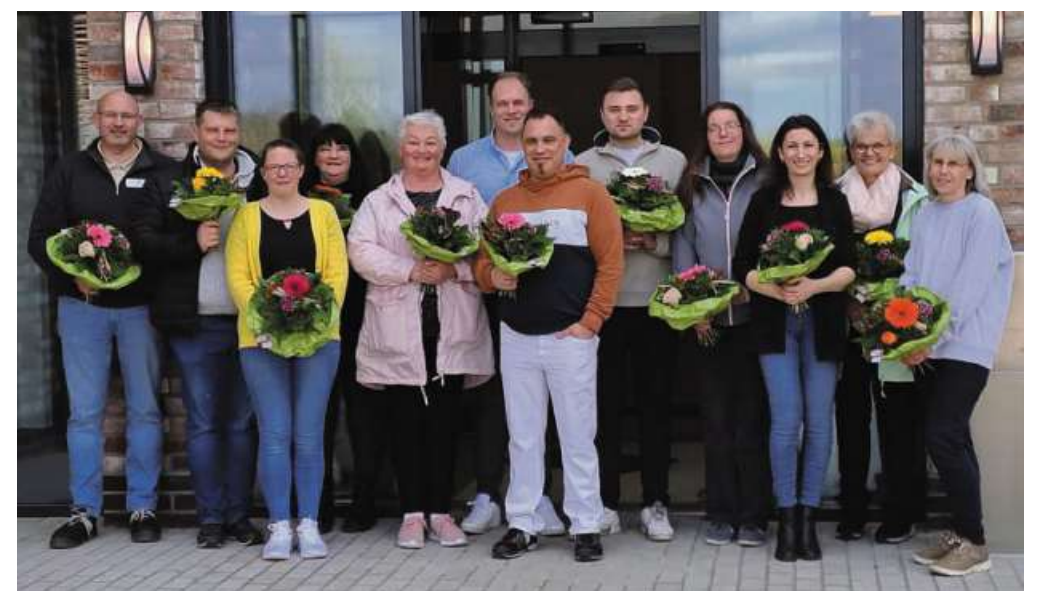
Die zum 15. April eingestellten Mitarbeiterinnen und Mitarbeiter freuen sich auf die Eröffnung der Leguna Residenz.