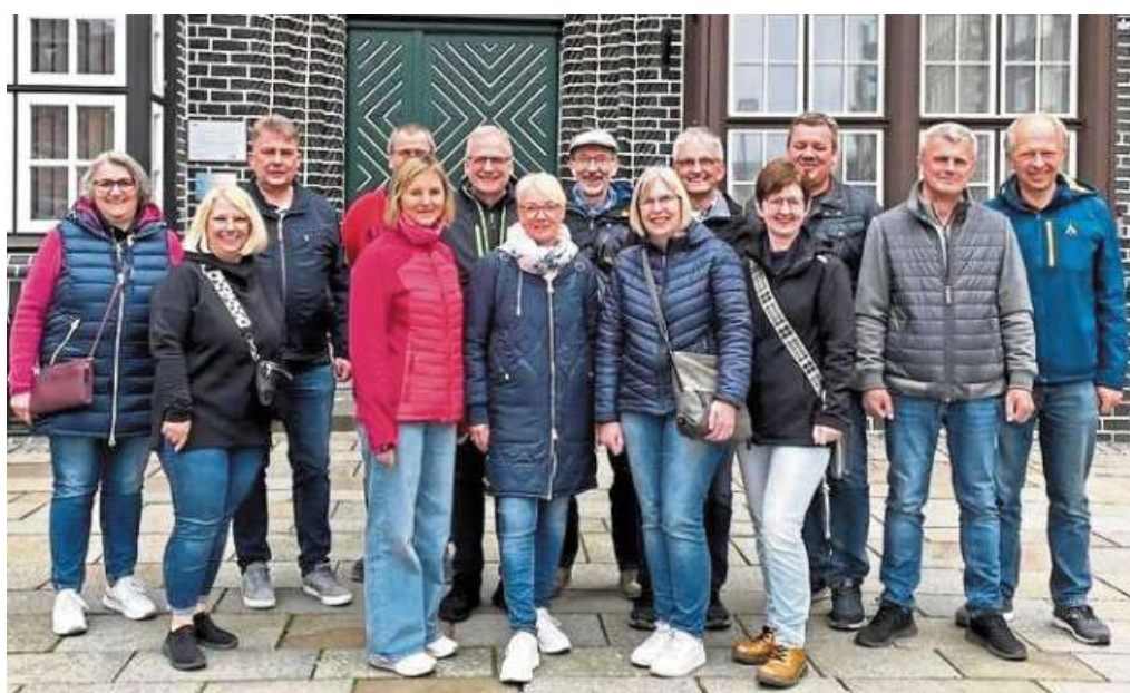
40 Jahre nach ihrem gemeinsamen Schulabschluss ging es für diese Gruppe erneut zusammen auf Klassenfahrt.