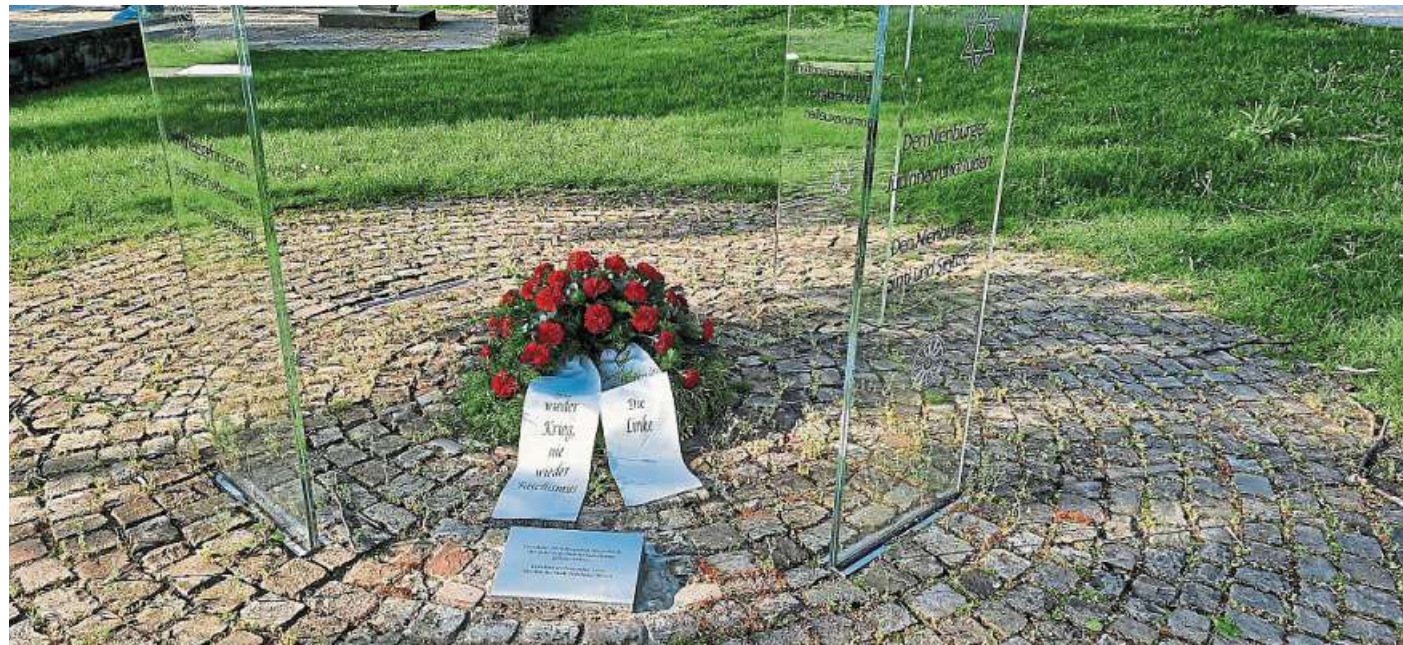
An der Gedenkstele am Nienburger Weserwall legten Teilnehmende einen Kranz nieder.

Erstens solle dann die derzeit fehlende, vermutlich von