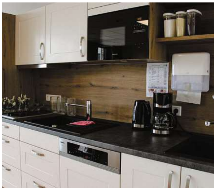
Die Gemeinschaftsräume sind mit einer modernen Küche ausgestattet.

tätig und hat diverse Stufen der Branche selbst durchlaufen. „Wir wollen ein liebevolles Umfeld schaffen, das Geborgenheit vermittelt. Dazu gehört auch, Verhaltensmuster verstehen und darauf reagieren zu können. Dabei hilft es uns zu wissen, welche Vorlieben und Abneigungen der Bewohner oder die Bewohnerin hat, aber auch, was für einen Tagesrhythmus er oder sie gewohnt ist.“ Sämtliche Informationen sorgen dafür, dass die Betreuung laufend auf das individuelle Bedürfnis angepasst wird. Mimik, Gestik und Stimme sind hierbei ebenfalls wichtige Faktoren in der Kommunikation. In den drei Wohneinheiten der Residenz – Am Schlossplatz, An der Wassermühle und Zur Aussicht – steht jeweils ein gemütlicher Gemeinschaftsraum zur Verfügung. Am Morgen findet hier etwa beim „Leguna-Klatsch“ ein persönlicher Austausch statt. Es werden Neuigkeiten, anstehende Ereignisse oder der Speiseplan besprochen. In Kleingruppen können auch – unabhängig von der Wohneinheit – viele verschiedene Angebote wahrgenommen werden. Je nach Interessen gibt es zum Beispiel Bewegungs-, Handarbeits- oder Lesegruppen. Regelmäßig jahreszeitlich stattfindende Feste runden das Angebot ab.