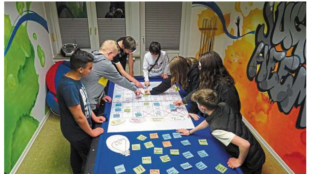
Die Jugendlichen sammelten Ideen und überarbeiteten auch die Hausregeln für ihren Treff in Heemsen.

Genau um dieses Thema ging es bei der sechstägigen Freizeit nach Hamburg. Bei zwei Vorbereitungstreffen planten und organisierten sieben Jugendliche ihre gemeinsame Zeit in der Hansestadt. Lediglich die Unterkunft, der Zeiträumen und ein zweiteiliger Workshop wurden als Rahmenbedingung im Vorfeld vorgegeben. Bei der Programmgestaltung mussten