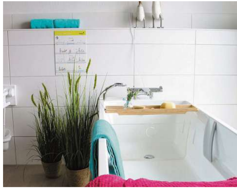
Das Pflegebad in der Leguna Residenz punktet mit hoher technischer Ausstattung.