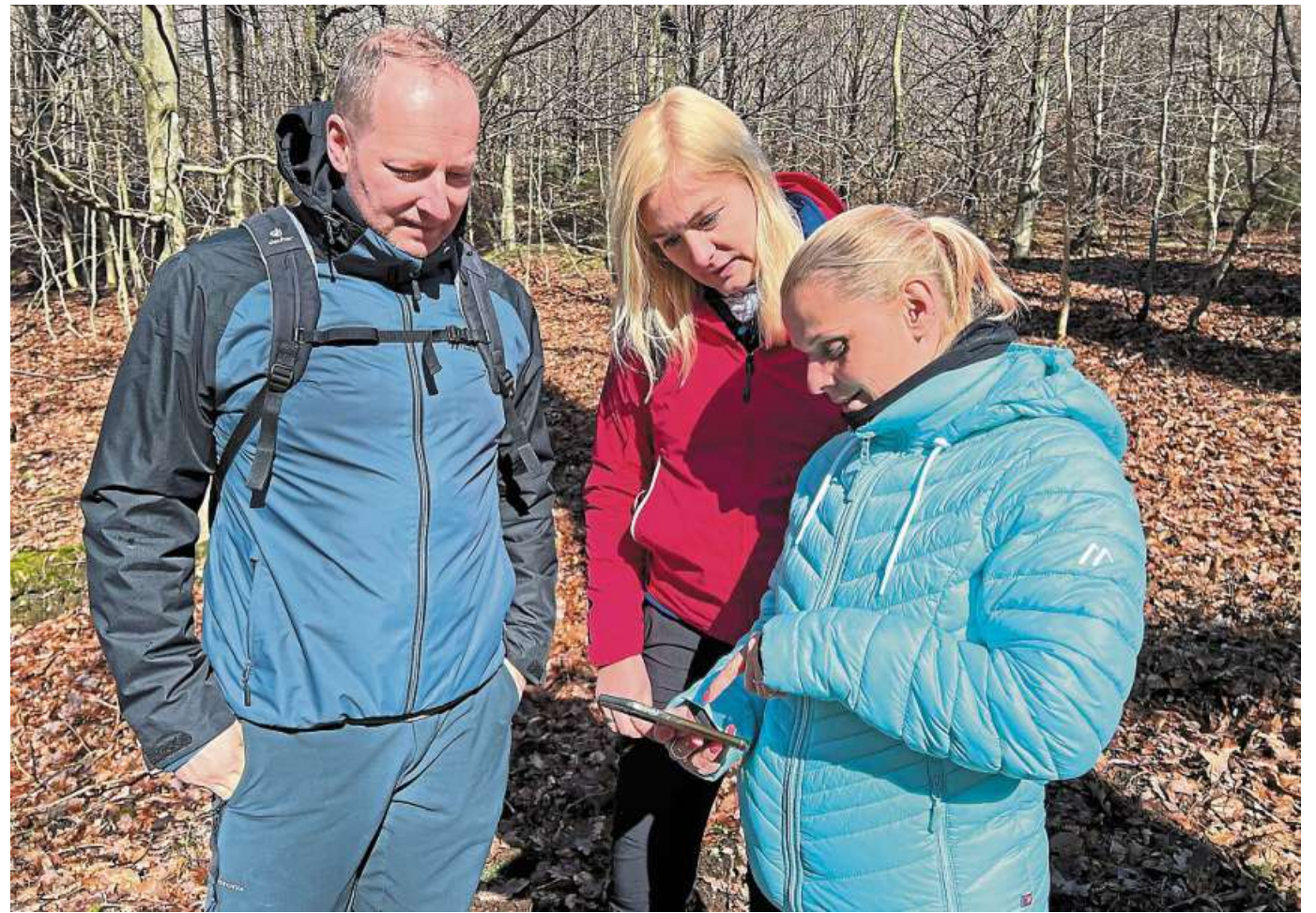
Die Region lässt sich nicht nur für Auswärtige sehr gut zu Fuß noch genauer kennenlernen.

Durch sanfte Hügel, Felder, saftige Wiesen, vorbei an Bachläufen können Wanderfreudige etwa im Bereich der Stadt Achim, der Gemeinde Weyhe, des Flecken Langwedel und der Samtgemeinde Bruchhausen-Vilsen, dem Waldgebiet Krähe, dem Gründerwald und auf den Spuren von Hermann Löns in Brokeloh wandern. Sehenswert sind die historischen Promenaden in Bad Rehburg. Hier wird der Gast in die Zeit der Romantik versetzt. Durch hölzerne Märchenskulpturen auf dem Brüder Grimm-Märchenweg wird dort der Bezug zur Deutschen Märchenstraße hergestellt. Und der Fernwanderweg Roswitha-Weg über 184 Kilometer verläuft von Nieburg nach Bad Gandersheim – von der Mittelweser-Region über das Wesergebirge, den Ith und den Hills. Bereits seit Jahrhunderten machen sich Menschen aus religiösen Gründen auf den Weg – sie pilgern. Mehrere Pilgerwege wie der Sigwardsweg, der Jakobsweg Bremen-Os-