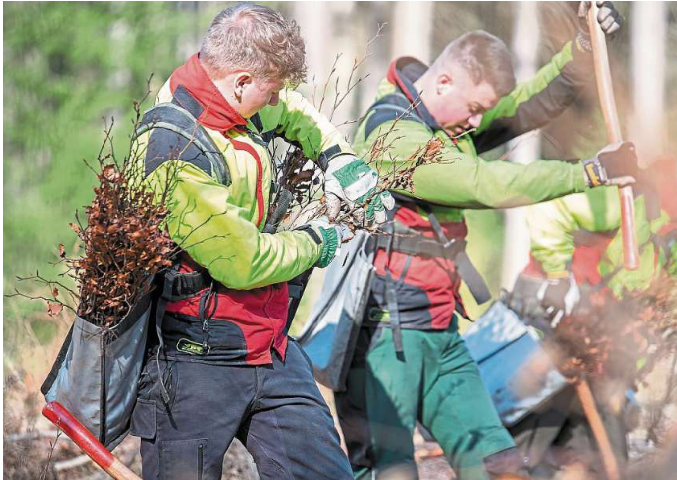
36000 Bäume wurden auf 15 Hektar im Bereich der Försterei Krähe gepflanzt.

Stolzenau. Die Tafel in Stolzenau ist umgezogen. Ab sofort, also ab dem heutigen Mittwoch, hat die Tafel im einstigen Blumenhaus d'Apolonia, direkt hinter dem Stolzenauer Rathaus, ihr neues Domizil gefunden. Die Räumlichkeiten in der katholischen Kirche waren langsam zu eng geworden. Das Ausweichquartier im Stolzenauer Zentrum kann zur Verfügung gestellt werden, weil die Gemeinde die Liegenschaft schon vor einigen Monaten erworben hat.