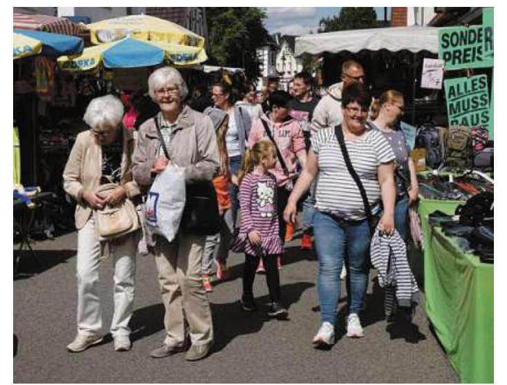
Am Maifestsonntag kann wieder nach Herzenslust gestöbert und geschneppt werden.

Auch in diesem Jahr hoffen die Veranstalter des Maifestes auf gutes Wetter und zahlreiche Besucher.