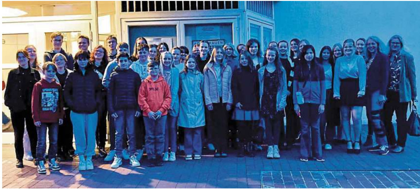
Hamlet: Einen Klassiker sah sich eine Gruppe der Nienburger ASS im Theater auf dem Hornwerk an.