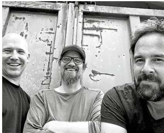
„Genial Rusty City“ sind zurück auf der Bühne.