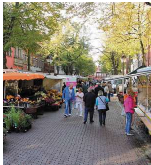
Munteres Treiben in der Nienburger Innenstadt.

Die Lebensqualität im Kreis wird außerdem geprägt durch eine gewachsene Einzelhandelsstruktur mit vielen Fachgeschäften und Bädern sowie durch eine flächendeckende Schulstruktur mit mehreren Gymnasialstandorten, einer Gesamtschule in Nienburg, Oberschulen, einer privaten Realschule sowie den Berufsbildenden Schulen in der Kreisstadt. Außerdem gibt es in den einzelnen Gemeinden zahlreiche Grundschulstandorte und Kindergärten.