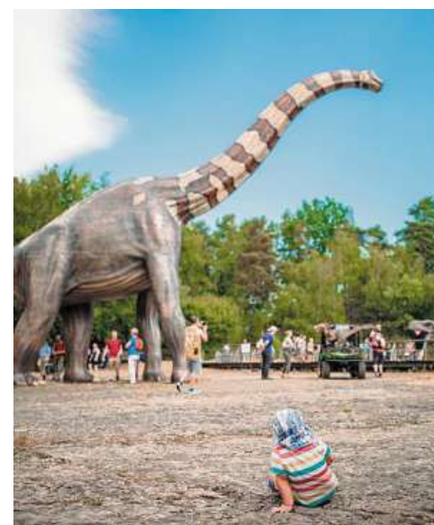
Es locken Ausflugsmöglichkeiten für Jung und Alt.

Der Landkreis Nienburg mit seinen rund 121.000 Einwohnern und einer Fläche von etwa 1400 Quadratkilometern liegt in einer abwechslungsreichen Wasser-, Wiesen-, Moor- und Waldlandschaft. Die Nähe zu den Metropolen Hannover und Bremen, die zentrale Lage in Niedersachsen, die gute Verkehrsanbindung und eine gesunde Wirtschaftsstruktur sind die Standortvorteile, mit denen der Kreis punktet. Nicht zu vergessen: Der Wirtschaftsraum Mittelweser hat Tradition, die sich in einer bemerkenswerten Branchenvielfalt widerspiegelt. So finden hier seit Jahrzehnten international bedeutsame Unternehmen der Glas-, Papier- und Chemieindustrie beste Standort- und Arbeitsbedingungen. Mittelständische Firmen, vom Automobilzulieferer für die Lebensmittelherstellung bis hin zum Anlagenbau, verstärken diese Wirtschaftskraft. Dazu kommen traditionsreiche, aber gleichermaßen innovative Handwerks- und Landwirtschaftsbetriebe, die seit Genera-