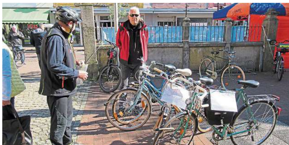
Der Fahrradflohmarkt des ADFC lädt zum Fachsimpeln ein. Aber auch Verkehrspolitik ist ein Thema.

ADFC lädt am 15. April zum Fahrradflohmarkt ein