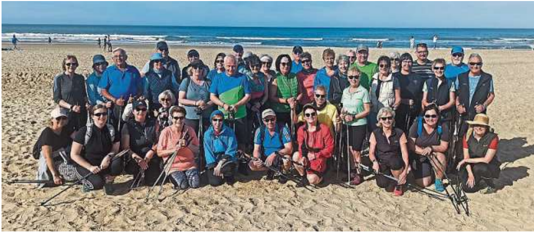
Die 17. Nordic-Walking-Reise begeisterte auch wegen des tollen Wetters.