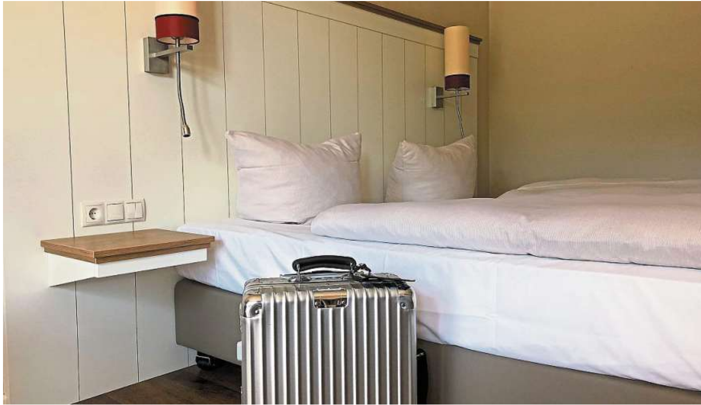
Der Tourismus in der Mittelweser-Region nahm im Jahr 2022 wieder Fahrt auf - die Übernachtungszahlen stiegen im Vergleich zum Vorjahr.

Die Mittelweser-Region konnte das Jahr 2022 ebenfalls mit einem besseren Er-