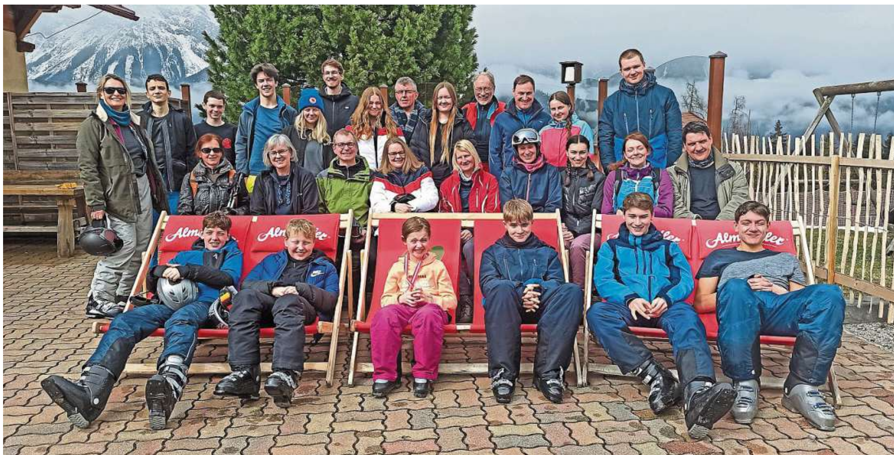
Die Oster- und Familienski freizeit der Skizunft Nienburg führte nach Schladming in Österreich.

Die Oster- und Familienfreizeit der Skizunft Nienburg führte nach Schladming