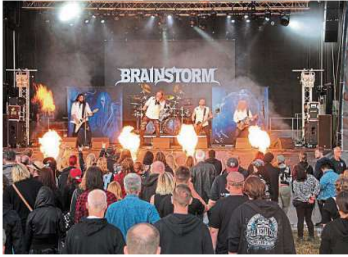
Livemusik gibt es unter anderem beim Open-Air-Festival „Rock das Ding“ in Holzbalge.