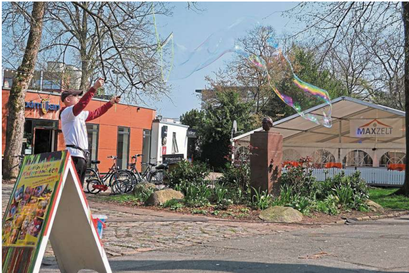
Im „Maxzelt“ am Ernst-Thoms-Platz findet am 15. April zum zweiten Mal ein Markt-Frühstücksbuffet statt

Frühjahrsmarkt vom 13. bis 16. April wieder in der Innenstadt