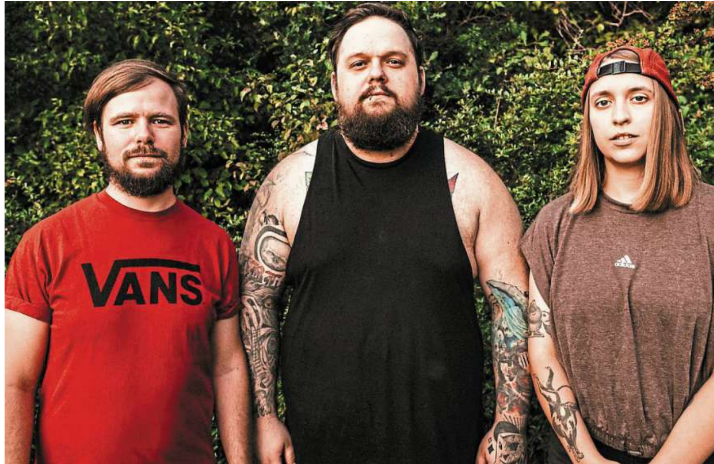
„Blacktoothed“ sind der Headliner bei MAD am 15. April in Nienburg.

„Forty37“ aus Bremen spielen Punk-Rock mit Einflüssen aus modernem Pop-Punk und Texten, die sich thematisch nahtlos in die Lyrics der frühen 2000er Emo- und College Punk-Bands einreihen würden. Die Bremer Combo hat sich 2021 ge-