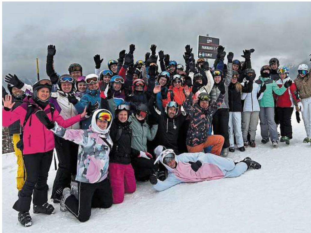
42 Jugendliche waren mit der Skizunft in den Skigebieten rund um Luttach.

Der Skibus fuhr die Teilnehmenden von Luttach aus in fünf bis zehn Minuten in die beiden Skigebiete. Skiausleihe und Service vor Ort waren wie immer – großartig. Großzügige und schneesichere Pisten, Funparks, viele urige Hütten und ausgefallene Überraschungen sorgten für viel Abwechslung.