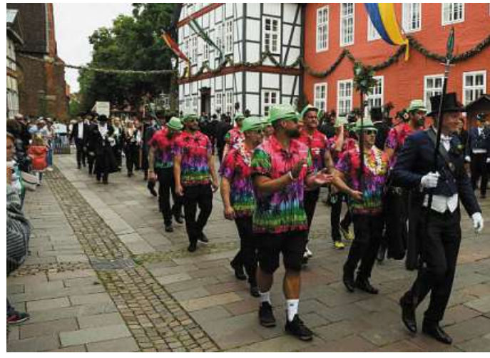
Das jährliche Scheibenschießen zieht Ausmarschierende und Schaulustige in Nienburgs Innenstadt.