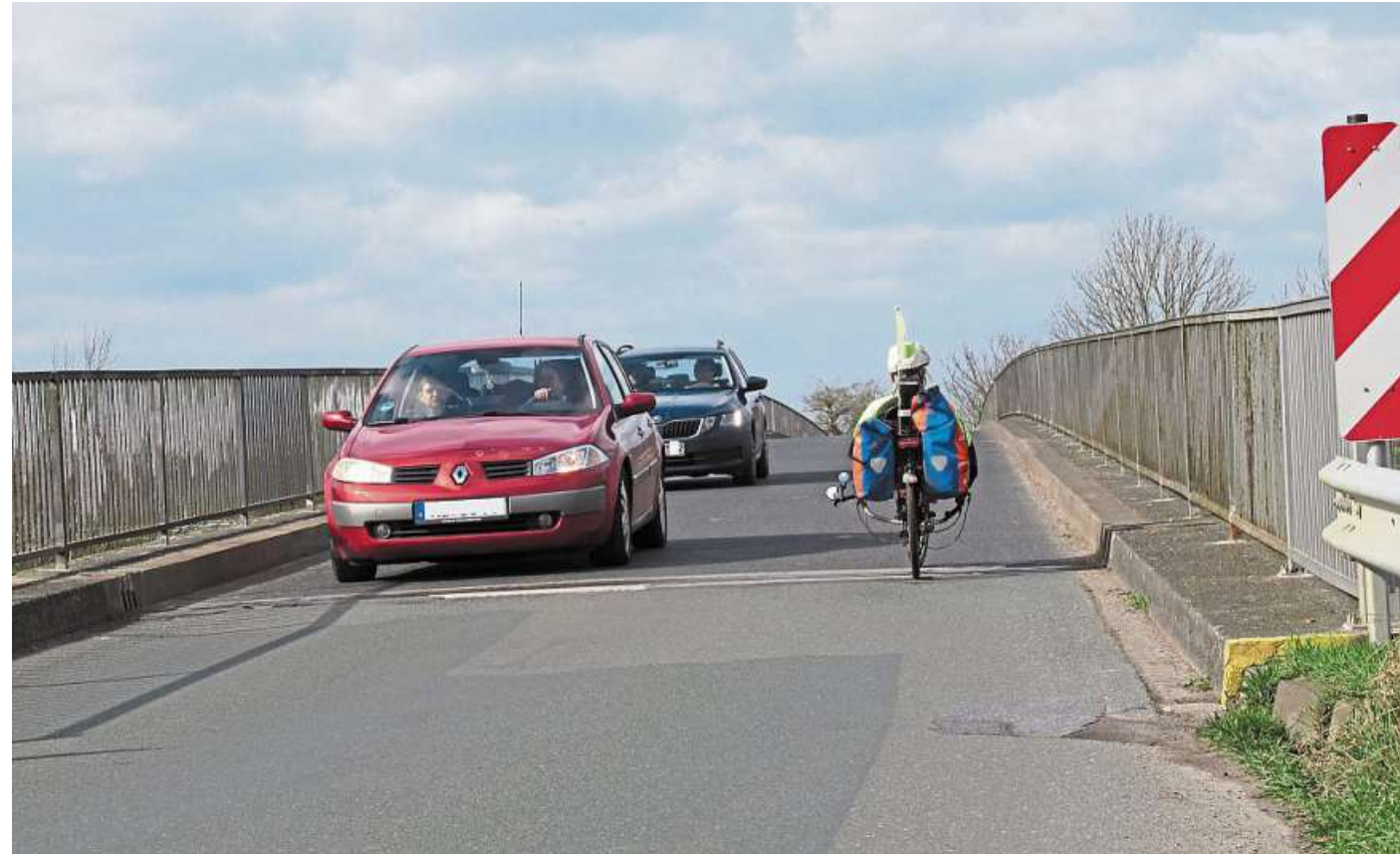
Der ADFC schlägt für die beiden Weserbrücken ein spezielles Überholverbot vor. Fahrradfahrer würden dadurch weniger bedrängt.

Dieses Schild könnte nach Überzeugung des ADFC Abhilfschaffen.