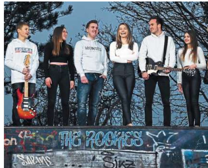
Das „MAD“ wird von „The Rookies“ aus Hoya eröffnet.