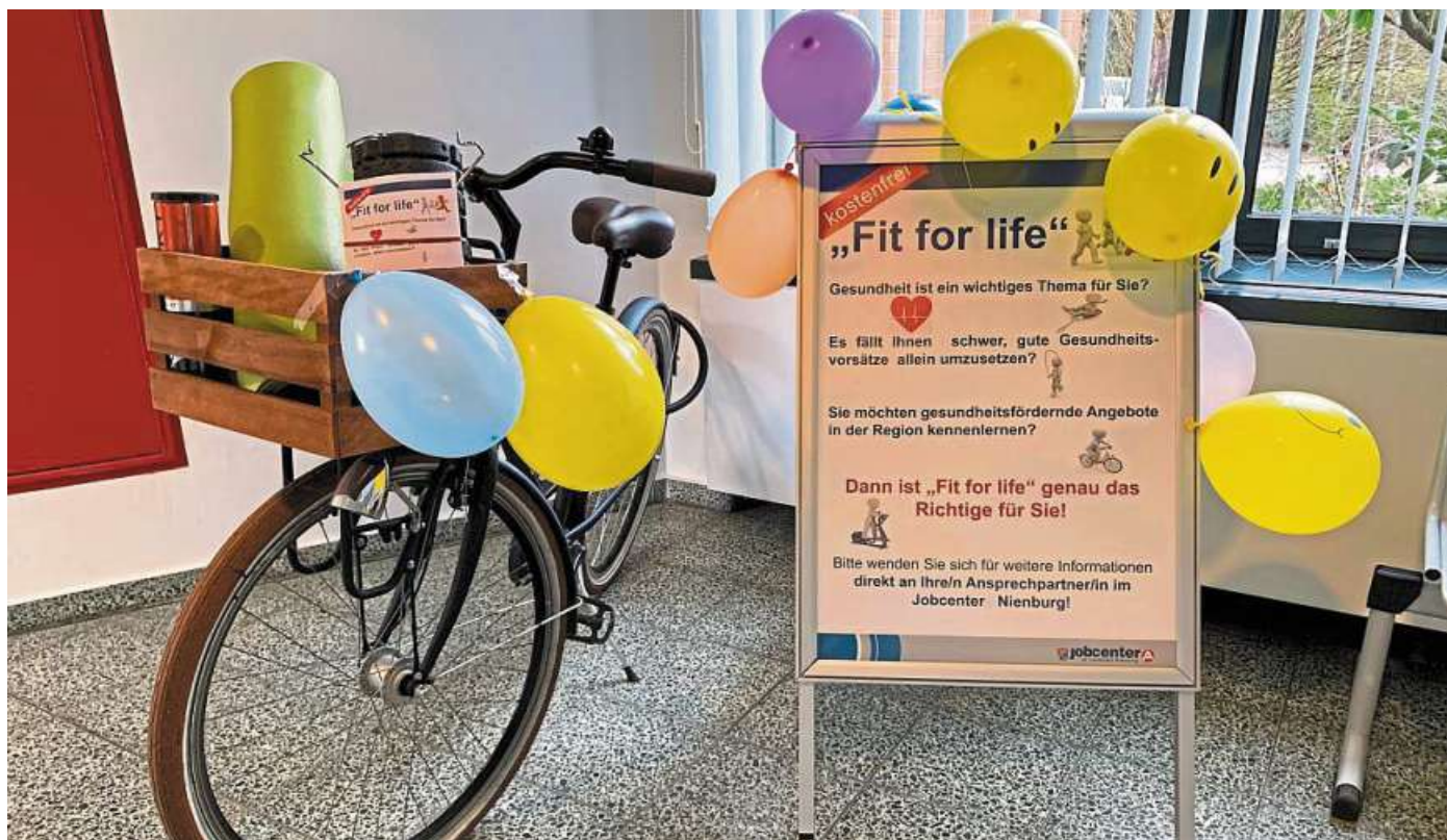
Das nächste kostenfreie „Fit for life“-Seminar findet am 19. und 20. April statt.

„Gerade jetzt nach den langen Corona-Jahren ist das Thema unglaublich wichtig. Gesundheit ist elementar zum Wiedereinstieg in das Er-