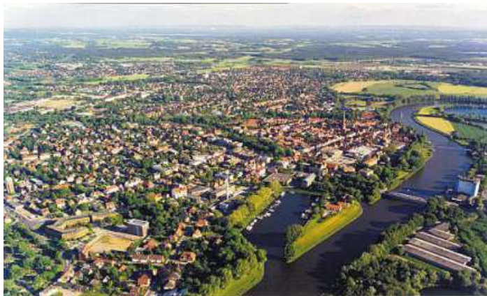
Viel Fläche, viel Grün, vergleichsweise wenig Bebauung. Im Landkreis Nienburg lebt es sich gut mit viel Platz.