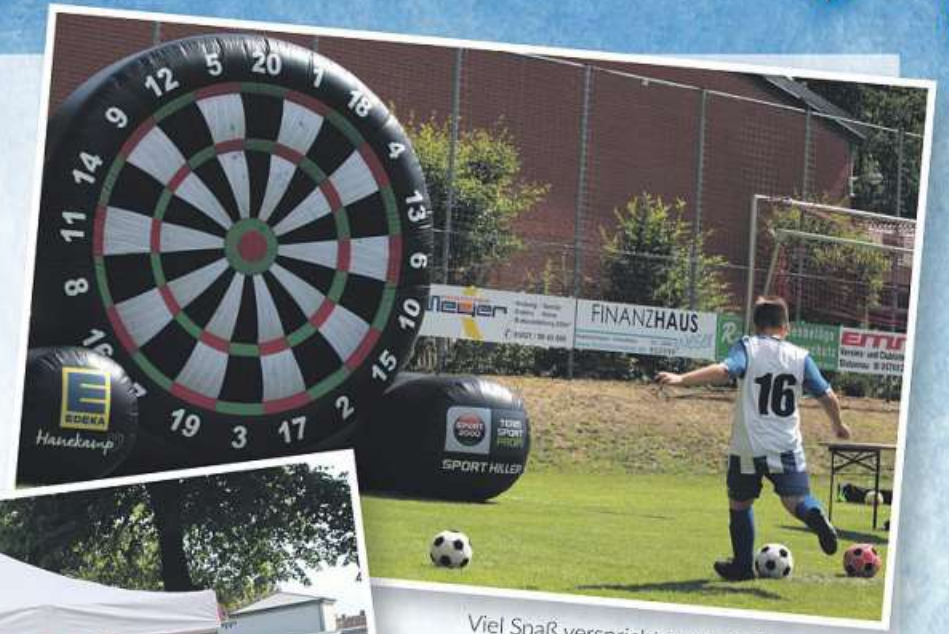
Viel Spaß verspricht auch die Fußball-Dart-scheibe.

ukrainischem Leitbild stehen. Dort können sich die Gäste vor blauem Himmel und zwischen Heuballen fotografieren lassen. Organisiert wird diese Fotowand von in der Flüchtlingshilfe tätigen Kreis-Nienburgern. Sie sorgen auch für Bastel- und Malangebote, die am Bürgermeister-Stahn-Wall angeboten werden. „Das Kulturfest richtet sich an alle Menschen aus dem gesamten Landkreis