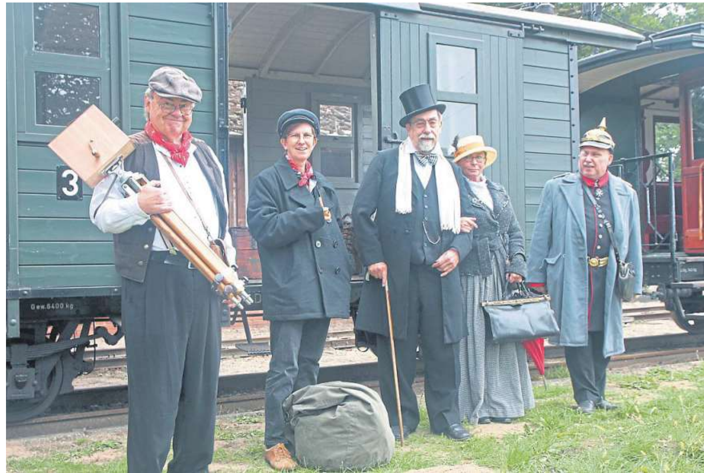
Am ersten Septemberwochenende lädt die Museums-Eisenbahn zu einem besonderen Bahnerlebnis ein, das unter dem Motto steht „Kleinbahn in der Kaiserzeit“.

An beiden Fahrtagen gilt ein besonderer Fahrplan. Um 11 Uhr wird sich der erste Dampfzug in Bewegung setzen, um nach Asendorf aufzu-