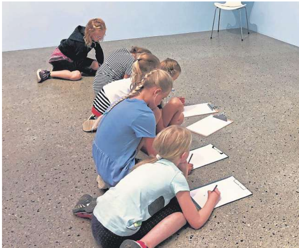
Im Rahmen des Ferienpasses hatte die Kunstschule Mittelweser Kinder in der letzten Ferienwoche zu einem Abenteuerbesuch ins Sprengelmuseum eingeladen, um bunte Tiere zu entdecken.

Kunstschule Mittelweser hatte zu Abenteuerbesuch ins Sprengelmuseum eingeladen