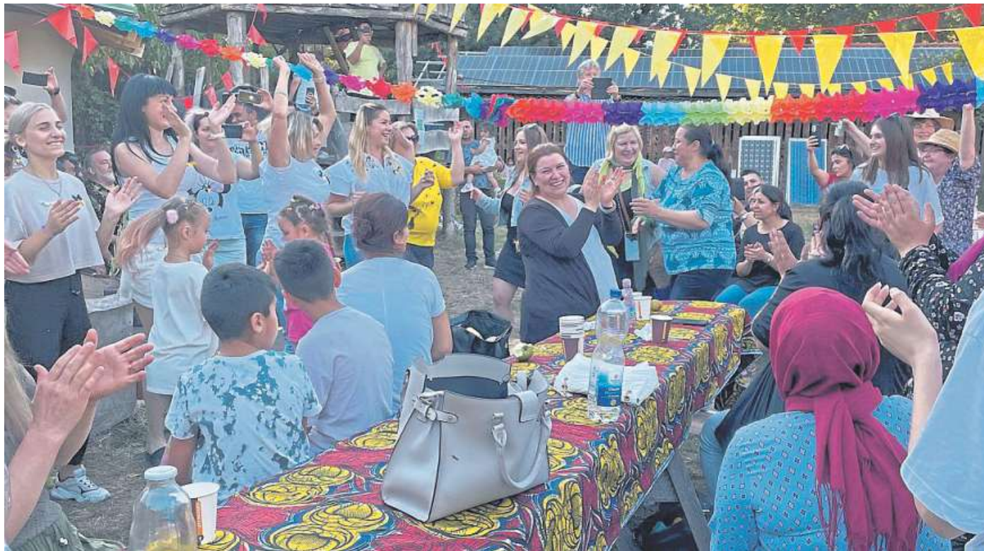
Schon bald wurde gemeinsam gefeiert beim Sommerfest der Flüchtlingsinitiativen aus Nienburg, Heemsen, Liebenau und Marklohe auf dem Gelände des Heuhotels in Schweringen.

Der Plan ist aufgegangen. „Haben anfangs noch die Kunden zur Musik der Musiker aus Syrien und die Menschen aus der Ukraine zu der Musik der ukrainischen Band getanzt, spielten diese kulturellen Unterschiede schon bald