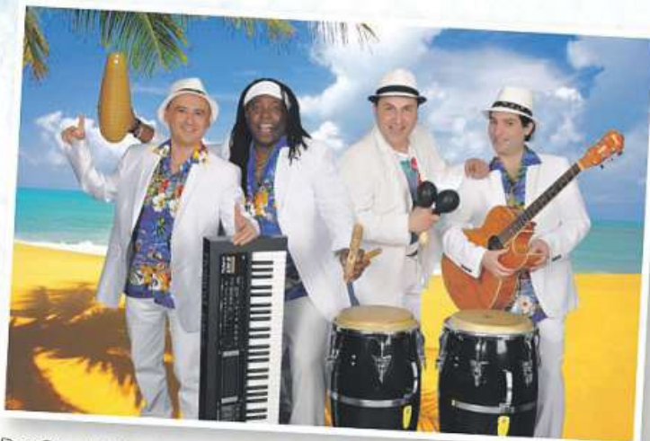
Das Quartett Latino Total sorgt für karibische Live-Musik.