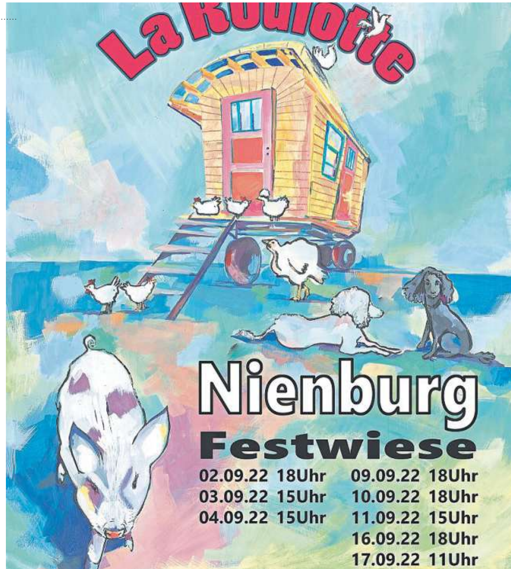
Auf Nienburgs Festwiese gastiert der Piglet Circus vom 2. bis 17. September.