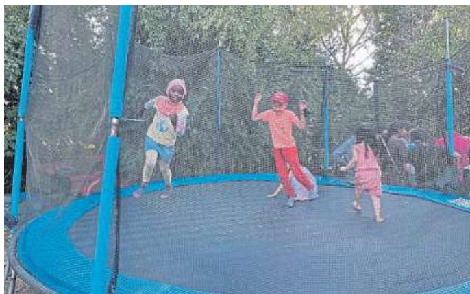
Das Trampolin war bei den Kindern heiß begehrt.