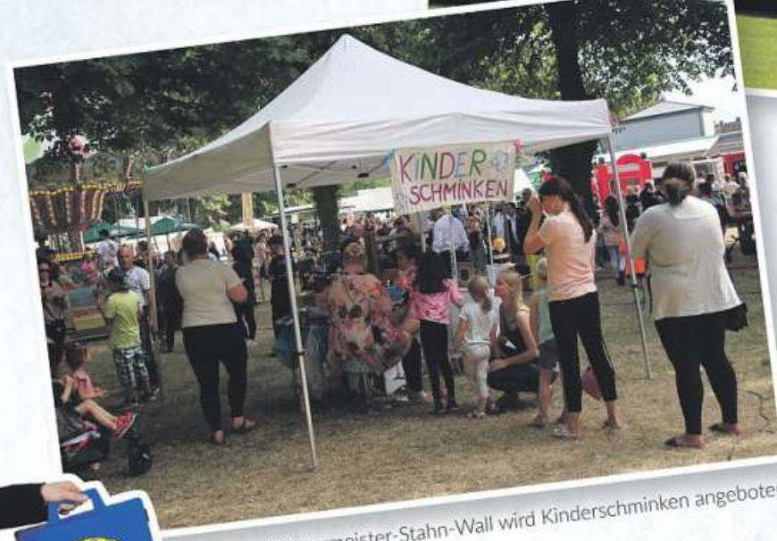
Am Bürgermeister-Stahn-Wall wird Kinderschminken angeboten.