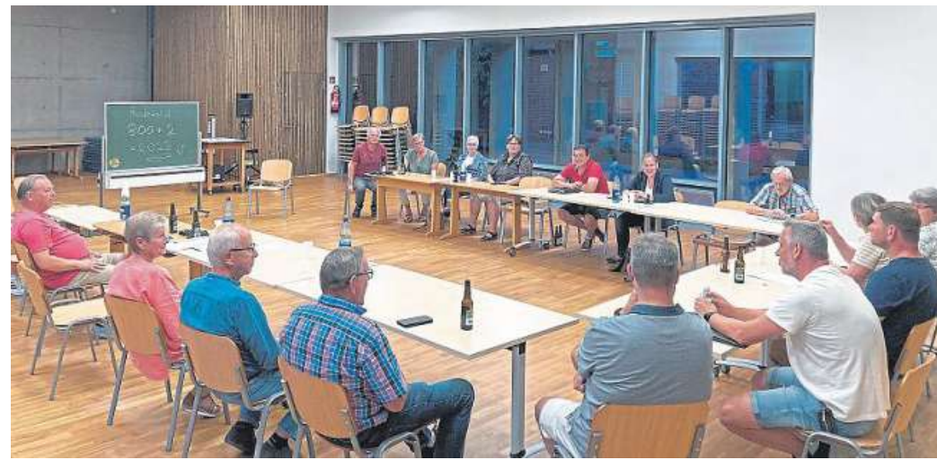
800 plus 2: Das soll im kommenden Jahr vom 24. bis 26. August in Rodewald groß gefeiert werden.

„Wir haben also noch gut ein Jahr Planungszeit“, sagte Stefan Göbel, einer der Orga-