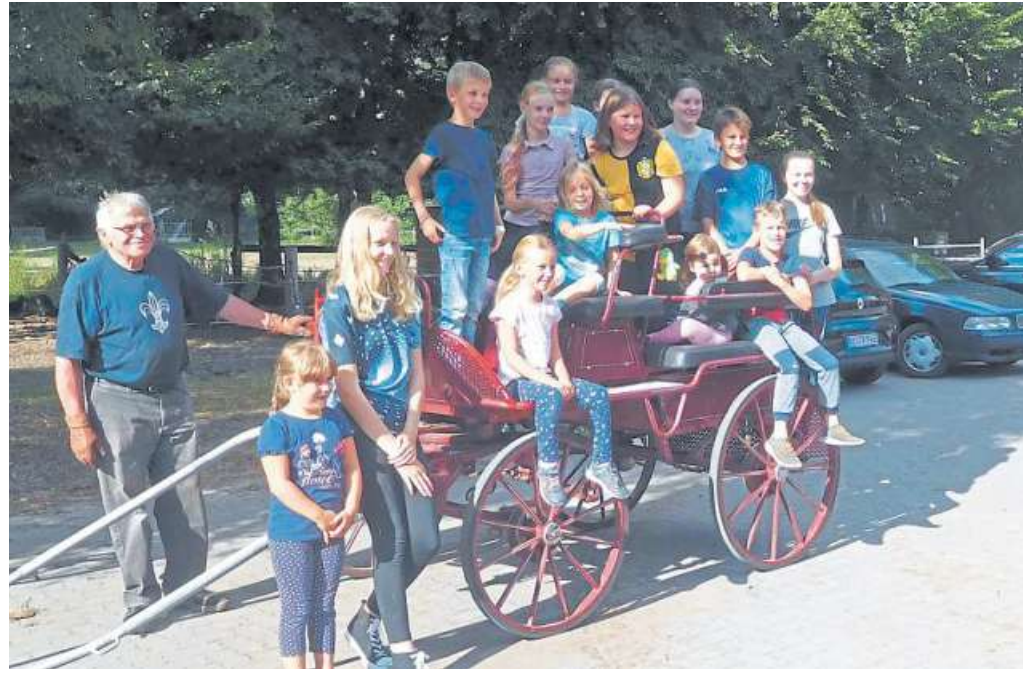
Einen kurzweiligen Nachmittag verbrachten die Ferienspaß-Kinder beim Reit- und Fahrverein Eystrup.

In der Reithalle ging es weiter mit Voltigieren. Dort wartete schon Robin auf die