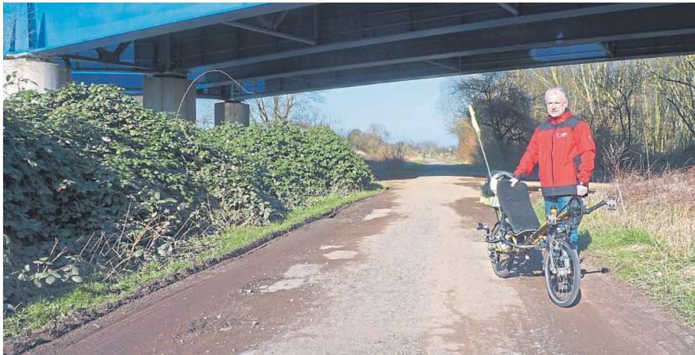
Die Schäden sollen zeitnah behoben werden. Diese Antwort aus dem Rathaus zu der Frage, warum ausgerechnet Nienburg so wenig in den Weserradweg investiert, dürfte nicht nur Berthold Vahlsing vom örtlichen ADFC freuen.

Schäden am Weserradweg sollen zeitnah behoben werden