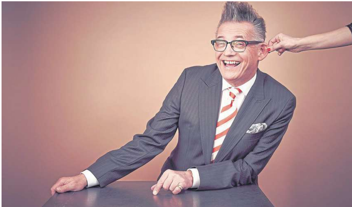
Der Entertainer und Musiker Götz Alsmann verspricht viel L.I.E.B.E an diesem Abend.

Bei buchstäblich Tausenden von Konzerten haben sie an Alsmanns immerwährendem Einsatz für den Jazzschlager