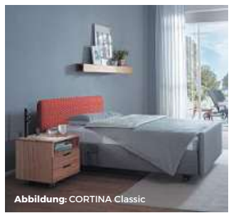
Abbildung: CORTINA Classic

Lebensqualität auf ganz neuem Niveau – für heute, morgen und übermorgen.