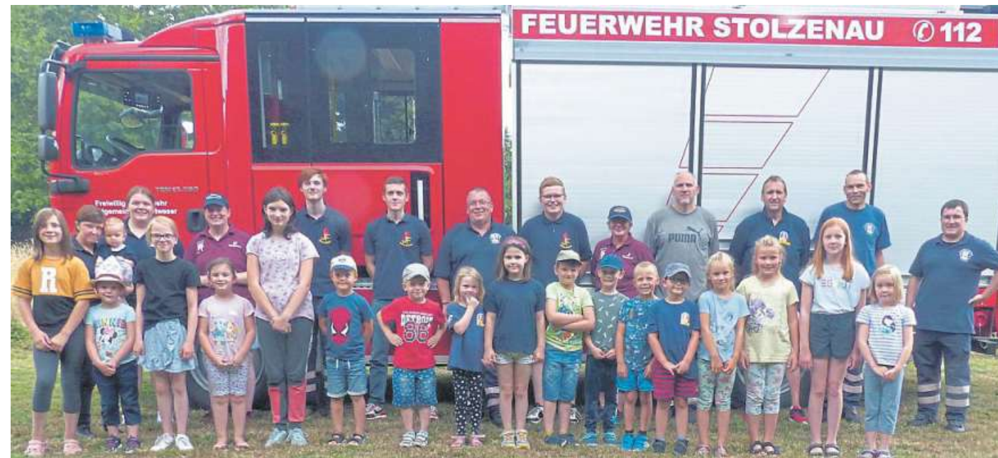
Die hochmotivierten Kinder und die Helfer der Ferienpassaktion in Stolzenau.

Gefragt waren Geschicklichkeit und Schnelligkeit. Im Vordergrund stand aber im-