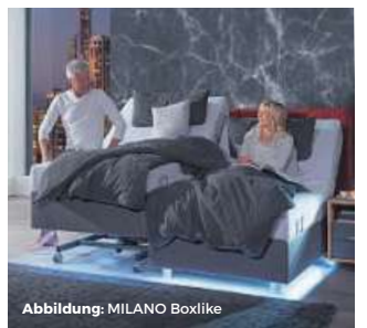
Abbildung: MILANO Boxlike