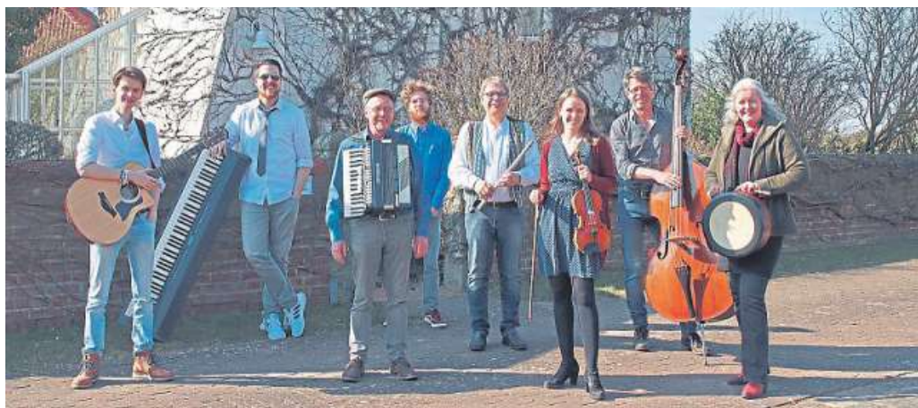
Treten gemeinsam mit dem Sextett der ASS Nienburg auf: Old Chapel Five in neuer Besetzung.