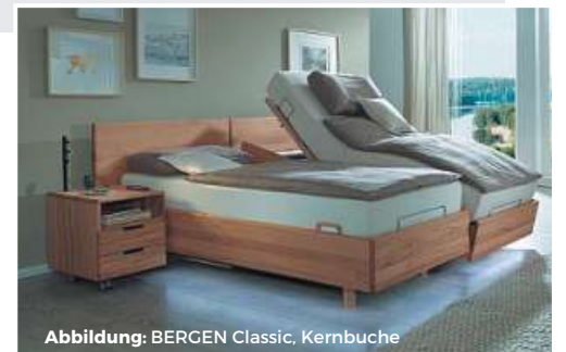
Abbildung: BERGEN Classic, Kernbuche

Erleben Sie Kirchner Betten live bei Ihrem Fachhändler: