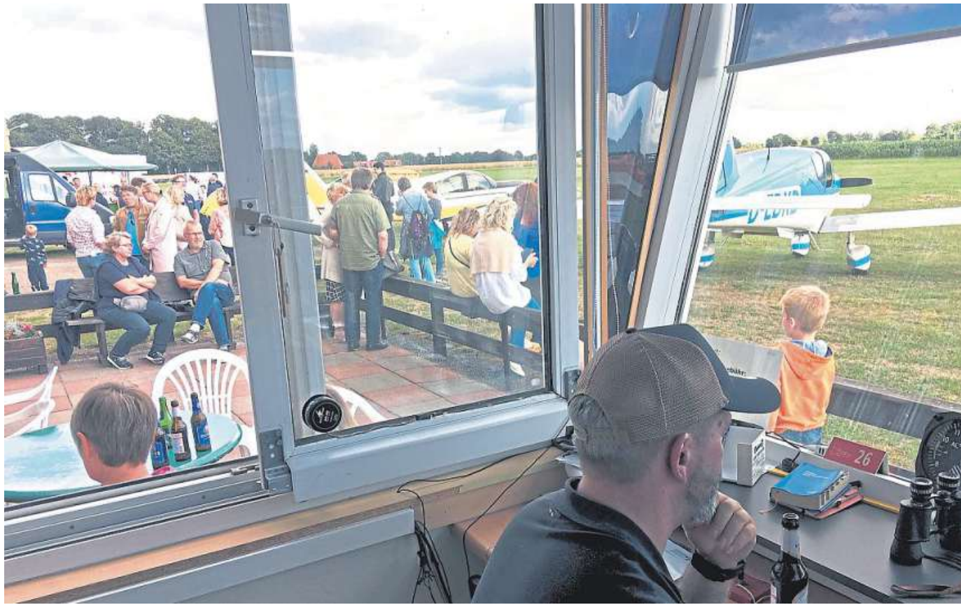
Die Flugleitung sorgte auch während des meist sonnigen und gut besuchten familiären Treffens in Holzbalge für Sicherheit in der Luft und am Platz.