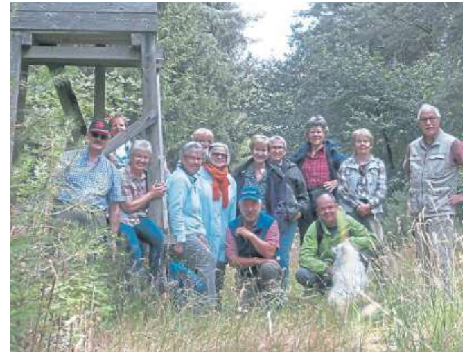
Die Wandergruppe des SSV Rodewald war in Wald und Flur unterwegs.