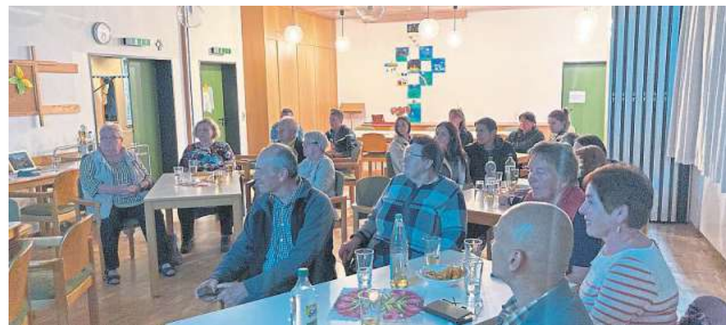
Deutsche und Ukrainer tauschen sich im Gemeindehaus in Loccum aus.

Arbeitsgemeinschaft der evangelischen Frauen im Kirchenkreis Stolzenau-Loccum hatte eingeladen