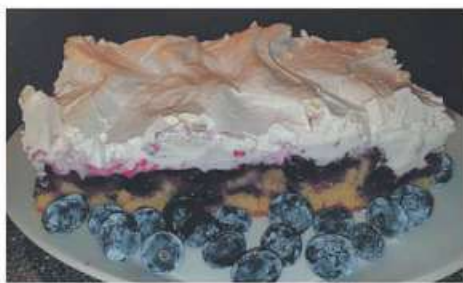
Der Kuchen, wie hier passend zur Saison mit Blaubeeren, ist beliebt.