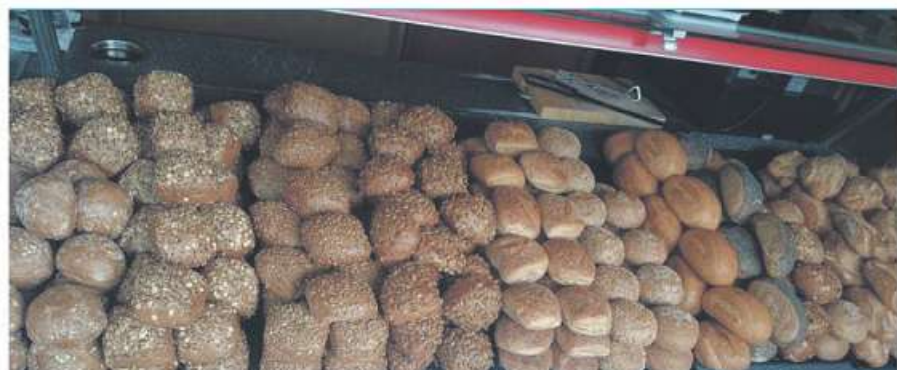
Eine große Auswahl an Brötchen gibt es in der Bäckerei.