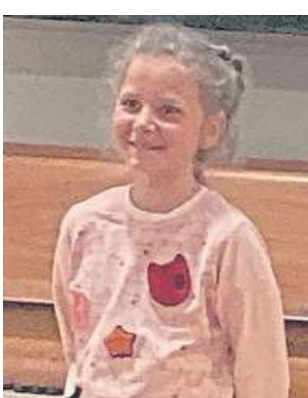
Die 10-jährige Ukrainerin erhält Applaus nach ihrem bewegendem Klavierspiel.

Der Höhepunkt des Abends war das Klavierspiel eines 10-jährigen Mädchens aus der Ukraine. Sie hatte spontan gefragt, ob sie etwas spielen könne. Die Ukrainer sangen dann ein Volkslied aus ihrer Heimat. Als Antwort darauf stimmte Pastorin Corinna Diestelkamp mit den deutschen Besucherinnen das