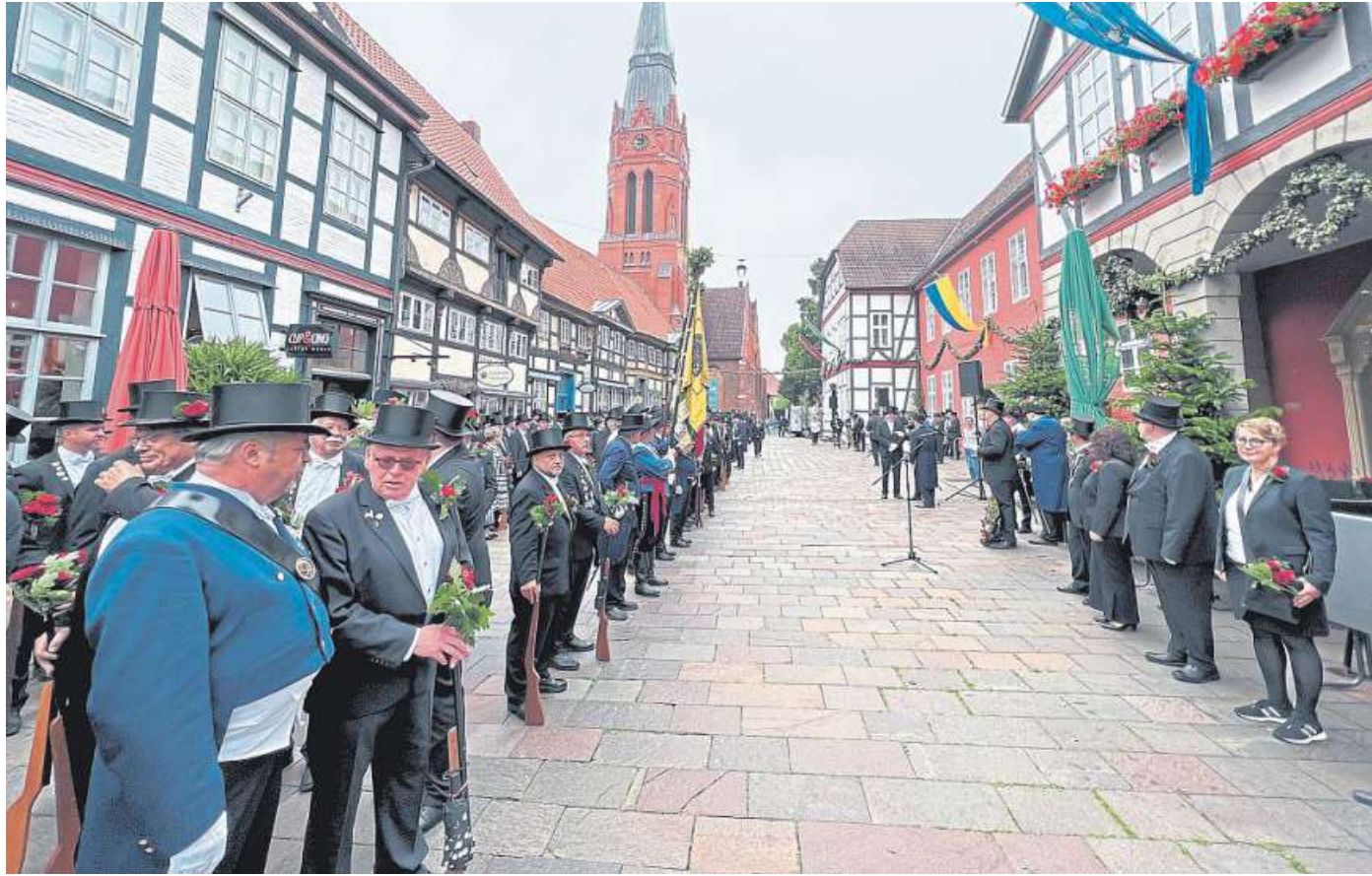
Der Tourismus mit Outdooraktivitäten, Veranstaltungen und Sehenswürdigkeiten bringt viel Geld in die Mittelweser-Region und ist ein wichtiger Image- und Wirtschaftsfaktor.

Umso wichtiger ist es, die Wirkung und Relevanz des Tourismus für die Wirtschaft deutlich zu machen. Der Tourismus ist Umsatzbringer und leistet über Steuereinnahmen einen Beitrag zur Finanzierung der öffentlichen Haushalte. Er schafft und sichert ortsbundene Arbeitsplätze und ist Jobmotor für Menschen mit unterschiedlichen Berufsquali-