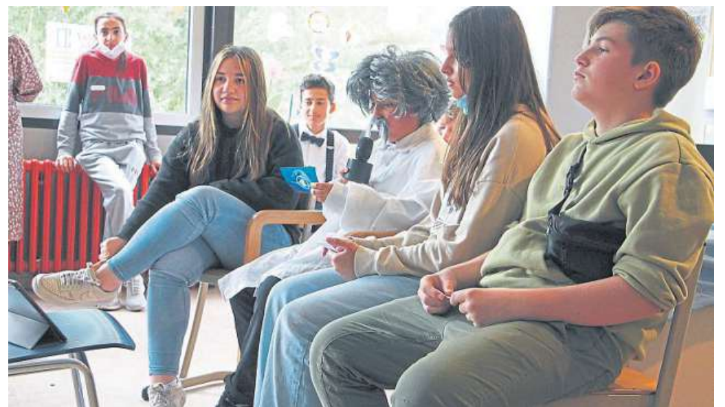
Für Gesprächsrunden schlüpften Kinder in die Rollen Schweitzers und seiner Weggefährten.

aber das Leben in Lambaréné im zentralafrikanischen Gabun. Dort hatte Schweitzer ein Krankenhaus gegründet. Auf einem Fragebogen sollten die Gäste aus dem fünften Jahrgang schließlich möglichst viele Fragen beantworten. Die Zeit war knapp. Wer sich geschickt aufgeteilt hatte, konnte gleichzeitig die Antworten auf mehrere Fragen herausfinden. Gefragt war also auch Kooperation und Miteinander. Auf den Schulhof war die Klasse 6e ausgewichen. Sie brauchte für ihre Aktionen Platz, viel Platz. Dort durften die Mädchen und Jungen der fünften Klassen lernen und toben gleichzeitig. Fragen galt es etwa zu beantworten im