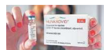
Der proteinbasierte Impfstoff „Novavax“.

Auch die Hospitalisierung und die Belegung der Inten-