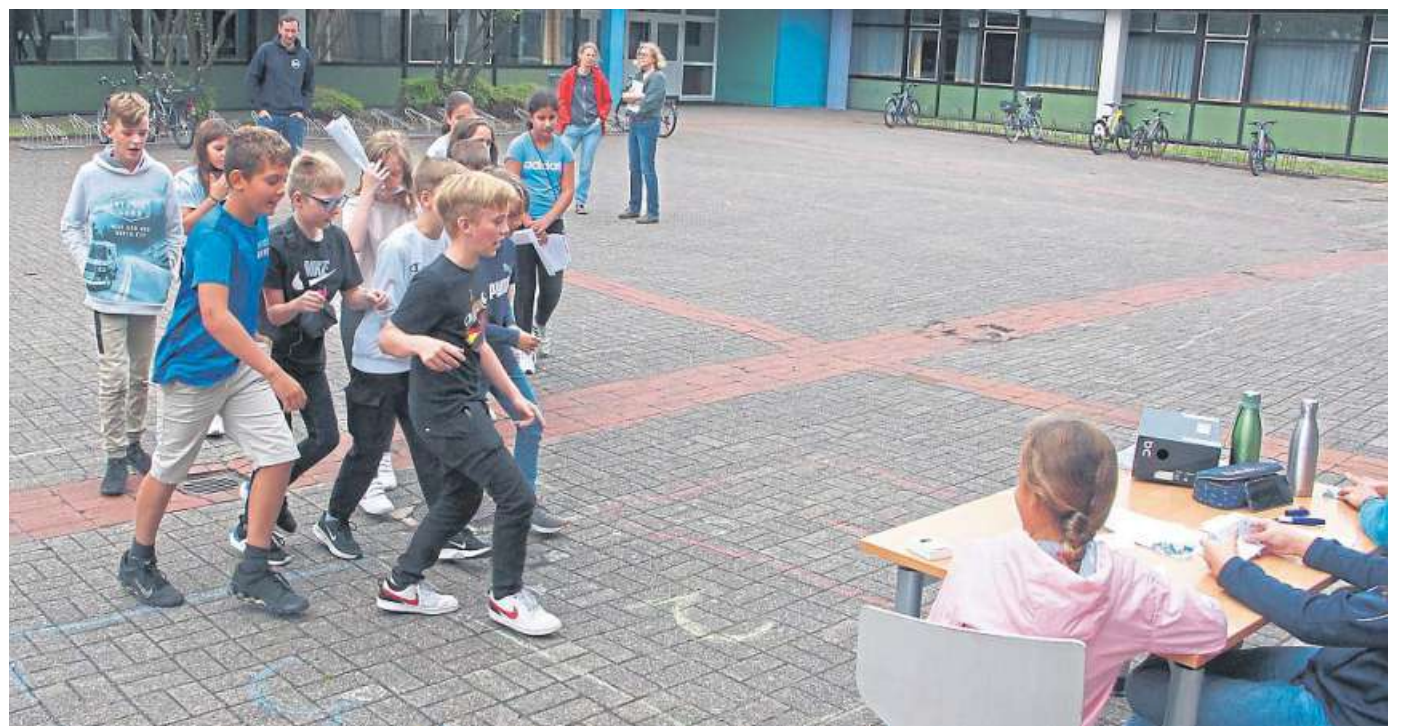
Wie in der Fernsehserie „1, 2 oder 3“ sollten Kinder Fragen beantworten.

Wuselig ging es im Klassenraum der 6d zu. Auf Plakaten hatten die Schülerinnen und Schüler die Biografie Schweitzers aufgeschrieben – von der Geburt über sein Wirken bis zum Tod. Den Fokus bildete