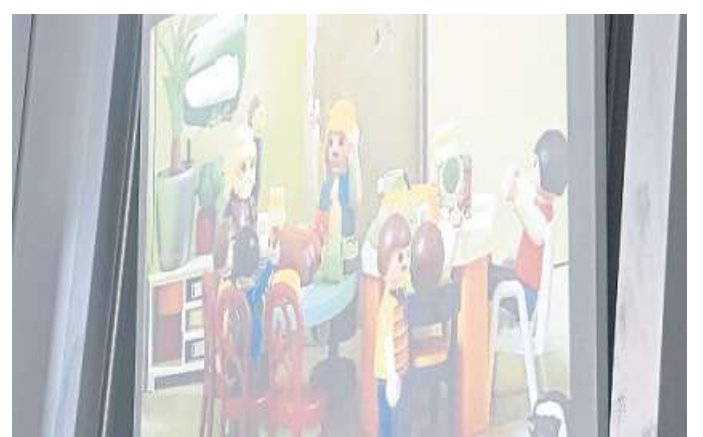
Auch mit kleinen Stop-Motion-Filmen wurde Schweitzers Leben dargestellt.

Am Ende dürften die Vorbereitung und die Stationen selbst sowohl den Sechstklässlern als auch den Fünftklässlern etwas gebracht haben – neues Wissen und gemeinsames Arbeiten an einem Thema.