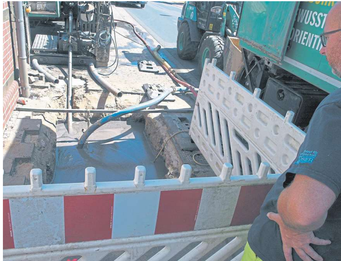
Auf dem Foto begutachtet Carsten Lückemeier die neue Trinkwasserleitung.

Statt wie bisher auf Fahrbahnhöhe verläuft die neue Trinkwasserleitung zehn Me-