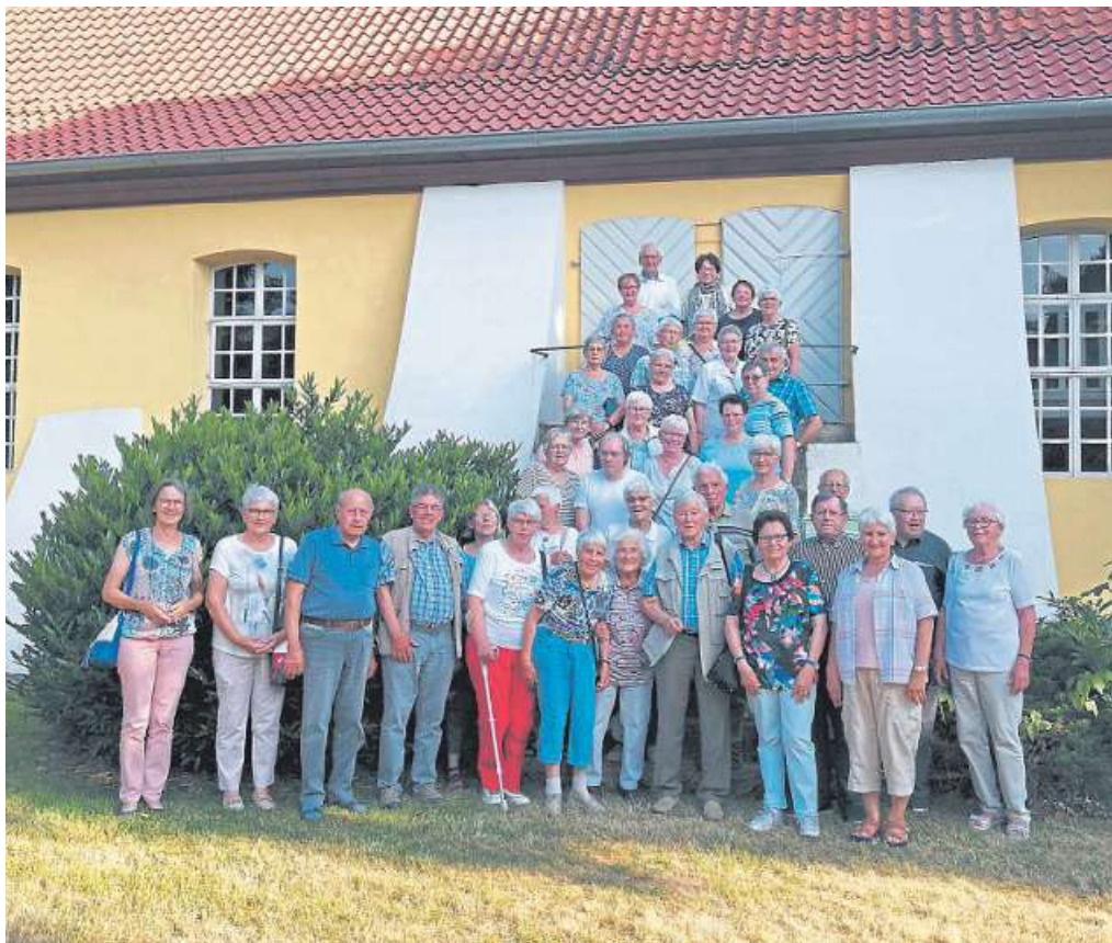
Die Teilnehmenden des Husumer Begegnungs-Cafés waren vom Besuch der Glashütte Gernheim in Petershagen vollauf begeistert.

Begegnungscafé Husum besuchte Glashütte Gernheim