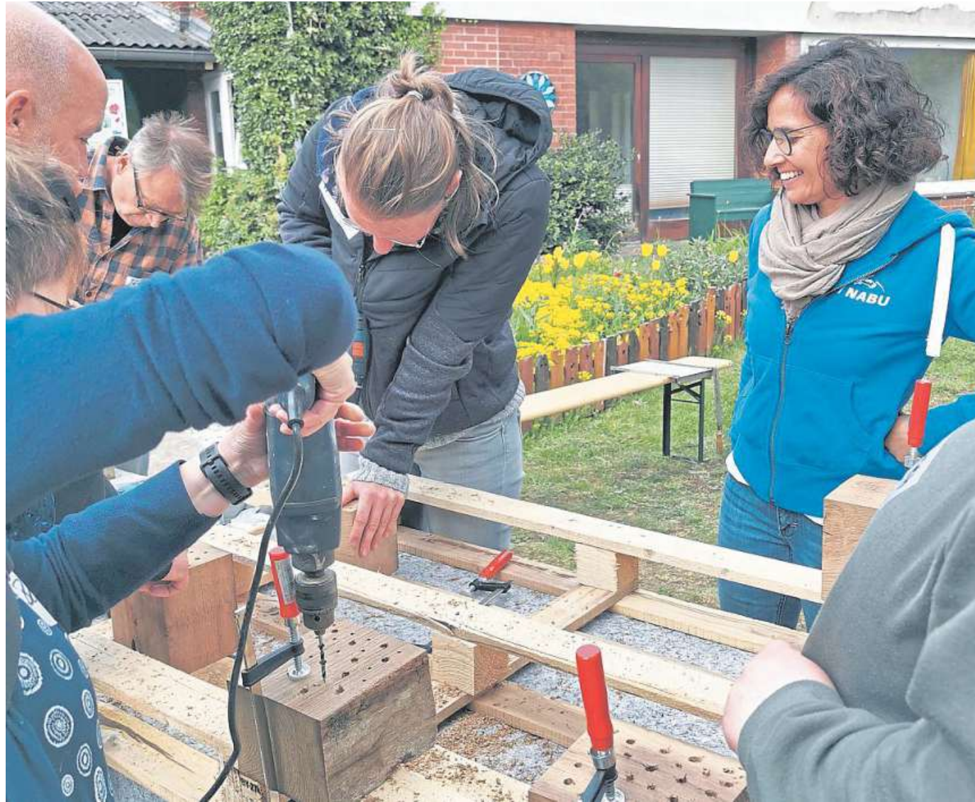
Gemeinsam wurden bei der Fortbildung Nisthilfen hergestellt.

Löcherbiene, Mauerbiene, Blauschwarze Holzbiene, Goldwespe – die Welt der Bewohner von Insektennisthilfen ist vielfältig, doch nichts im Vergleich zu all den anderen Sechsbeynern in Niedersachsen. „Viele tausend Arten gibt es zu entdecken. Diese Vielfalt ist allerdings gefährdet durch Lebensraumverlust und Gifte. Schon heute gibt es nur noch einen Bruchteil der Insektenmenge der 80er-Jahre, und dieser Trend setzt sich fort. Mit den Insekten ver-