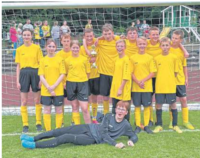
Steyerberg holte den Pokal zum zweiten Mal in Folge.

Steyerberg. Nachdem der Konficup in den vergangenen zwei Jahren nicht ausgetragen werden konnte, trafen sich jetzt elf Mannschaften des Kirchenkreises Stolzenau-Loosum zu einem Fußballturnier im Waldstadion in Steyerberg und spielten um den begehrten Pokal. Die Kirchengemeinde Steyerberg organisierte als Pokalsieger des vorherigen Turniers die Veranstaltung mit Unterstützung des TuS Steyerberg. Neben den aus Konfirmandinnen und Konfirmanden bestehenden Mannschaften der Kirchengemeinden, die mit ihren Pastorinnen und Pastoren und Teamerinnen