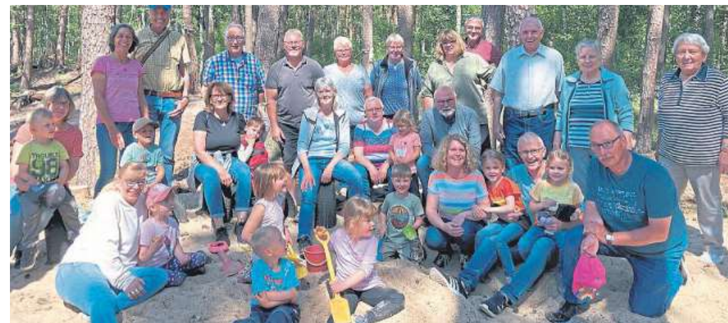
Den Großeltern hat es gut gefallen bei den „Waldflöhen“ in Rodewald.