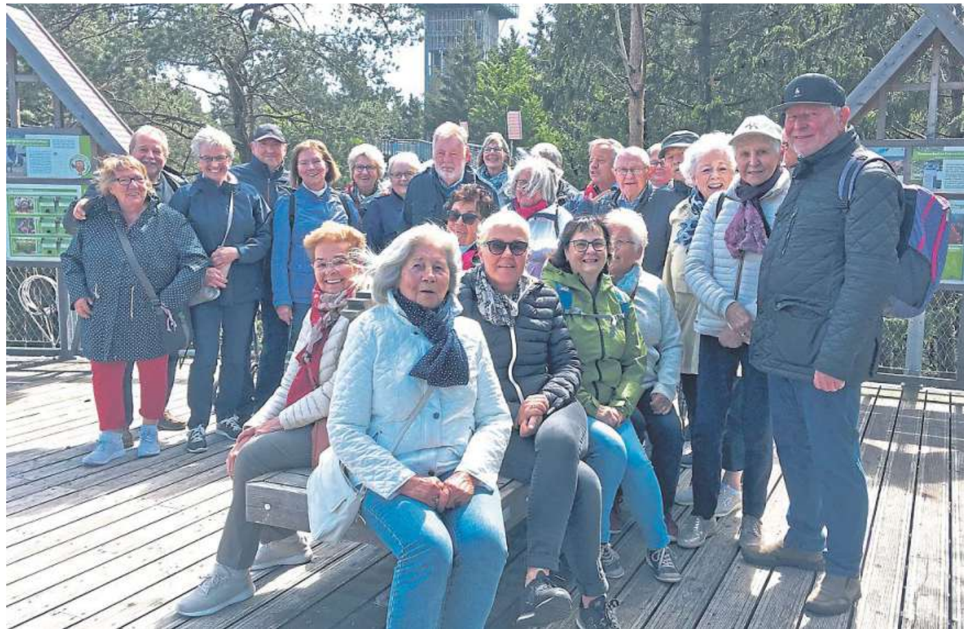
Im Hintergrund der 45 Meter hohe Aussichtsturm: Mitglieder des Liebenauer Heimatvereins auf dem rund 700 Meter langen höchsten Baumwipfelpfad Norddeutschlands bei Hanstedt-Nindorf in der Lüneburger Heide.

Mit dem inmitten eines gepflegten Naturparks gelegenen etwa 700 Meter langen barrierefreien baumwipfelhohen Pfades ist dort ein Projekt entstanden, das als Natur- und Umwelteinrichtung Besuchern aller Altersklassen aus luftiger Höhe den Einblick in die hiesige Flora und Fauna und deren Zusammenhänge ermög-