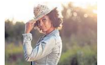
Tokunbo gastiert am 1. Juli in Nienburg.

Tickets zum Preis von 12 Euro gibt es ab sofort im Kulturwerk unter Telefon (050 21) 92 25 80 oder per E-Mail an info@nienburger-kulturwerk.de . DH