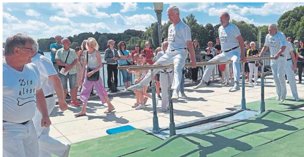
Gern gesehene Gäste beim Tag der Niedersachsen: die Alten Knochen

Gern gesehene Repräsentanten des Landkreises Nienburg waren auch die Alten Knochen. Sie gastierten am Sonnabend im Bereich der Bühne des Landessportbundes direkt am Maschsee.