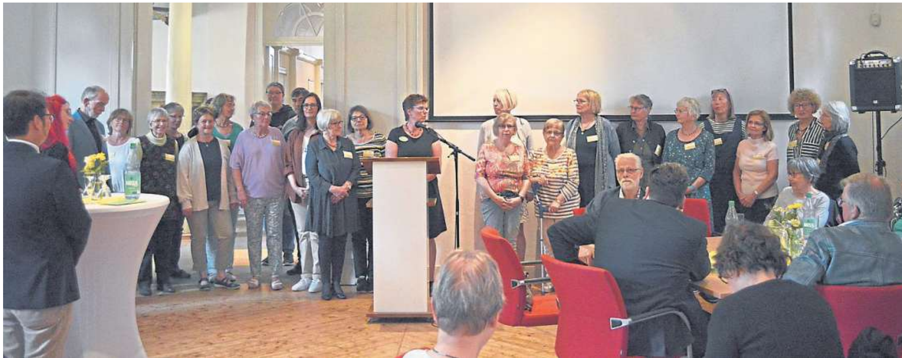
Rund 80 Gäste feierten mit dem Verein „Dasein Hospiz Nienburg“ das 25-jährige Bestehen des Vereins.

Nachdenkliches, aber auch Heiteres beim Jubiläumsempfang im Museum