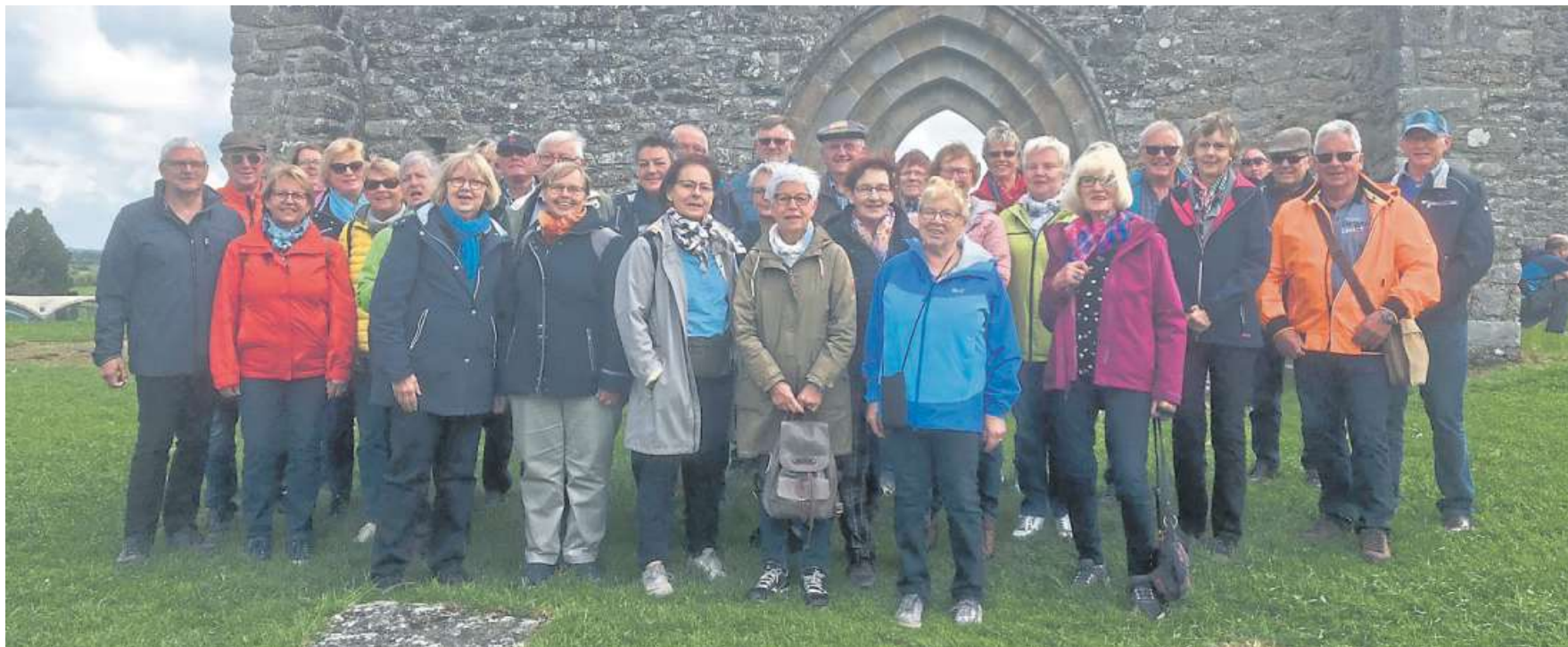
Rund eine Woche waren 31 reiselustige Landfrauen und einige Landfrauen-Männer in Irland unterwegs.

Nieburgs Landfrauen waren eine Woche lang in Irland unterwegs