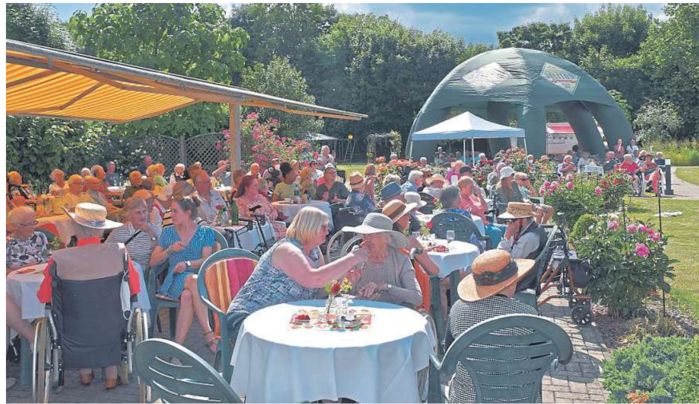
Rundherum gelungen war das Sommerfest im DRK-Altenzentrum Stolzenau.

Und nicht zu vergessen die langjährigen Mitarbeiterinnen. In diesem Jahr wurden