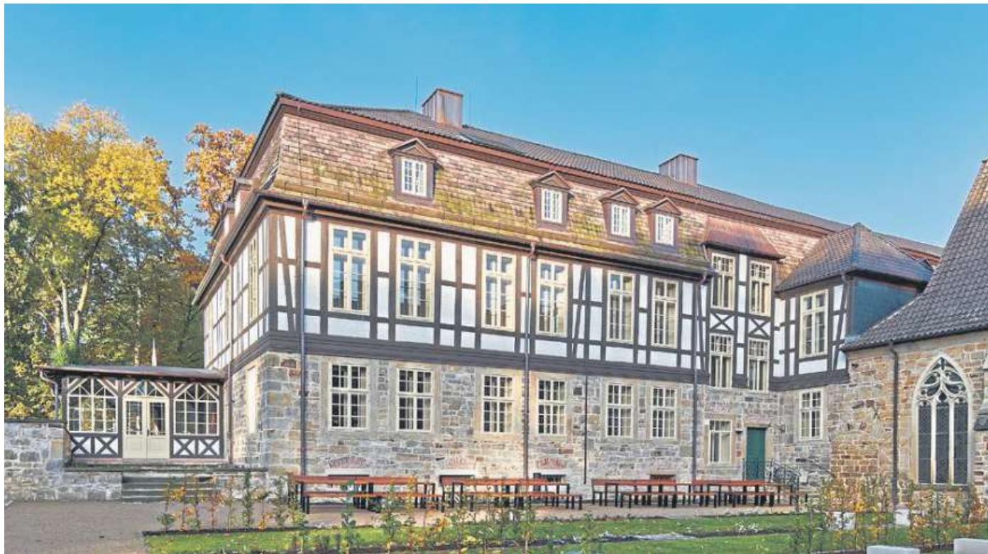
Was über Jahre aufwändigst saniert wurde, kann jetzt besichtigt werden: Das Architekturbüro Woelk und Wilkens lädt gemeinsam mit der Landeskirche am 26. Juni zum Tag der Architektur ins Kloster Loccum ein.

„Tag der Architektur“ am 26. Juni auch in Loccum / Architekten bieten Führungen an