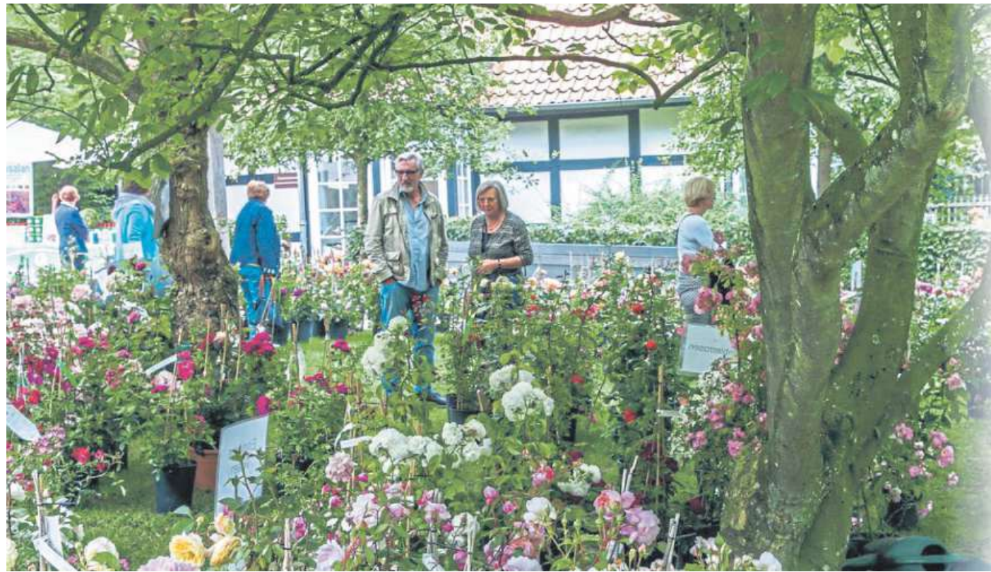
Vom 1. bis 3. Juli findet am Forsthaus Heiligenberg in Bruchhausen-Vilsen wieder das Rosenfest statt.

Fantasievoll wird es bei diesem blumigen Event auch mit hochwertiger Inneneinrichtung, edler Tischkultur, Deko, Stoffen und ausgefallenen