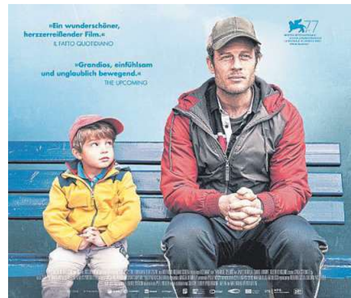
Der Hospizverein Nienburg lädt anlässlich seines 25-jährigen Bestehens am Mittwoch zweimal zu dem Film „Nowhere Special“ ein.

Info Weitere Informationen unter www.dasein-hospiz.de .