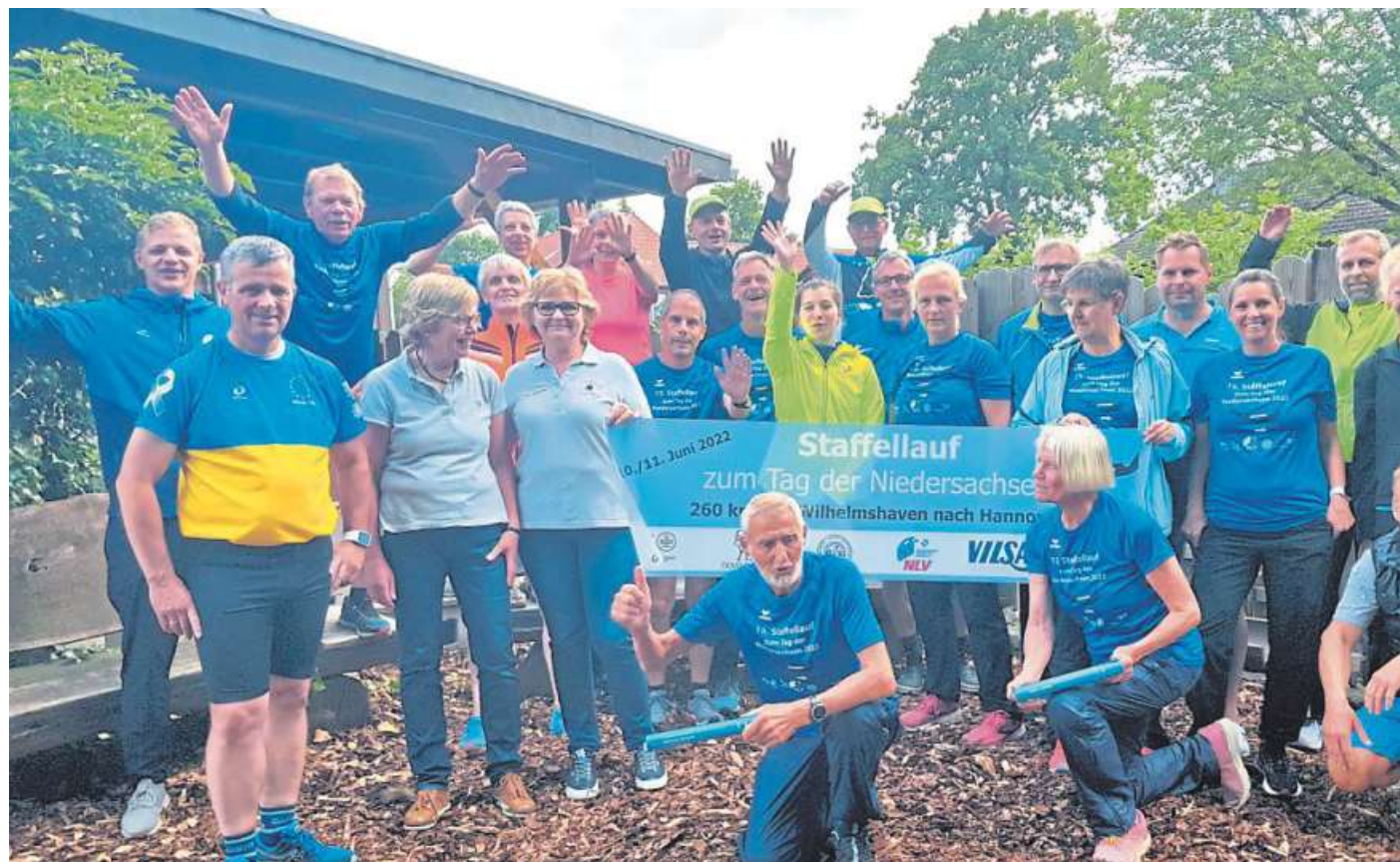
Gute Laune morgens um sechs: Der Staffellauf von Wilhelmshaven nach Hannover machte in Linsburg Station.

Gut gestärkt begaben sich die nächsten Staffelläuferinnen und -läufer dann auf die Strecke zum nächsten Haltepunkt auf dem Weg nach Hannover im benachbarten Neustadt am Rübenberge. DH