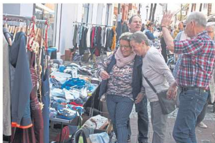
Nach langer Pause ist wieder Flohmarkt beim Weserfrühling.