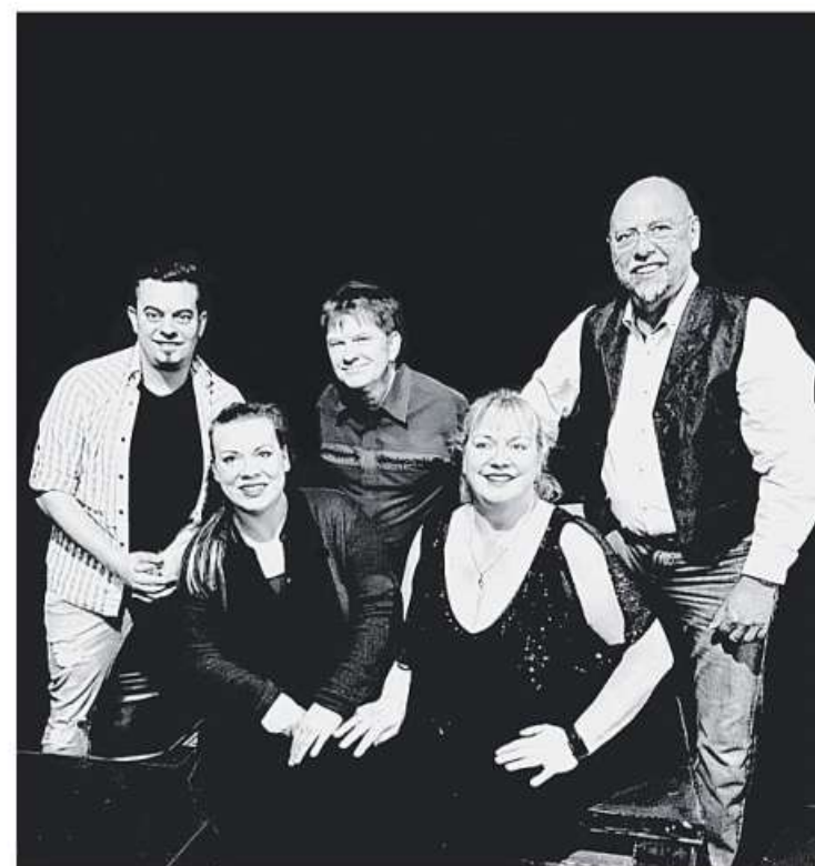
R.A.S.T. sind am vorderen Guderparkplatz zu sehen.

Bedingt durch die behördlichen Corona-Maßnahmen hatte die Fördergemeinschaft zunächst abgewartet, wie sich die rechtliche Lage entwickelt und daher die Veranstaltung in den Mai geschoben. Die Lange Straße wird für den öffentlichen Straßenverkehr ab Freitagabend gesperrt. Alle Anwohner werden um Verständnis gebeten und aufgefordert, ihre Fahrzeuge auf einem der öffentlichen Parkplätze abzustellen.