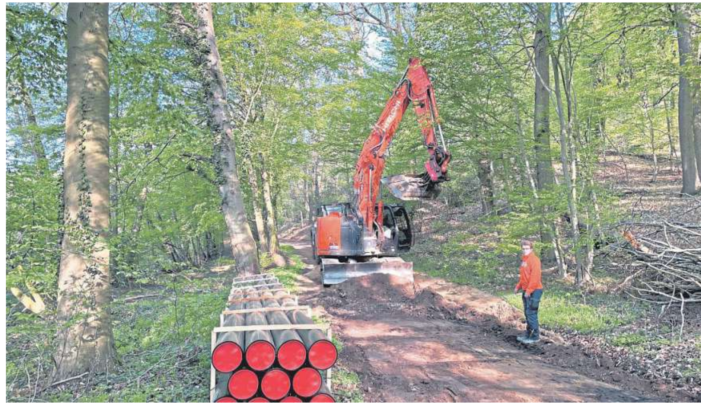
Während die alte Leitung in der Böschung der Liebenauer Aue verlegt worden war, folgt die neue Leitung einer Alternativroute des Weserrad-Fernwegs durch das Binner Holz.

Dass die neue Leitung die alte nicht einfach ersetzt, sondern einer eigenen Trasse folgt, hat zwei Gründe, erklärt der Fachmann: Die bisherige, der Aue folgende Leitung liegt zum Teil bis zu einem Kilometer von regulären Zuwegungen entfernt in sehr lehmigem Boden. Im Falle von Wartungs- oder Reparaturarbeiten war es entsprechend schwie-