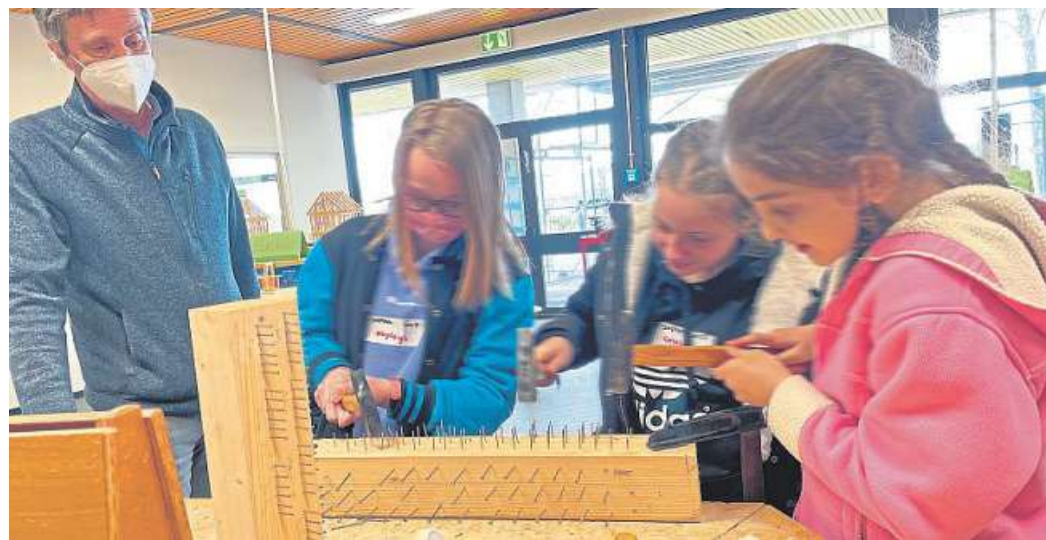
Auch handwerkliches Geschick war gefragt an der OBS Marklohe.

Erfreut über viele neue Eindrücke und kleine Snacks traten die Grundschüler um 12 Uhr den Heimweg an. DH