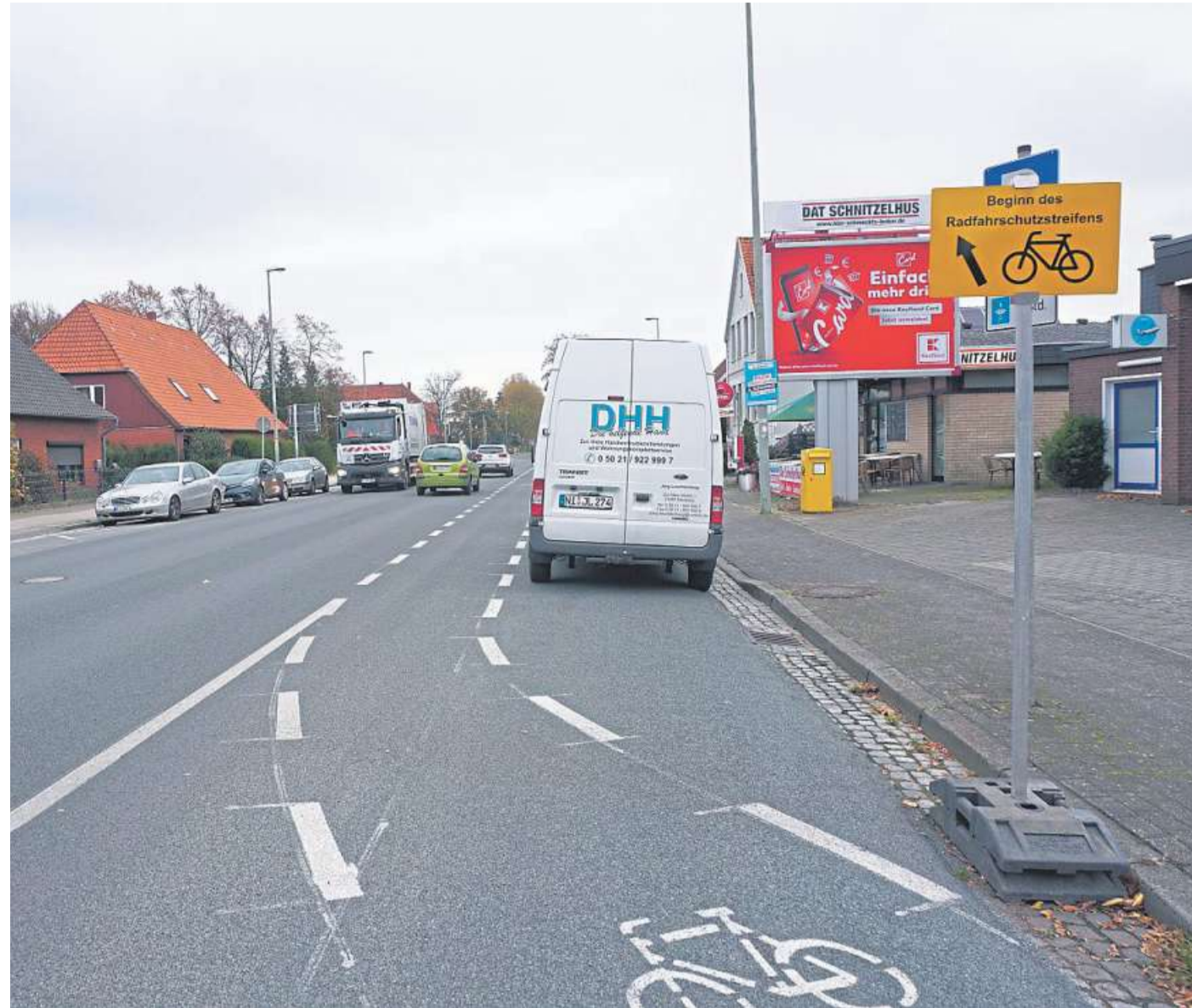
Fahrradstreifen an der Hannoverschen Straße ja oder nein: Bis zum 15. Dezember sind alle Interessierten aufgefordert, sich an der Befragung der Stadt zu beteiligen.

Der Fragebogen steht auf der Homepage der Stadt Nienburg ( www.nienburg.de ) - Praxistest Fahrradstreifen Hannoversche Straße zum Herunterladen oder zum Ausdrucken zur Verfügung, dort kann dieser auch direkt digital ausgefüllt und versendet werden. In Papierform ist der Fragebogen an der Information des Rathauses zu den üblichen Sprechzeiten erhältlich. Der Fragebogen ist spätestens bis zum 15. Dezember per Post (Stadt Nienburg/Weser, Sachgebiet Stadtplanung und Umwelt, z. Hd. Frau Becker, Marktplatz 1, 31582 Nienburg) oder per Mail an h.becker@nienburg.de zu