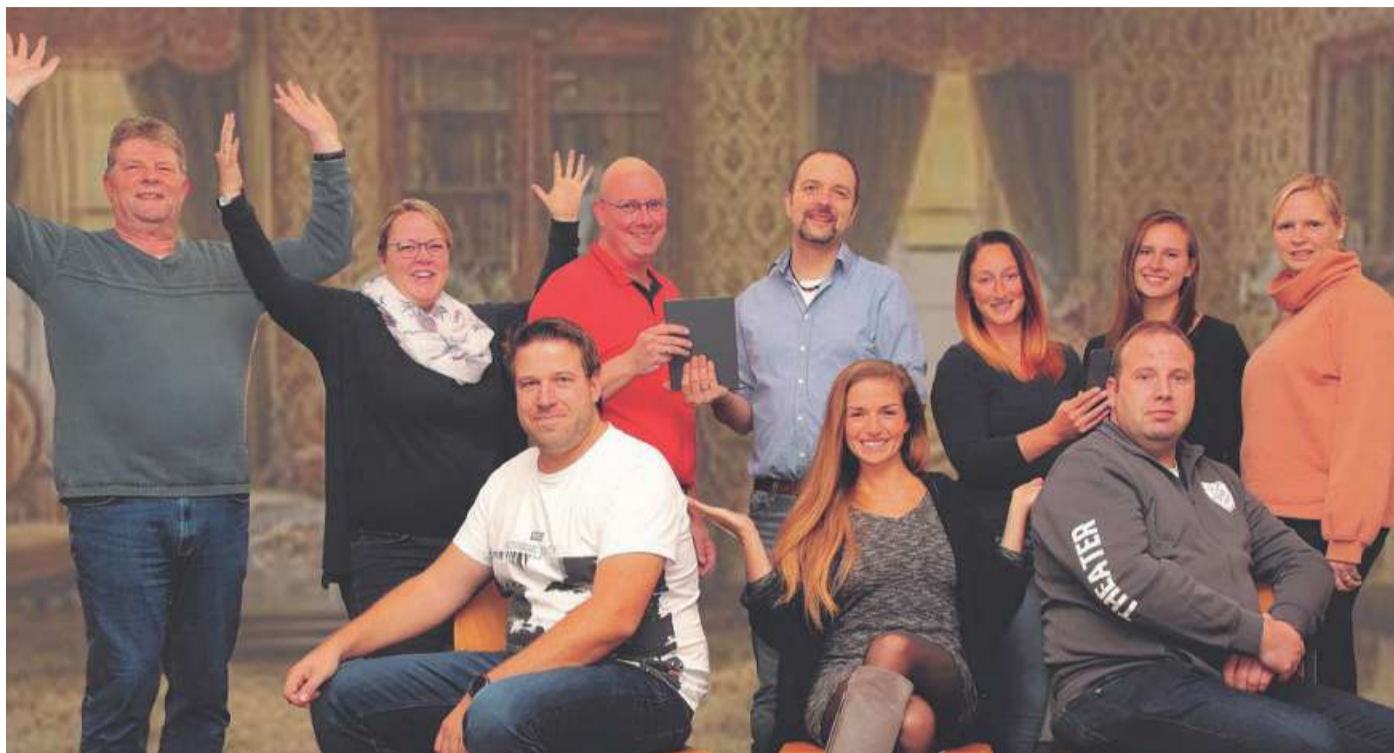
In Oyle gibt's wieder Theater. Ab dem 19. Januar lädt die Theatersparte der Jugendgemeinschaft Oyle ein zu „De Leev, de Frust, de Swiegermudder“.

Das ist der Beginn dieses unterhaltsamen Verwechslungsspiels. Die Klingel im Hause Eiermann steht bald nicht mehr still. Dafür sorgt unter anderem Willis Schwie-