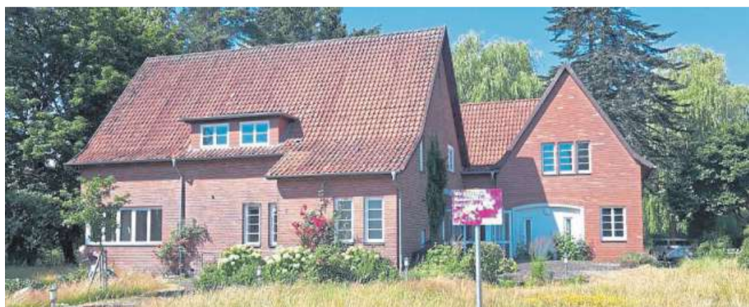
Der Binderhaus-Verein Rodewald ist ein überparteilicher, überkonfessioneller und freiwilliger Zusammenschluss von Bürgerinnen und Bürgern.

anstellungen oder sonstige Aktivitäten des Vereins informieren. Warum sich der Verein für das Lokalportal entschieden hat: „Es ist schnell,