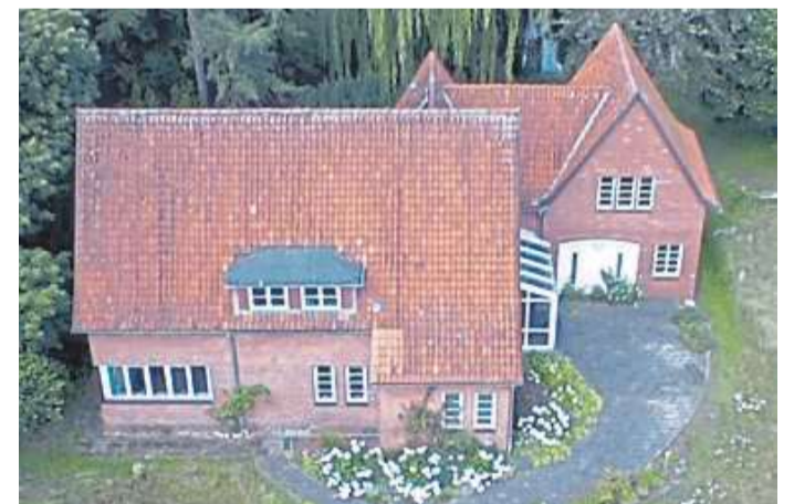
Blick aus der Vogelperspektive auf das Areal des Binderhaus-Vereins.

Künstler. Das Fest lockt regelmäßig unzählige Gäste aus dem gesamten Landkreis und darüber hinaus nach Rodewald. Außerdem gibt es viele Leckereien zu Essen und Trinken. Damit das Fest organisiert und durchgeführt werden kann, ist ein großer Aufwand und sind viele fleißige Helfer vonnöten: Etwa 100 ehrenamtliche Helfer kommen dabei zum Einsatz. Neben dem großen Fest werden vielfältige kulturelle Veranstaltungen, darunter Kabarett, Lesungen oder auch Musikabende, angeboten und Räumlichkeiten für Vereine und Gruppen zur Verfügung gestellt. Der Verein hat derzeit 51 Mitglieder.