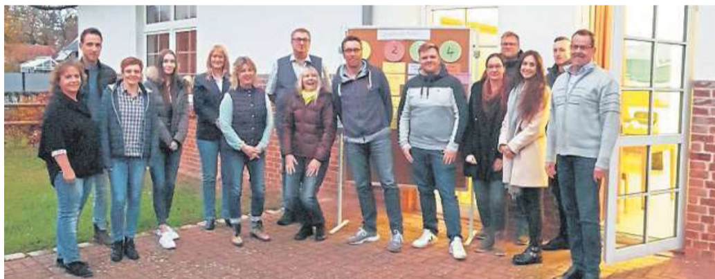
Sich rechten Einschüchterungsversuchen entgegenzusetzen lernten die Mitarbeitenden der Verwaltung der Samtgemeinde Heemsen in einer Fortbildung mit Rudi Klemm.

Zur Zielscheibe werden insbesondere Personen, die sich für ein solidarisches und gleichberechtigtes Miteinander in der Gesellschaft einsetzen. Häufig geraten aber auch Verwaltungsmitarbeiterinnen und -mitarbeiter ins Visier von