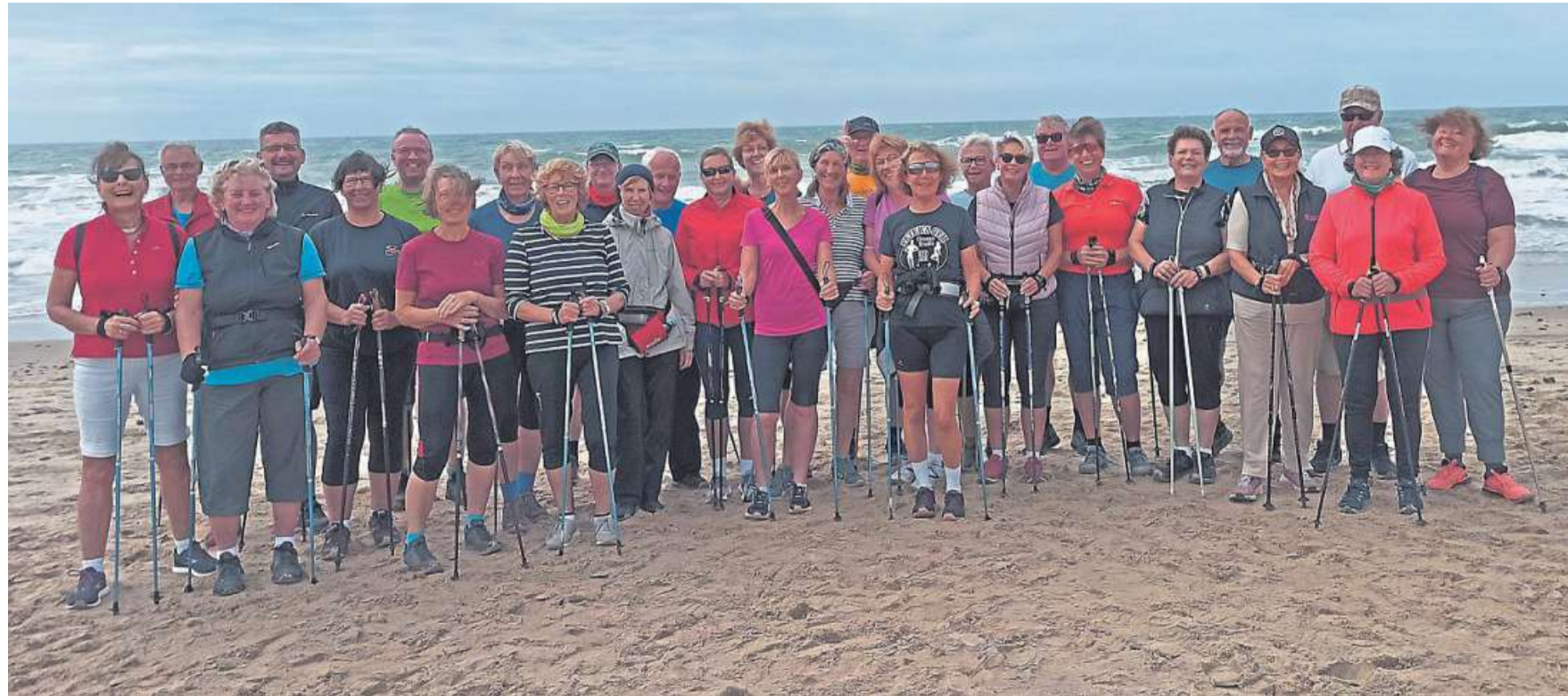
Gute Laune trotz durchwachsenen Wetters: An der mittlerweile 15. Nordic-Walking-Freizeit an der „Küste des Lichts“ in Andalusien nahmen 32 Frauen und Männer teil; manche bereits zum elften Mal.

Hoya. Zum letzten Mal in diesem Jahr findet am kommenden Mittwoch, 17. November, ab 15 Uhr ein Lesenachmittag bei Kaffee und Kuchen im Heimatmuseum Hoya statt. Veranstalterin ist die Samtgemeindebücherei. DH