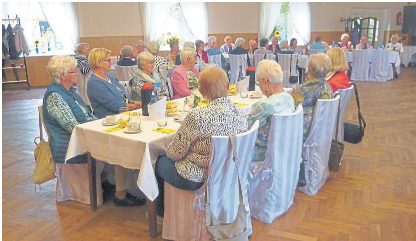
Landfrauen feierten Geburtstage von Mitgliedern.