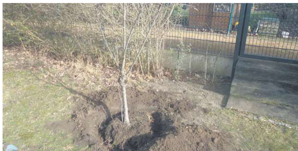
Bis Mitte November lassen sich Bäume oftmals noch einpflanzen.

auch das noch an Bäumen und Gehölzen vorhandene Laub endgültig von den Bäumen, oft sogar in beträchtlichen Mengen. Vom Rasen wird man es beseitigen. Auf Beeten kann es liegen bleiben. Man kann es dort auch als Mulchschicht ausbringen. Der Boden trocknet nämlich auch im Winter aus. Mulchen soll den Boden mit zerkleinerten Pflanzenteilen abdecken. Eine Bodenabdeckung ist überall dort zu empfehlen, wo der Bewuchs noch Stellen frei gelassen hat. Mulch als natürliche Abdeckung hat die Funktion des herabgefallenen Laubes im Wald. Es verrottet auf dem Gartenboden, kompostiert vor Ort und wird zu