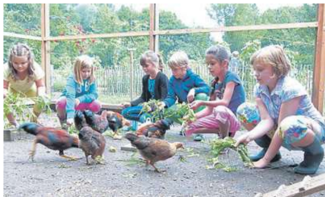
Auch Hühner gibt es zu sehen.