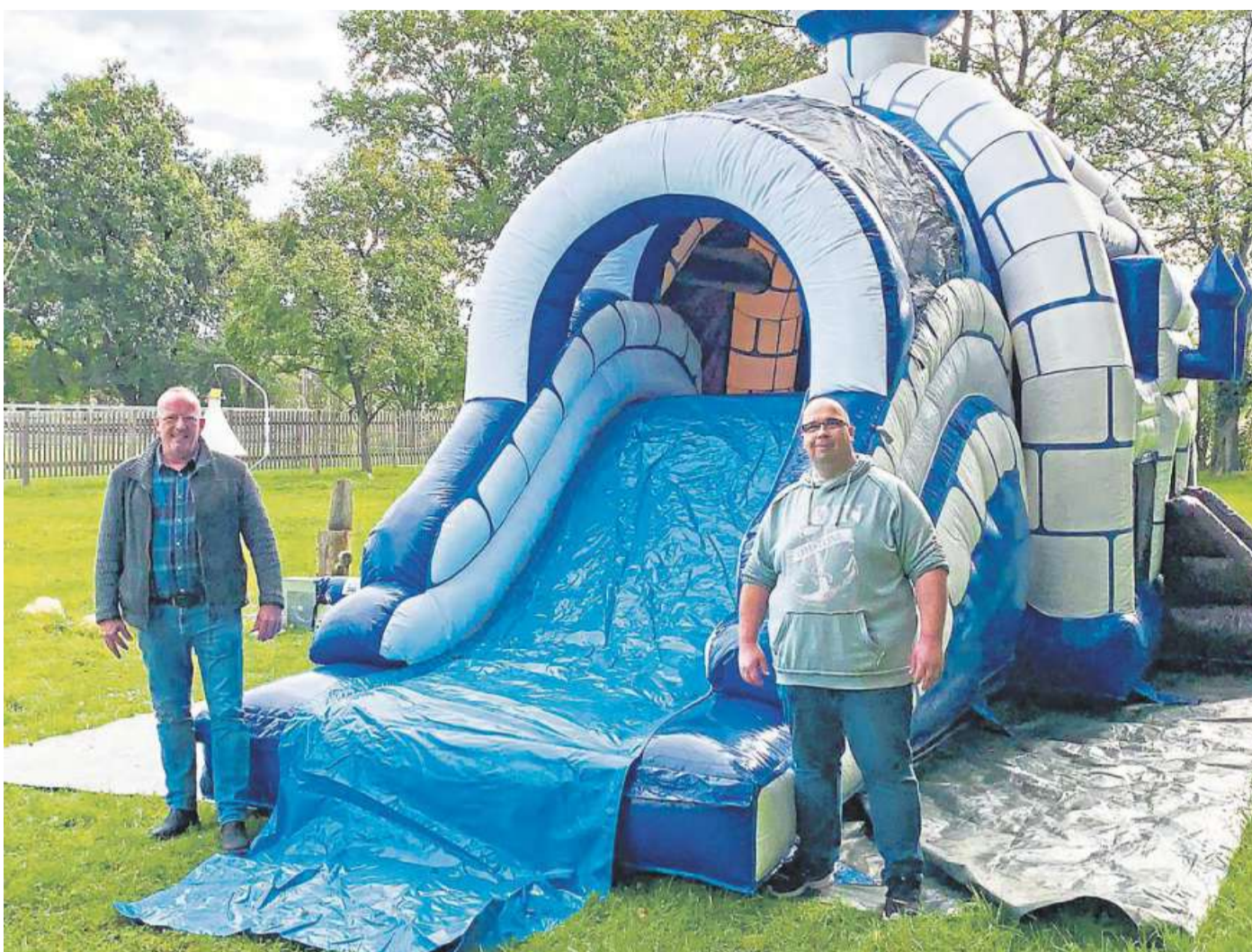
Inklusive Hüpfburg sind die zu ersteigenden Weihnachtveranstaltungen.

Das Kinderheim „Kleine Strolche“ in Asendorf wurde 2008 gegründet und ist eines