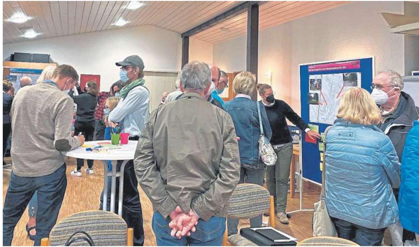
Über Pläne und Ideen tauschten sich Einwohner aus dem Nordertor aus.

Ach so. Da war er also. Gar nicht verloren auf dem kalten Boden, auch nicht irgendwo zwischen gerutscht. Nur schonmal in die Hand genommen, um ihn parat zu haben. Tolle Idee eigentlich. Schlecht umgesetzt. Möglich, dass das ein Zeichen ist, dass Mensch urlaubsreif ist.