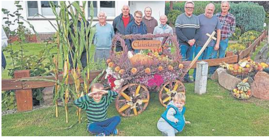
Corporalschaft Clauskamp beim Erntefest 2021.