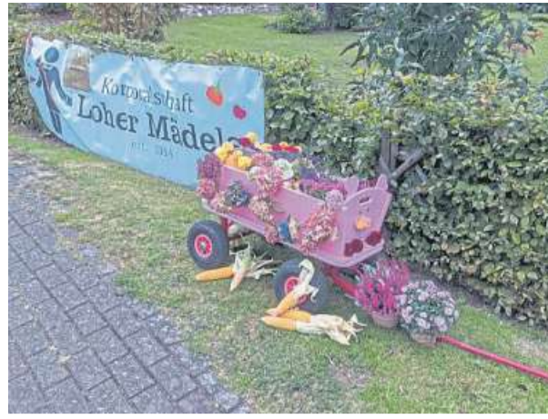
Der Wagen der Corporalschaft Loher Mädels.