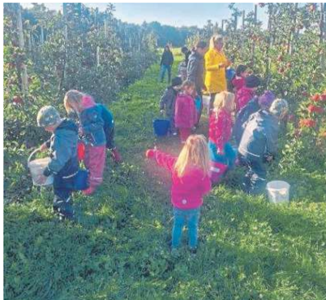
Kinder aus dem Leeser Spuk-Schloss ernten Äpfel im Oehmer Feld. FOTO: SPUK-SCHLOSS

Schon einige Tage vorher war der Apfel in der Kita thematisiert worden. Es wurden Lieder und Fingerspiele vom Apfel durchgeführt, Äpfel betrachtet, probiert, Bilder gezeichnet und auch ein leckerer Apfelkuchen gebacken. DH