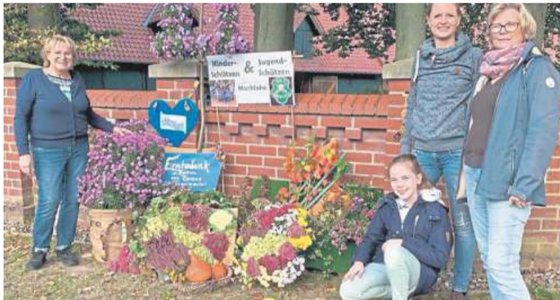
Damen-Corporalschaft beim Markloher Erntefest 2021.

der Hoffnung, im kommenden Jahr wieder ein großes Erntefest feiern zu können. DH