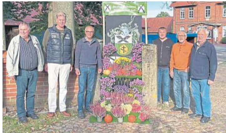
Corporalschaft Dorf beim Markloher Erntefest 2021.