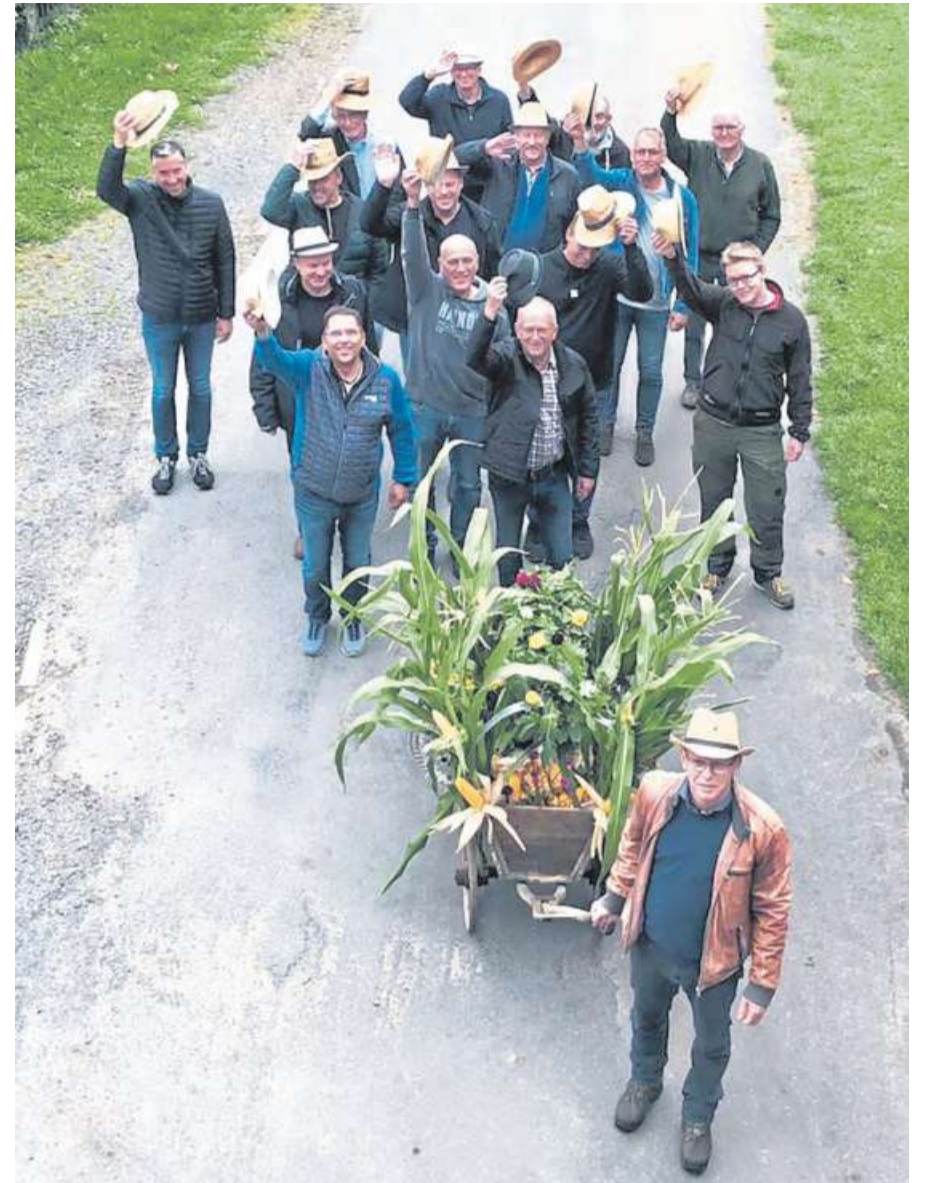
Corporalschaft Steeriede Ah-Moor beim Erntefest 2021