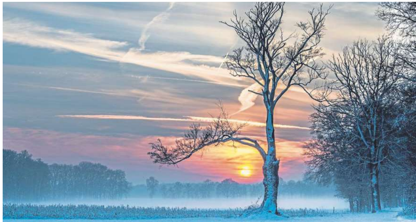
Winterliche Bilder aus November und Dezember können natürlich auch aus den Vorjahren eingereicht werden. Das Foto ist das Januar-Siegerfoto von David Floyd.

Damit auf dem Kalender die Siegerfotos der jeweiligen Monate auch in der bestmöglichen Auflösung gedruckt werden können, werden die Sieger der Monate Januar bis September schon einmal gebeten, sofern noch nicht geschehen, ihre Siegerfotos per E-Mail an s.schwake@dieharke.de . Auch die Sieger der ausstehenden Monate sollten später ihre Fotos an diese Mailadresse schicken. DH