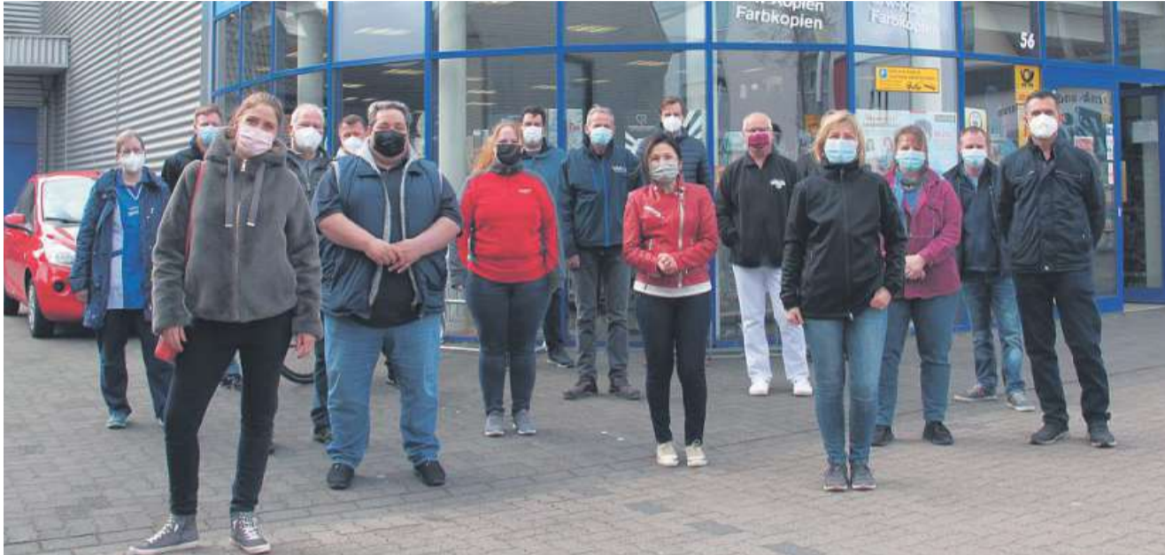
Die Geschäftsleute an der Celler Straße sind trotz der Baumaßnahme für ihre Kunden erreichbar.

Geschäftsleute an der Celler Straße sind für ihre Kundschaft da