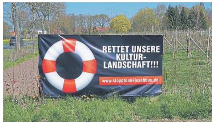
Ein Plakat der Initiative steht auch am Ortseingang von Schinna aus Richtung Stolzenau kommend.

Er verweist auch auf die Mitgliedschaft der Samtgemeinde Mittelweser in der als Verein organisierten Klimaschutzagentur Mittelweser mit Sitz in Nienburg, was aus