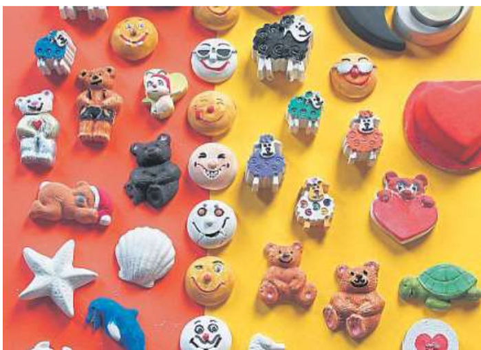
Aus Gips erschufen Kinder im Steyerberger „House of Life“ kleine Kunstwerke.

Nicht nur beim Verzieren, sondern auch beim Ausdenken einer dazugehörigen Geschichte waren die Künstlerinnen und Künstler sehr kreativ. So gab es das schwarze Schaf, das plötzlich gar nicht mehr so auffällt, wenn die ganze Herde bunt ist oder den Kartenhalter in Herzform, der zugleich zu Wandschmuck oder Bilderrahmen umfunktioniert werden kann. DH