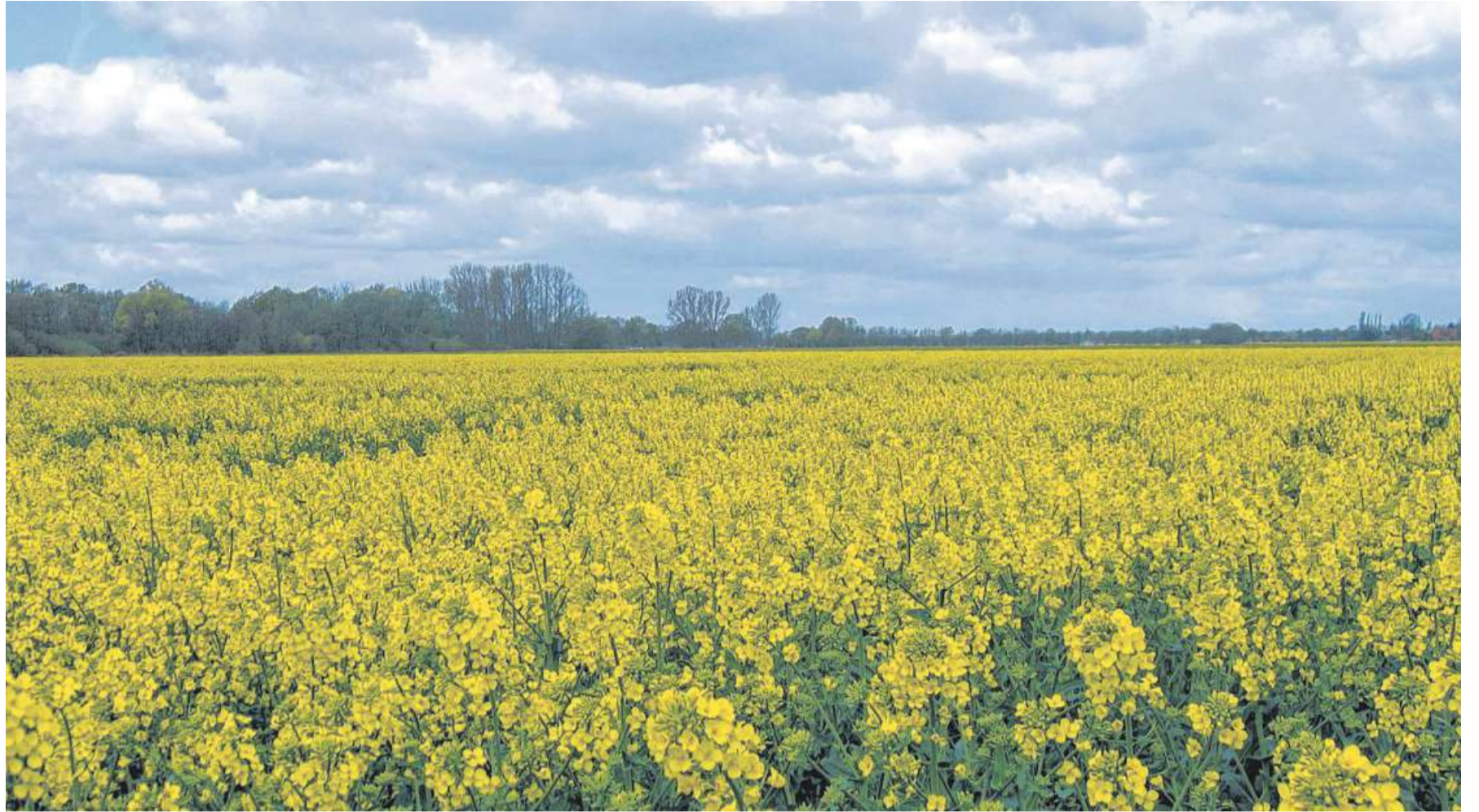
Rapsfelder bestimmen für kurze Zeit das Landschaftsbild auch im Landkreis Nienburg.

LANDKREIS. Die SPD-Bundstagsabgeordnete Marja-Liisa Völlers bietet am Montag, 10. Mai, von 10 bis 12 Uhr eine Telefonsprechstunde und am Mittwoch, 12. Mai, von 12.30 bis 14 Uhr eine Videosprechstunde an. Am Montag steht sie unter der Nummer ihres Stadthäger Bürgerbüros, (0 57 21) 994 73 50 Rede und Antwort. Am Mittwoch ist sie online mit Video über WebEx zu erreichen. Um nach vorheriger Terminabsprache die Einwahldaten zu erhalten, ist eine Anmeldung im Nienburger Bürgerbüro unter Telefon (0 50 21) 922 7180 oder per E-Mail an marja.voellers.wk@bundestag.de erforderlich. „In den letzten Wochen ist wieder viel passiert. Obwohl wir in der Pandemie gerade etwas Perspektive gewinnen, haben es immer noch viele Menschen schwer. Deshalb biete ich wieder eine Telefon- und Videosprechstunde an. Mittlerweile sind viele Menschen voll digitalisiert, jedoch ist es mir wichtig, auch weiterhin die Telefonsprechstunde anzubieten“, so Völlers. DH