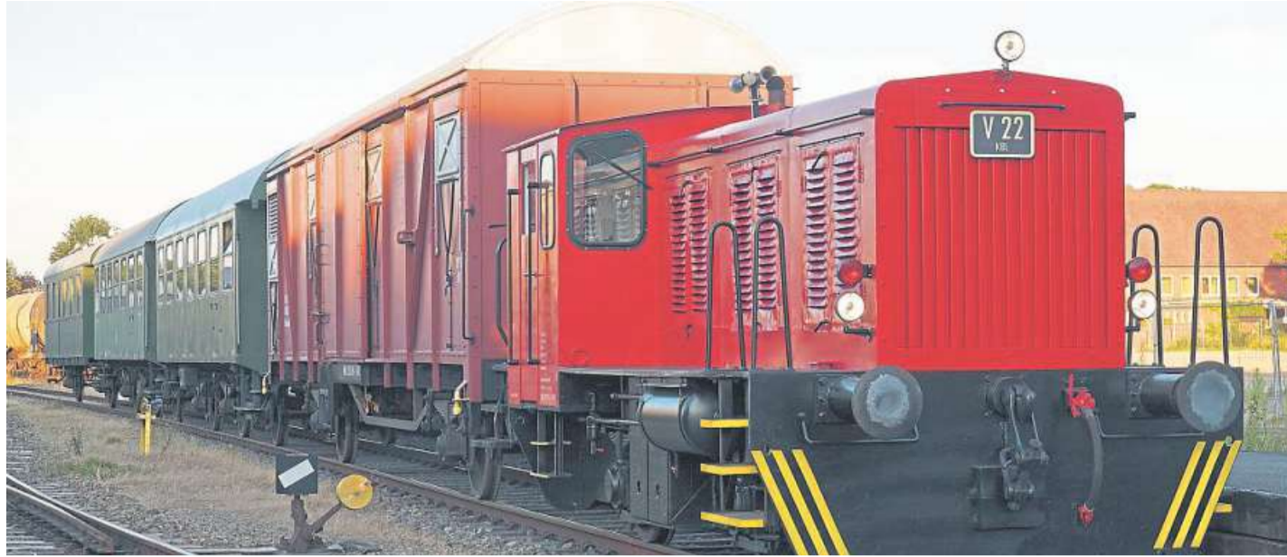
Der Saisonstart des „Pingelheini“ wird verschoben.