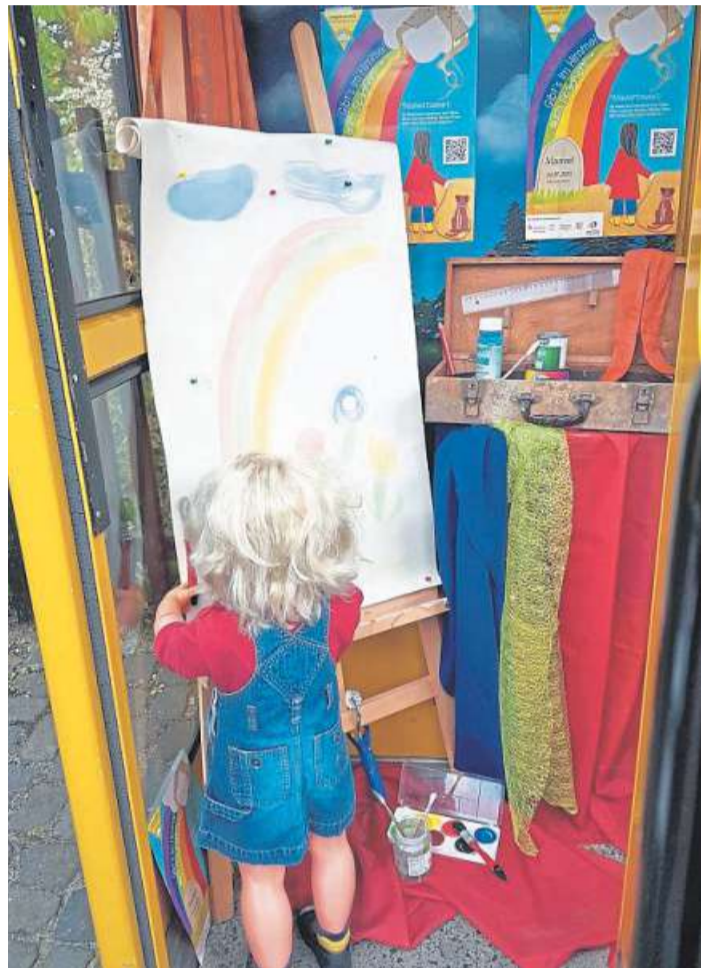
Die Telefonzelle in Brokeloh ist zum Ausstellungsort fürs Jubiläum geworden.

nach ihren Erfahrungen aus der Praxis. Die Bearbeitung aller Arbeitsfelder wird in einem Bericht beschrieben und führt zur GWÖ-Zertifizierung. Fragen aus dem Publikum können auch gestellt werden. Unternehmerinnen und Unternehmer können sich mit Nennung des Stammtisch-Datums unter der E-Mail-Adresse nienburg@ecogood.org anmelden und bekommen am Veranstaltungstag den notwendigen Link zugeschickt. DH