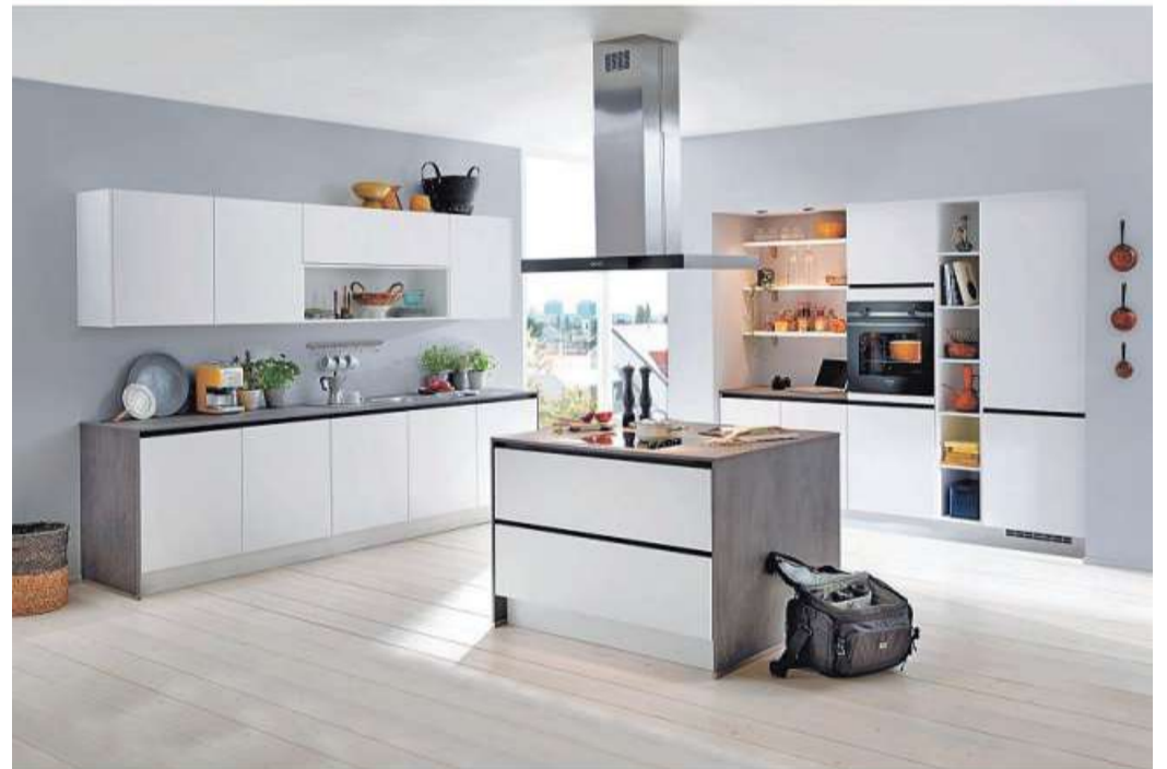
Sitz der Gesellschaft: Küchenfachmarkt am Südring Meyer & Zander GmbH, Am Südring 10 - 31582 Nienburg - Tel.: 05021 / 8942640