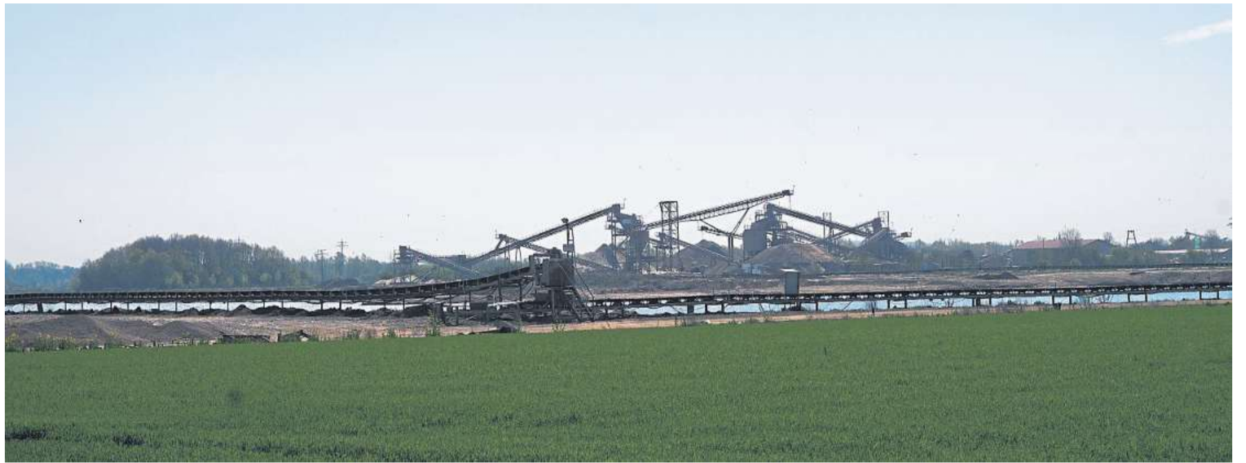
Kieswerke, wie hier bei Stolzenau, gehören seit Jahrzehnten zum Bild in der Samtgemeinde Mittelweser - Tendenz steigend.