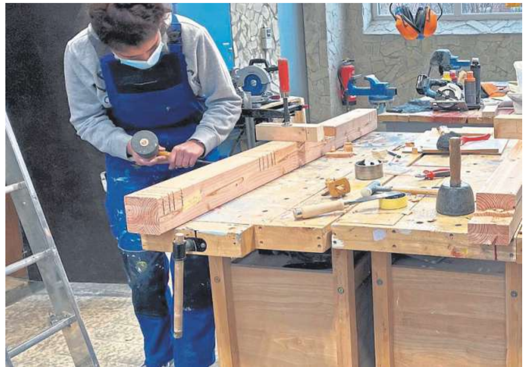
In der Jugendwerkstatt wurde für die „Kräher Höhe“ gearbeitet.

Nach einigen Corona-bedingten Verzögerungen soll das Insektenhotel in den kommenden Wochen in den Abfall-Lehrpfad auf dem Gipfelplateau der Kräher Höhe eingebunden werden. Hinzu kommen noch Informationstafeln mit Hintergründen zum Projekt, zu den Insekten und ihrer ökologischen Bedeutung. DH