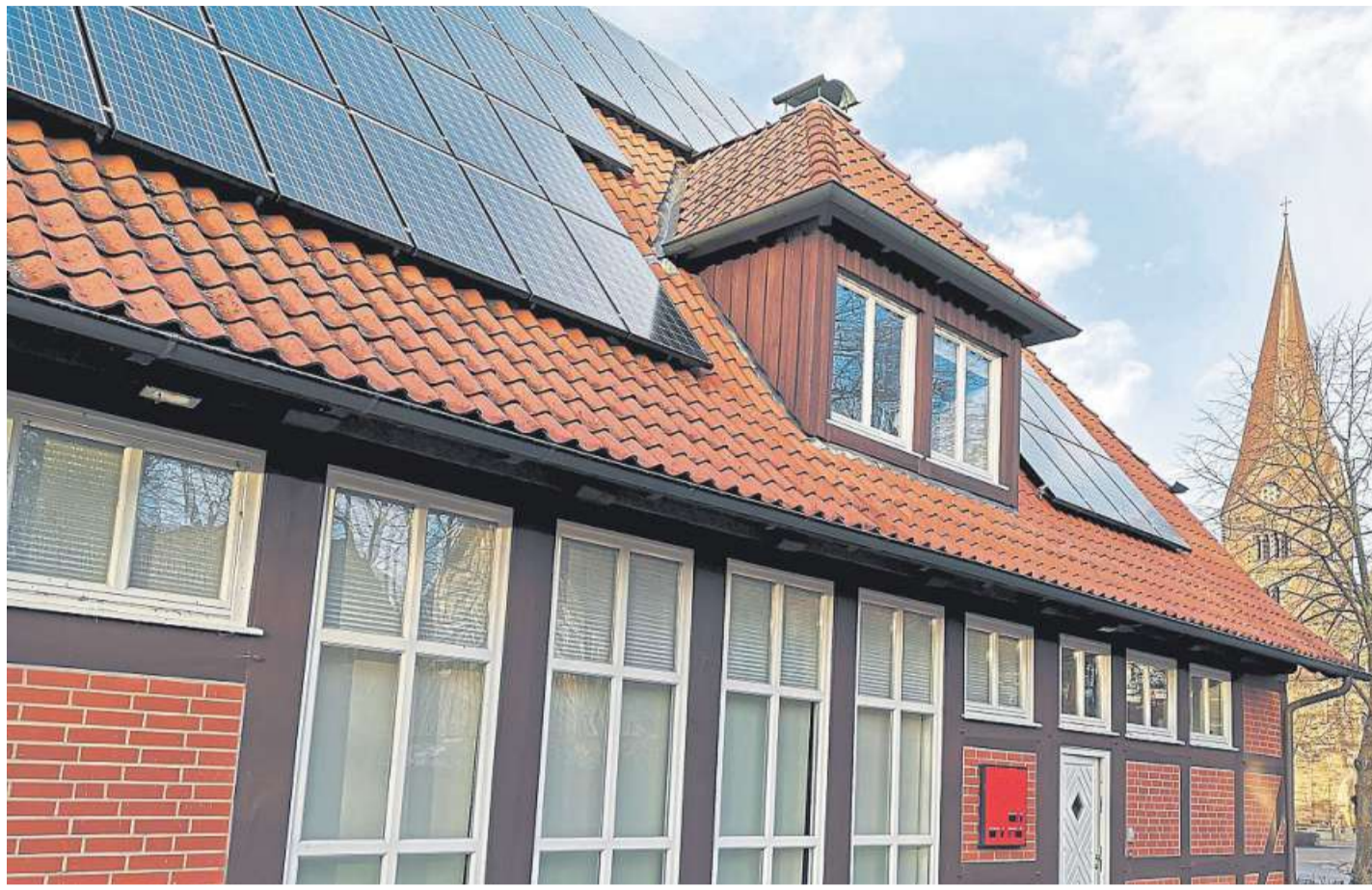
Photovoltaik wird immer beliebter.

„Berater und Hauseigentümer müssen sich beim Vor-Ort-Termin an die Abstands- und Hygieneregeln halten“, betont Merkel. Formalitäten und die Daten zum Energieverbrauch sollen bereits vorab telefonisch oder per Mail ausgetauscht werden.