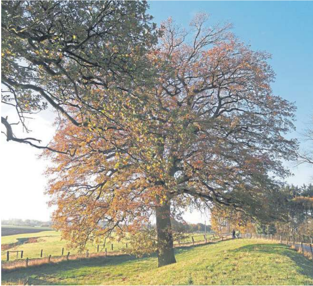
Soll ein Baum in der freien Landschaft, im städtischen Bereich oder Privatgarten gefällt werden, muss unter gewissen Voraussetzungen zuvor der Fachdienst Naturschutz zwecks Prüfung hinzugezogen werden.