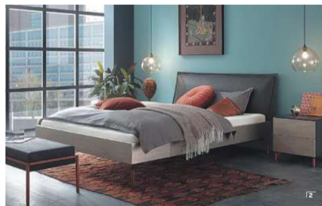
Alle Betten auch in weiteren Größen erhältlich. Alle Preise sind Vollverkaufspreise. Preise ohne Latzenrosen, ohne Matratzen, ohne Zierkissen, ohne Nachtkonsolen, ohne Dekoration.