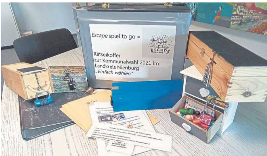
Politische Themen spielerisch vermitteln – das ist der Ansatz des Spiels „Einfach wählen“ anlässlich der Kommunalwahl im Herbst dieses Jahres.

Als Vorbereitung zur Kommunalwahl im Herbst dieses Jahres hat die Kreisjugendpflege im Landkreis Nienburg ein Rätselspiel für Kinder, Jugendliche und junge Erwachsene im Alter von zwölf bis 27 Jahren entwickelt, das sich Vereine und Jugendhäuser jetzt ausleihen können. Im Escape-Rätselkoffer von „Einfach wählen“ gibt es verschiedene Kisten und verschlossene Materialien, mit denen sich die Spielenden in sieben unterschiedlichen Aktionen mit Teilbereichen der Kommunalwahl spielerisch auseinandersetzen. Um an einen jeweils nächsten Zahlencode zu gelangen, müssen die Spielerinnen und Spieler Rätsel und Fragen lösen, auch eine