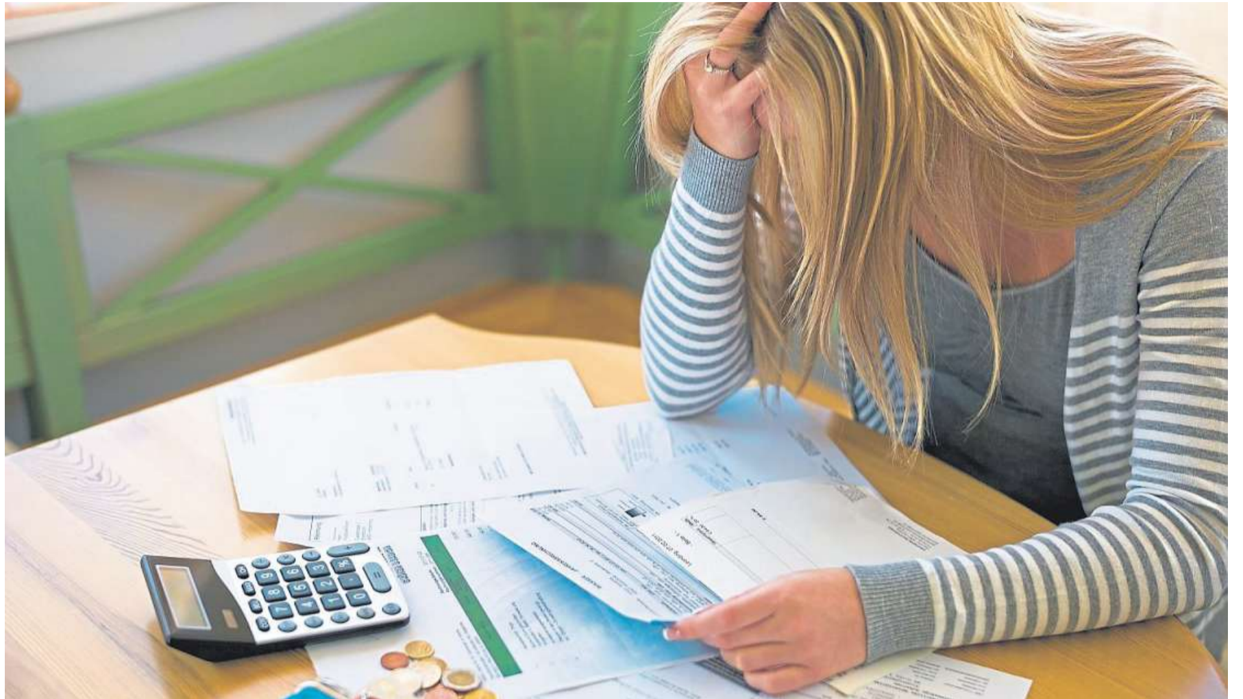
Wenn Rechnungen nicht mehr beglichen werden können, droht die Überschuldung.

Die Beratungsstelle war auch während der Lockdowns für Ratsuchende geöffnet, natürlich unter strikter