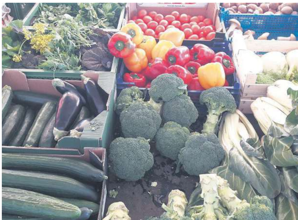
Der Wochenmarkt ist weiter geöffnet.