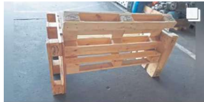
Gruppe: DIY-Gruppe Michael Haller Wir vermöbeln Sie Aus Platten Gartenmöbel und Strandkorb gebaut

3. Anschließend wird auf den Button „Drücke auf Post erstellen“ gedrückt – und schon ist der Post im Lokal-