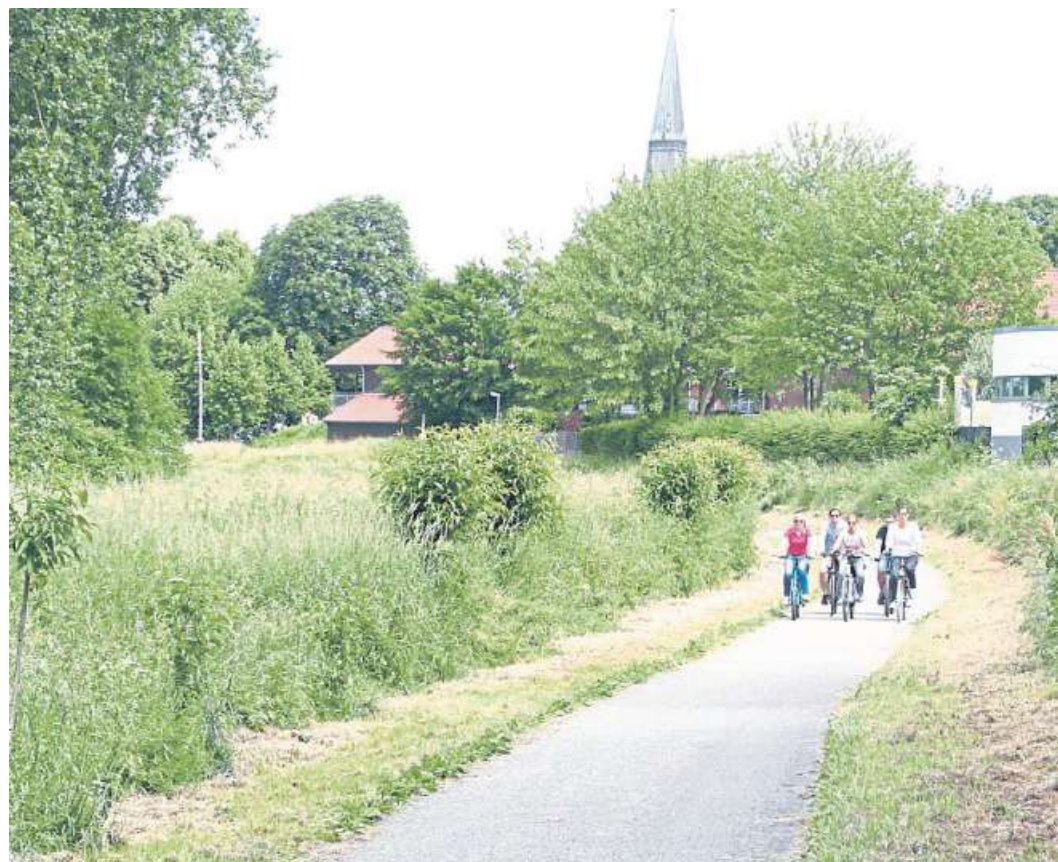
Der Weser-Radweg (hier in Nienburg) ist auch im Landkreis Nienburg beliebt, sowohl für tägliche Fahrten als auch für lange Touren.