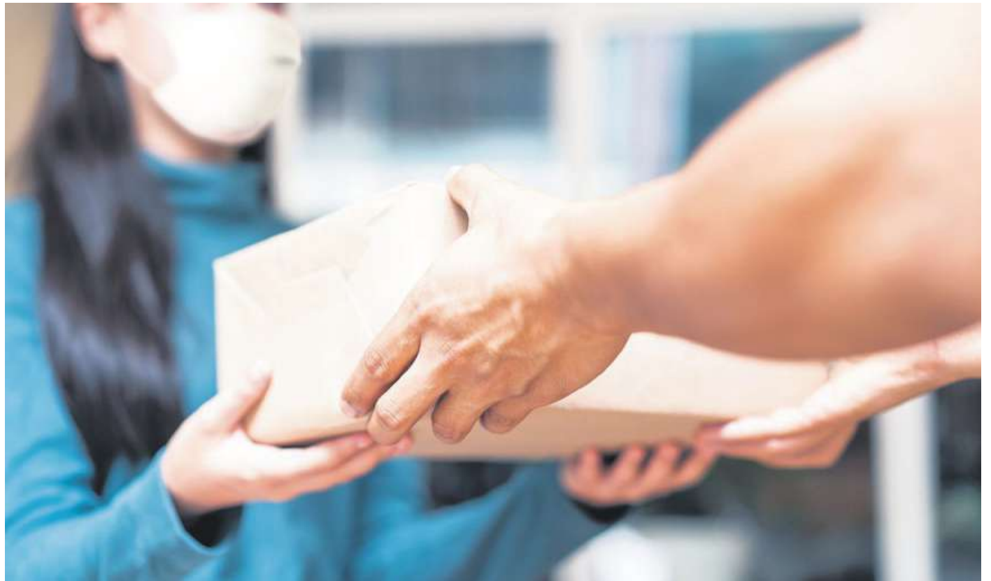
Wer sich an die Hygienevorschriften hält, darf Bestellungen an Kundschaft rausgeben oder bringen.