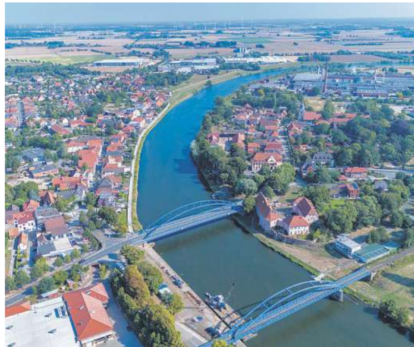
In Hoya und umzu können Kunden auch jetzt einkaufen.