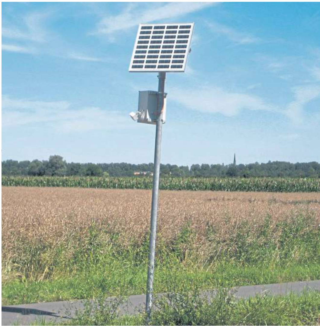
Eine Zählstelle am Weser-Radweg.

2017: 6400 HR, 25 500 AR, zusammen: 31 900 2018: 15 600 HR, 25 800 AR, zusammen: 41 400 2019: 21 599 HR, 29 055 AR, zusammen: 50 654 2020: 29 573 HR, 31 085 AR, zusammen: 60 658