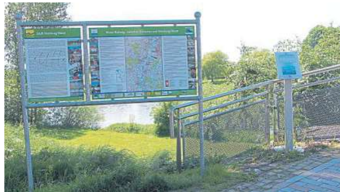
Eine Informationstafel des Weser-Radwegs an der Fußgängerbrücke in Nienburg.

☎ Weitere Informationen gibt es im Internet: www.weserradweg-info.de ,