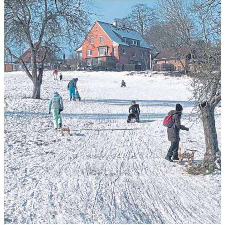
Einen perfekten Rodelhang bekamen Kinder und Wintersportfreunde in Binnen an der Neuen Bergstraße geboten.