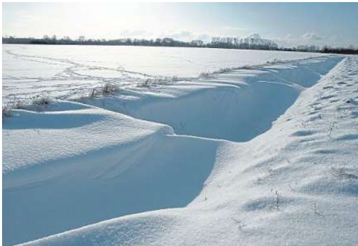
Diese Schneeverwehung in der Haßberger Marsch hat Ursel Hackbart fotografiert.