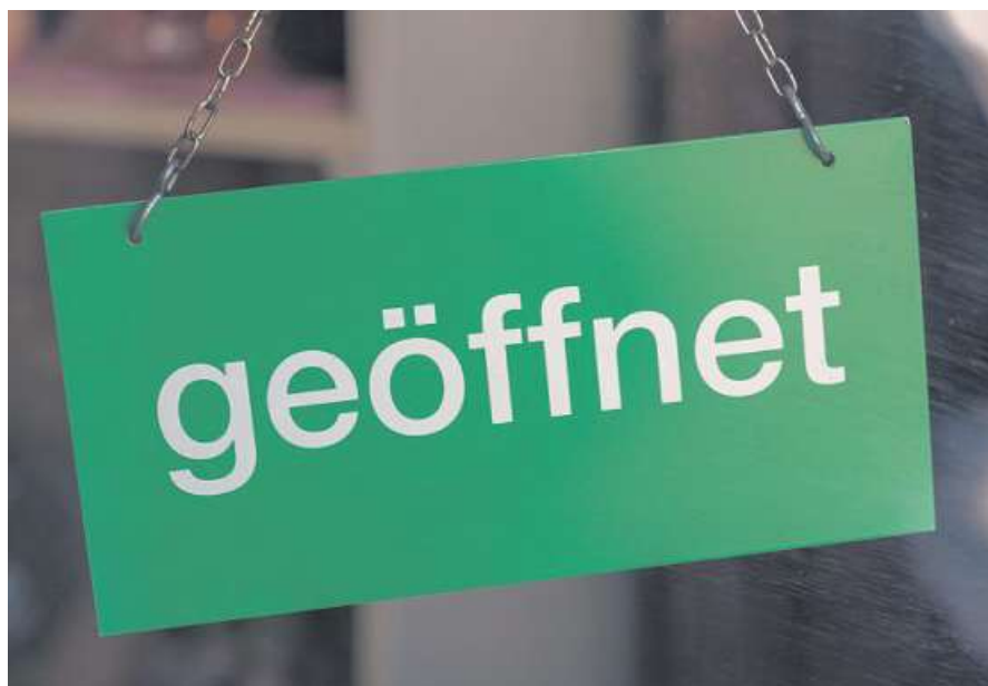
Viele Geschäfte und Gastrobetriebe sind auch jetzt für Kunden und Gäste da.