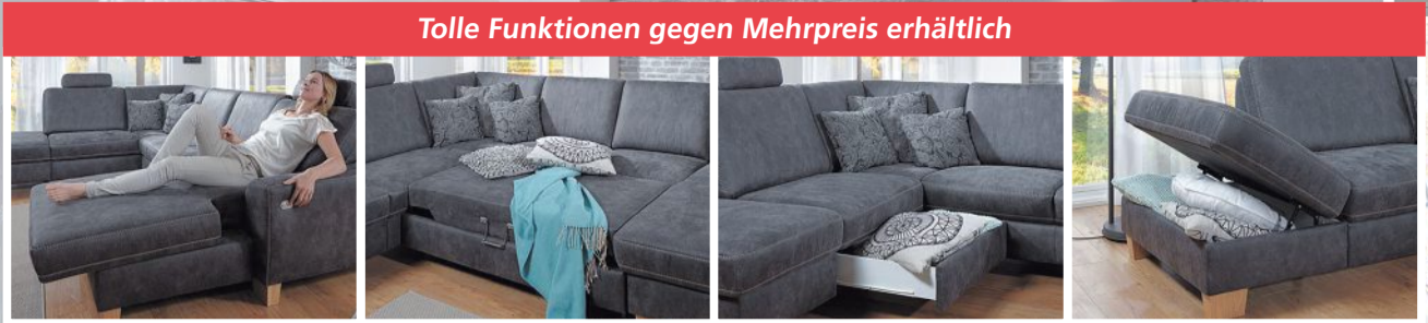
Tolle Funktionen gegen Mehrpreis erhältlich