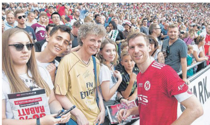
Per Mertesacker traf zum Abschied seine Fans.

Nach seiner Auswechslung und einer Ehrenrunde durch das Stadion stellten alle Spieler eine Eistonne für den 34-Jährigen auf - in Anlehnung an das bekannte TV-Interview, das Mertesacker während der WM 2014 gab („Ich lege mich jetzt drei Tage