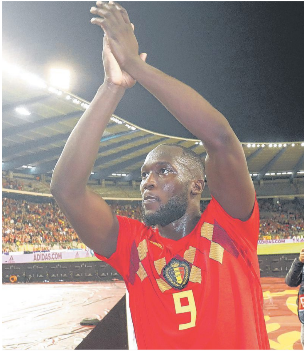
Romelu Lukaku schoss Belgien gegen die Schweiz zum Sieg.

Romelu Lukaku hatte den Sieg mit seinem Doppelpack in der 58. und 84. Minute gesichert. Mario Gavranovic war in der 76. Minute der zwischenzeitliche Ausgleich für die Schweiz gelungen. „Wir haben aber immer noch die Chance, im Heimspiel um den ersten Platz zu kämpfen. Das ist das Positive an diesem Spiel“, sagte der Schweizer