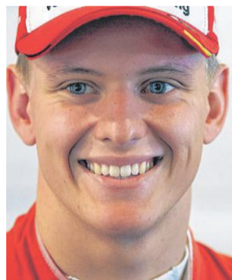
Mick Schumacher wurde Meister in der Formel 3.

Dank des Titels hat Schumacher auch die 40 Punkte für die Superlizenz beisam-