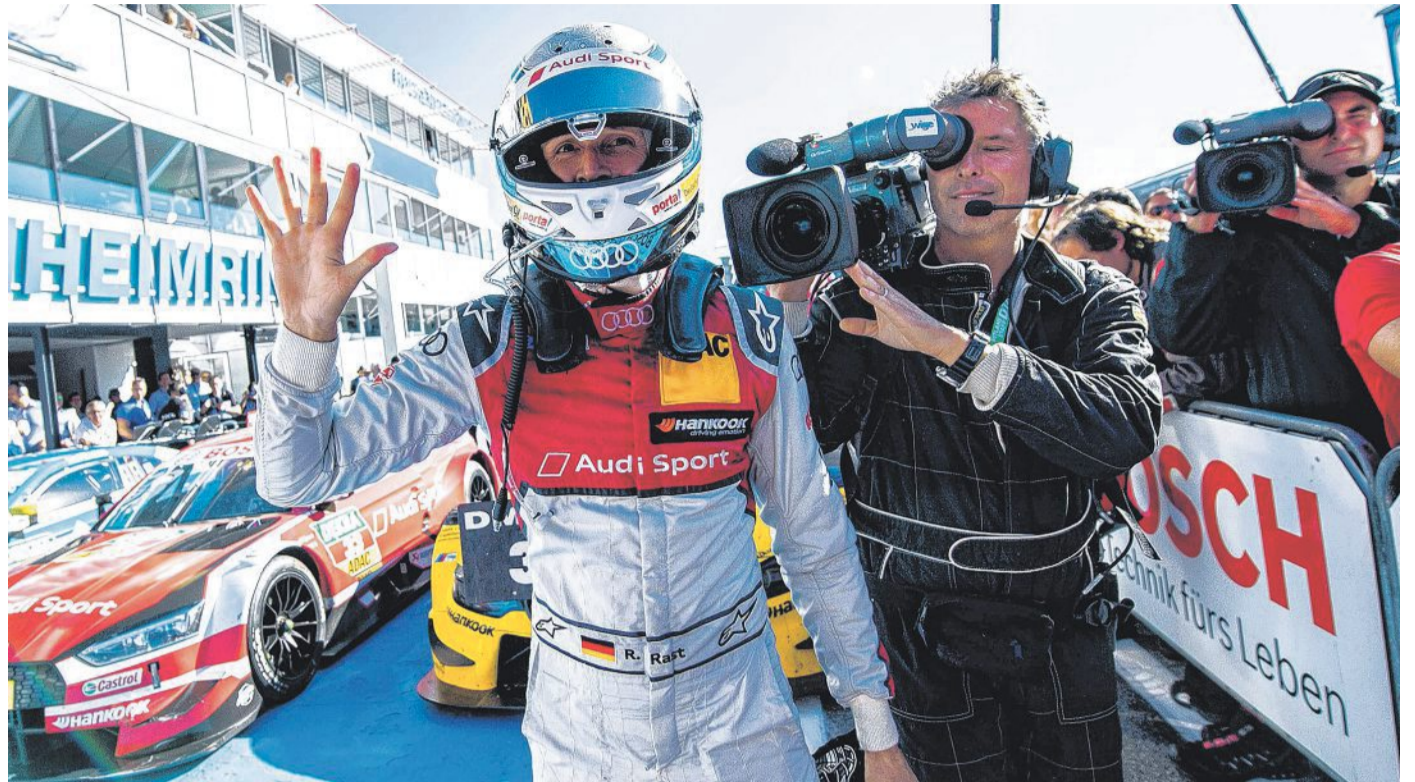
Die Fünf ist voll: DTM-Titelverteidiger René Rast setzte seine Siegesserie in Hockenheim fort.

„Jetzt ist alles möglich“, sagt René Rast, der mit 30 Punkten Rückstand nach Hockenheim gereist war und diesen nach dem ersten von zwei Rennen am Wochenen-