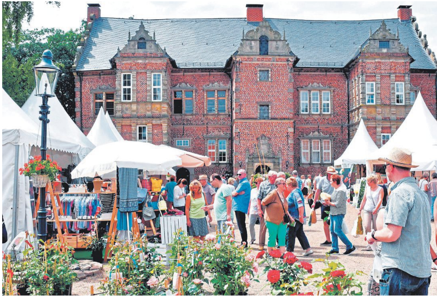
Auf Schloss Erbhof in Thedinghausen findet vom 26. bis 28. Oktober das „Herbstgeflüster“ statt.

Weiter heißt es: Erfahren Sie bei einer Besichtigung des Renaissancesaals und ei-