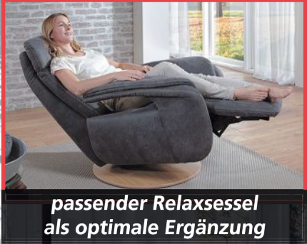
passender Relaxesessel als optimale Ergänzung