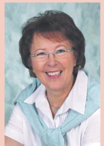
TEXT: Stadt Rehburg-Loccum

Die Lesung beginnt um 19.30 Uhr. Der Eintritt ist frei.