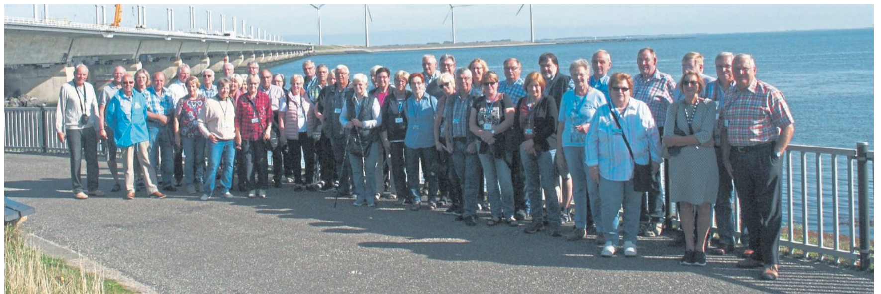
Voller neuer Eindrücke kehrte die 42-köpfige Gruppe aus der Samtgemeinde Heemen aus den Niederlanden zurück.

Das recht kleine Land ist dabei, sein Refugium umzugestalten und baulich zu verändern. Interessant sind die Neubauten, besonders in den Großstädten, deren Aussehen nicht mehr im Stil der Vergangenheit, sondern äußerlich sehr eigenwillig und mit neuen Werkstoffen gestaltet wurden. Damit die Kenntnisse aus der Vergangenheit und über dieses erfolgreiche Bauen nicht in Vergessenheit geraten, hat man Freilichtmuse-