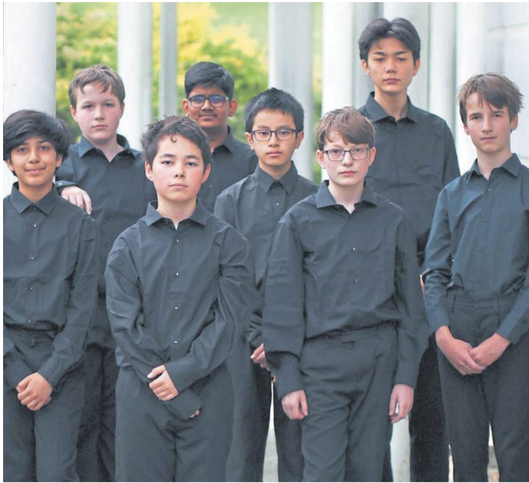
Der „Trinity Boys Choir Eight“ singt in Loccum.

Der Name des Programms „Solstitium“ steht für die Sonnenwende des Jahres und feiert mit seinen ausgewählten Stücken den Lauf zwischen dem längsten Tag im Sommer und dem kürzesten Tag im Winter. Dazwischen liegen zweimal im Jahr die Tage „Equinox“, an denen Dunkelheit und Helligkeit gleich lang dauern.