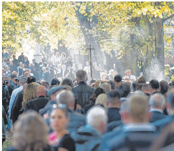
Auf dem Alten St. Matthäus-Friedhof war es so voll, dass die Polizei teilweise die Zufahrt sperrte.

Unter den Trauernden waren auch die Ex-Weltmeister Henry Maske, Dariusz Michalczewski, Sven Ottke, Arthur Abraham und Marco Huck. Mit Maske und Michalczewski hatte sich der mit 54 Jahren gestorbene Rocchigiani zwischen 1995 und 2000 zum Teil legendäre Ringschlachten geliefert. Angeführt wurde der mehr als 100 Meter lange