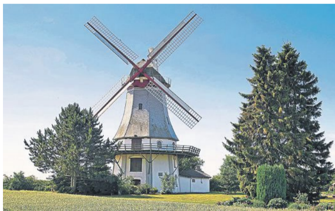
Weithin sichtbar: die Behlmer Mühle in Engeln.

➤ Wassermühle Bruchmühlen, Bruchmühlen 2, Bruchhausen-Vilsen: Die Wassermühle Bruchmühlen gehörte als