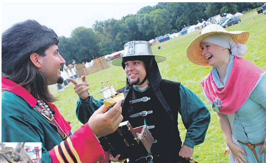
Ab Mittwoch verwandelt sich das Rittergut Brokeloh wieder in den fantastischen Kontinent Mythodea.

Ab Mittwoch verwandelt sich Brokelohs Rittergut wieder in eine Fantasywelt