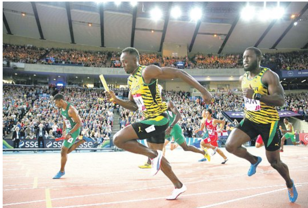
Usain Bolt (Mitte) erzielte mit seinem Team nur die sechstschnellste Zeit.

Das jamaikanische Quartett um Bolt hatte bei Olympia 2012 in London den Weltrekord in der Sprintstaffel auf 36,84 Sekunden gedrückt.