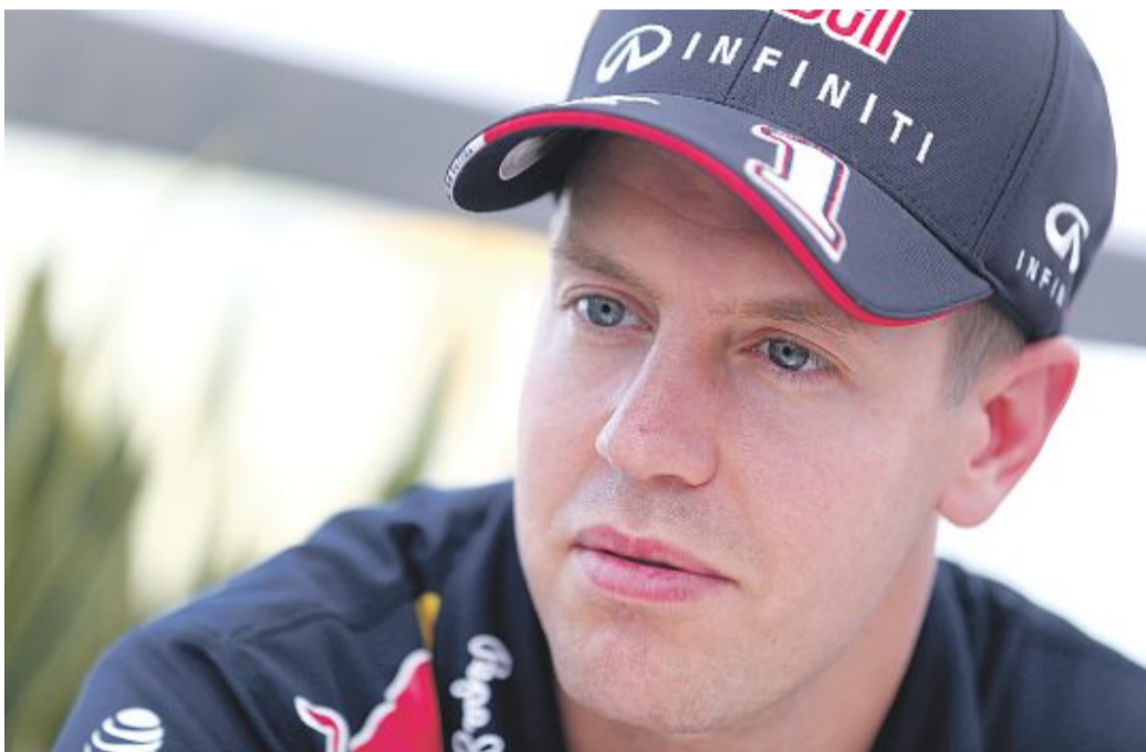
Sebastian Vettel gibt sich selbstkritisch.

„Es ist ein Fakt, dass es mir in diesem Jahr zu selten gelungen ist, meinen Teamkollegen zu schlagen“, sagte er: „Daniel macht seine Sache sehr, sehr gut!“