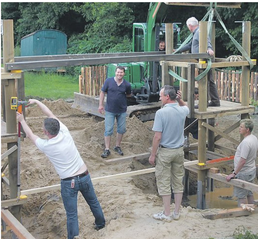
Mit vereinten Kräften wird das Außengelände des Kindergartens in einen attraktiven Spielplatz verwandelt.

Zum besonderen Konzept des Wietzener Naturkindergartens gehört der Wechsel zwischen ‚Buten‘ und ‚Binnen‘: Die Kinder