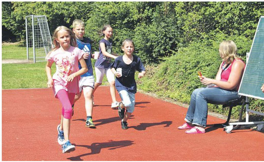
Trotz der Hitze haben die Kinder alles gegeben. Beim Sponsorenlauf der Grundschule Haßbergen sind rund 1000 Euro zusammengekommen.