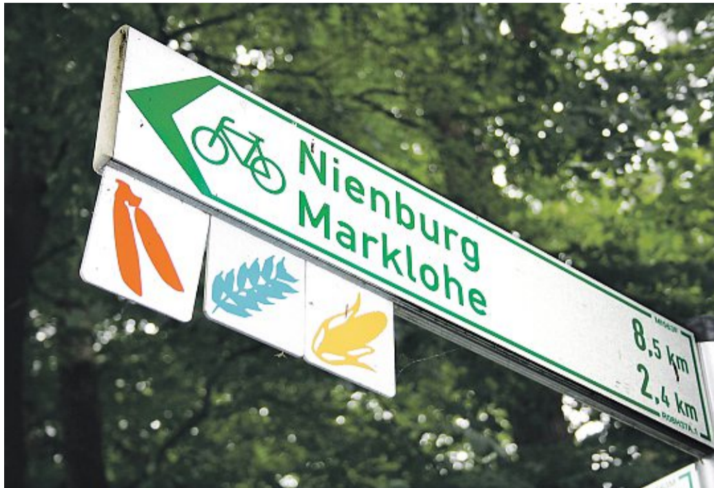
Die Radrundwege durch die Samtgemeinde Marklohe sind mit Piktogrammen ausgeschildert. Auf der Erbsen-Tour geht es auch vorbei an der Kirche St. Gangolf in Wietzen.

HamS-Serie „Ausflugsziele in der Region“ / Heute: die Erbsen-Tour