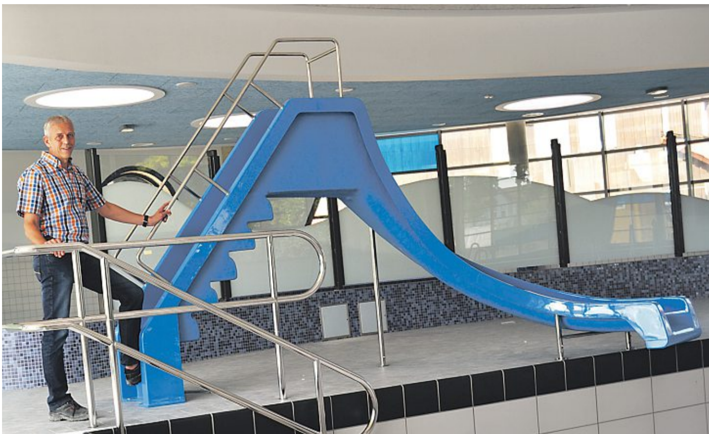
Foto oben: Olaf Seemeyer an der Rutsche, die ins Nichtschwimmerbecken führt. Fotos unten: Im gesamten Bad wird mit Hochdruck gefliest, auch müssen insgesamt 680 Garderobenschränke aufgestellt und montiert werden.

Hochbetrieb auch im Gesundheitsbereich. Auch hier werden die letzten Fliesen verlegt, Whirlpool und Unterwasserliegen sind bereits deutlich auszumachen, lediglich das Becken, in das der Badegast gelangt, ohne das Wasser verlassen zu müssen, ist wegen der Fliesenverlegearbeiten noch durch