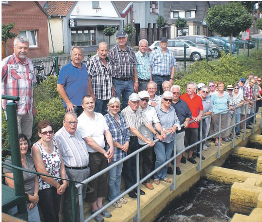
Bei bestem Radfahrwetter unternahm Steyerbergs CDU eine informative Fahrradtour.

Die Fischtreppe befindet sich im Mittelpunkt von Liebenau und fügt sich optisch sehr gut in das vor einigen Jahren restaurierte Mühlenumfeld – die Mühle wurde 1883 erbaut – ein. Neben dem Bau der Fischtreppe wurden auch die Turbine und