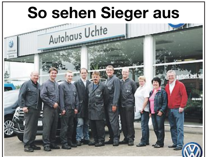
Autohaus Uchte GmbH. Top Performer 2013. * Das Auto. Wolfsburg, 02.07.2014

ben den Bewohnern der Poller-Anrainern selbstverständlich auch wieder all diejenigen, die an diesem Sonntag in den Ferien gerade mit dem Fahrrad unterwegs sind. eha