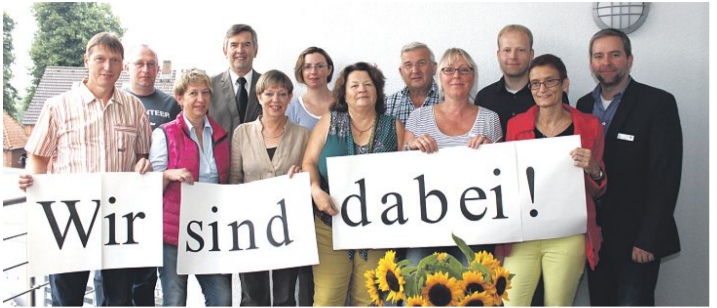
Gemeinsam engagiert bei „Wir sind Dabei!“: die Sponsoren und Mitarbeitende des Familien- und Seniorenbüros (FSB) des Landkreis Nienburg.

Landkreis Nienburg hebt lokalen Sonderfonds „Wir sind dabei!“ aus der Taufe