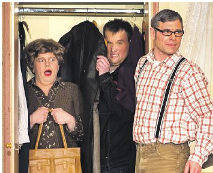
Die Sing- und Spielgemeinschaft Holte-Langeln (rechts) zeigt im Abo 5 am 24. Januar 2015 „Een Guru für Do-Ping“. Die Heimatspiele Marklohe präsentieren im Abo 6 am 14. März 2015 „Oma und de olen Knoaken“.

Nienburg. Der Landkreis Nienburg zeichnet sich insbesondere durch seine zahlreichen Theatergruppen aus, die mit ihren plattdeutschen Stücken Saison für Saison Liebhaber niederdeutscher Komödien und Lustspiele begeistern. In den Abo-Reihen 5 und 6 des Nienburger Theaters zeigen die heimischen Amateur-Theatergruppen ihr Können.