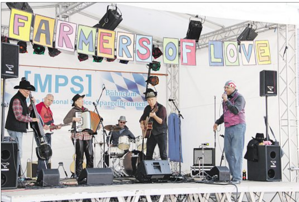
Die „Farmers of Love“ traten am Spargelbrunnen auf.