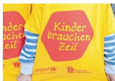
Für Hobbys und Freunde bleibt nicht viel Zeit, sagt das Kinderhilfswerk UNICEF.

Das Ergebnis: Mädchen und Jungen in Deutschland arbeiten im Schnitt in der Woche über 38 Stunden in der Schule oder für den Unterricht. Das ist ähnlich viel wie Erwachsene leisten, die jeden Tag zur Arbeit fahren. Je älter Kinder und Jugendliche werden, desto mehr wird es. In den Klassen 9 bis 13 haben Jugendliche bereits eine Woche mit bis zu 45 Stunden. Mit der Schule verbringen Kinder und Jugendliche also sehr viel Zeit. 18 Stunden pro Woche sind die Mädchen und Jungs zudem mit ihrer Familie zusammen. Gut 15