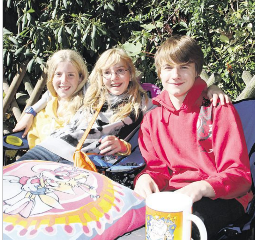
Bei Sonnenschein macht das Verkaufen besonders viel Spaß.