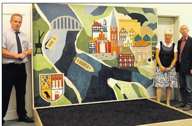
Diese Intarsienarbeit aus Veloursteppich kann bei der Lebenshilfe ersteigert werden.

Jahr bewährte und beliebte Attraktionen beim Family Day: Ein Streichelzoo kommt mit Tieren von Esel bis Huhn, außerdem ist eine Mäuserennbahn dabei. Clown Beppo mit seinem Gefährt für die Kinder ist ebenfalls wieder da und fährt die Straße Südring auf und ab.