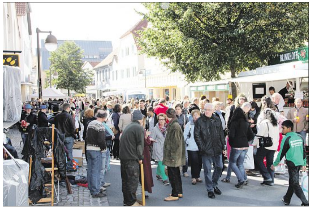
Tausende Besucher lockte es gestern in die Innenstadt.