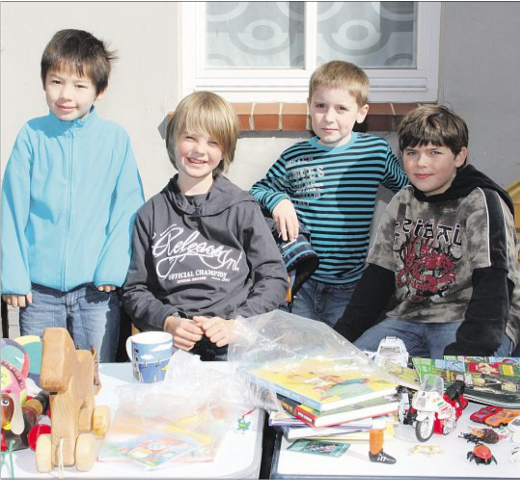
Der Verkauf läuft gut.