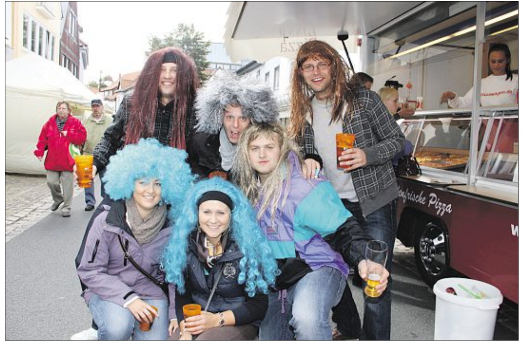
„Wir haben die Haare schön.“