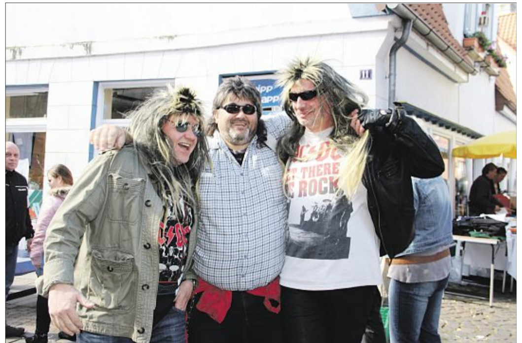
„Wir haben auch die Haare schön.“