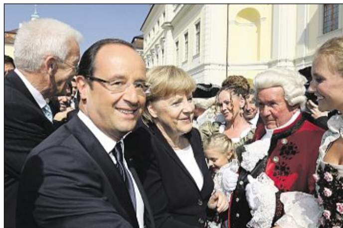
François Hollande (Mitte), Angela Merkel und Winfried Kretschmann (links) nahmen ein „Bad in der Menge“.

LUDWIGSBURG. Zwei Küsse für Angela: Nicht nur die Regenwolken über dem barocken Schloss in Ludwigsburg verzogen sich. Auch die anfänglichen Spannungen zwischen dem französischen Präsidenten François Hollande und Bundeskanzlerin Angela Merkel schein vorüber. In einem Festakt gedachten beide der Rede Charles de Gaulles, der 1962 die deutsche Jugend als „Kinder eines großen Volkes“ bezeichnet hatte und dem der Freundschaftsvertrag beider Länder im Januar 1963 folgte. „Das Europa von morgen liegt in Euren Händen“, rief Merkel den Jugendlichen zu. Hollande forderte eine noch stär-