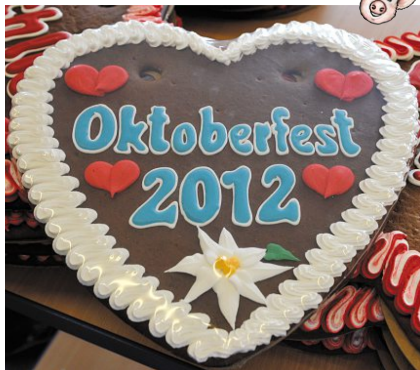
Auf dem Oktoberfest werden viele Menschen ein Lebkuchenherz kaufen.

Das Oktoberfest ist sehr bekannt. Aus vielen Ländern kommen die Menschen Jahr für Jahr, um bei der Wiesn, wie das Fest auch genannt wird, dabei sein zu können. Sie essen, trinken, tanzen und vergnügen sich in den Karussells. Darunter ist dieses Mal zum Beispiel der Silberturm. Der ist für Kinder gedacht. Sie fahren zunächst in einer Gondel nach oben. Danach rauschen sie schnell wieder runter. In diesem Jahr gibt es für Kinder auch ein Forschenspiel und eine Forscherexpedition. Kinder können so mehr über das Oktoberfest erfahren.