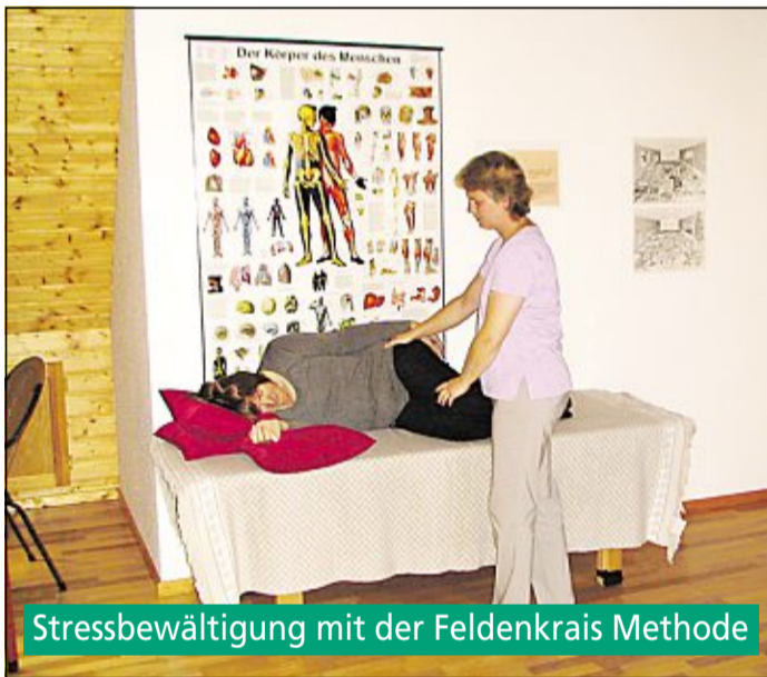
Stressbewältigung mit der Feldenkrais Methode