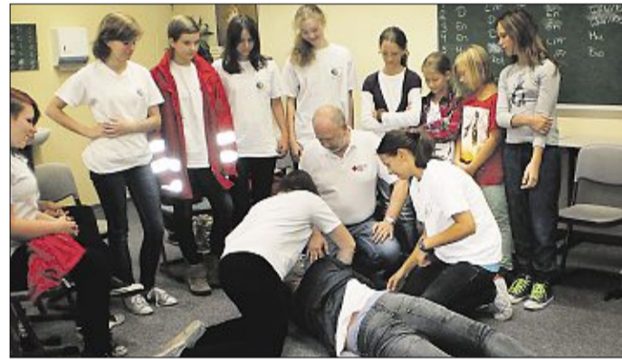
Die stabile Seitenlage gehört zu jeder Erste Hilfe-Ausbildung mit dazu.

Neben dem Schulsanitätsdienst bietet der DRK-Kreisverband Nienburg noch die Projekte „Humanitäre Schule“. Dabei geht es darum das Planspiel h.e.l.p. einzuführen. H.e.l.p. steht für Humanitäres Entwicklungs- und Lernprojekt und ist ein Rollenspiel für 14 bis 35 Schüler ab 15 Jahren.