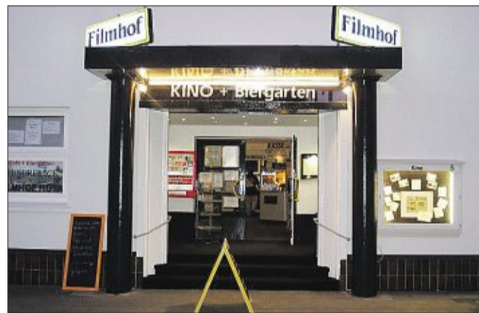
Der Filmhof Hoya zeigt am 21. Oktober eine Live-Übertragung von „Tristan & Isolde“ aus der Staatsoper Nürnberg.