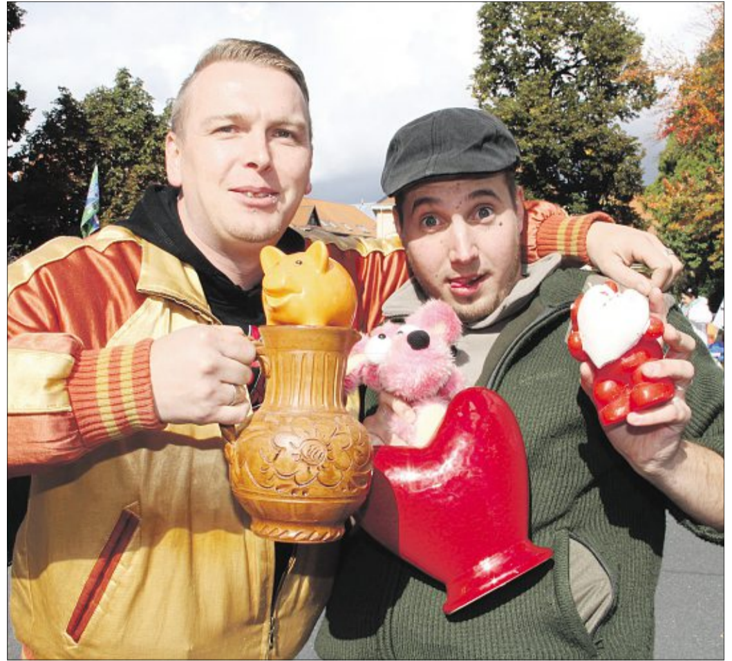
Auf dem Altstadtfest-Flohmarkt gibt es die schönsten Dinge zu erwerben.