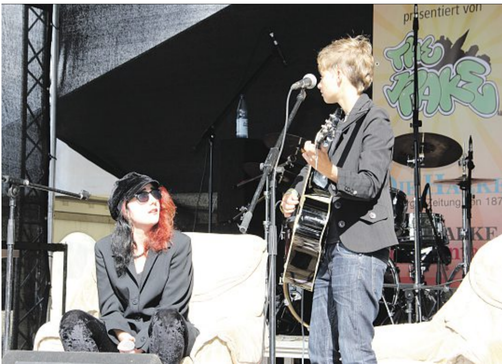
Auf der „Rake“-Bühne machten „Mad & Stubborn“ es sich erstmal gemütlich ... .. genauso wie die Gäste vor der „Rake“-Bühne.