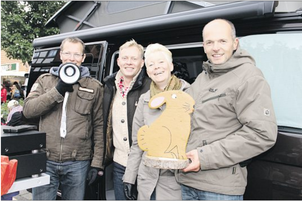
Aufgepasst - Holzhasen im Angebot!