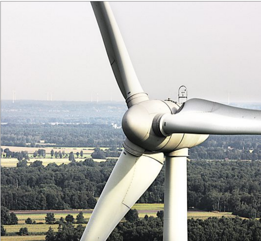
Im März 2013 sollen im Windpark Mensinghausen zwei weitere Windkraftanlage des Typs E82 ans Netz gehen.

Zum anderen sind die neuen Anlagen, die sich direkt süd-östlich an den bestehenden Windpark anschließen, mit 179,40 Meter etwa 30 Meter höher als die bereits bestehenden. Hierdurch wird ein um etwa 20 Prozent höherer Energieertrag erwartet. Der gesamte Windpark kann dann mit einer Leistung von insgesamt 20,6 Megawatt dann etwa 16 000 Haushalte im Jahr mit Strom versorgen. Wie Projektleiter Andre Meyer berichtet, laufen bis Ende September noch die Erdarbeiten für die Erschlie-