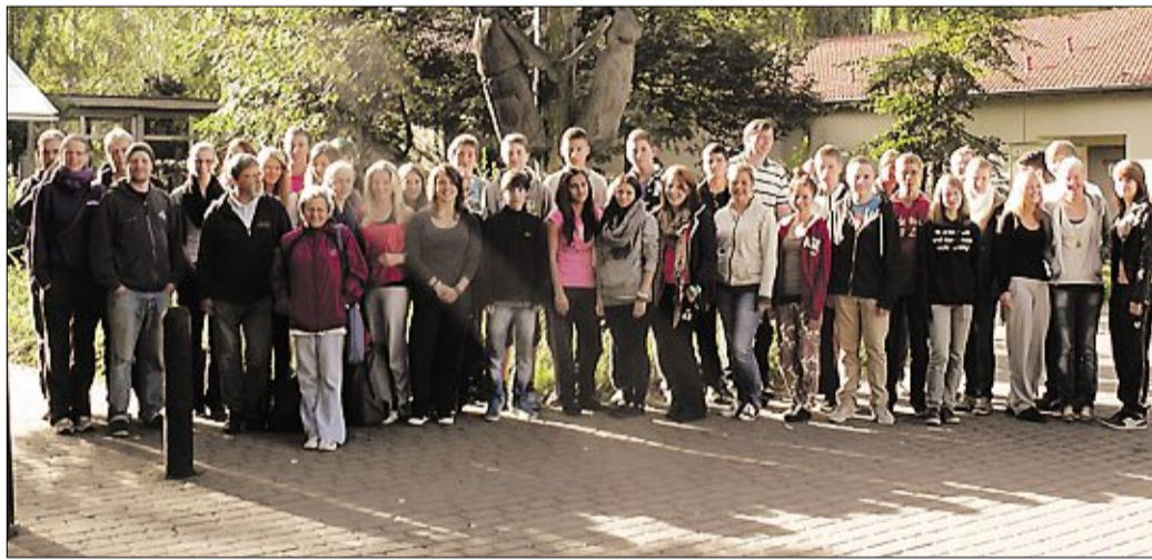
Die Nienburger Schülerinnen und Schüler vor dem Mahnmahl der Internationalen Jugendbegegnungsstätte in Oswiecim /Polen.

Die nächsten zwei Tage waren angefüllt mit Besichtigungen der heutigen Stadt Oswiecim, dem neu entstandenen jüdischen Zentrum im Ort, sowie