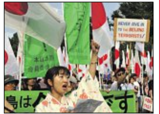
Tokio: Antichinesische Demo.

TOKIO. Der Tonfall im Streit um die unbewohnten Senkaku-Inseln wir schärfer. Bislang kam es nur in China zu antijapanischen Protesten, die teilweise Krieg mit dem einstigen Besatzer forderten. Nun nutzen auch nationalistische Japaner den Konflikt und demonstrieren gegen China. Ein gefährlicher Zeitpunkt, denn China steht vor einem Wechsel in der Kommunistischen Partei und Staatsführung.