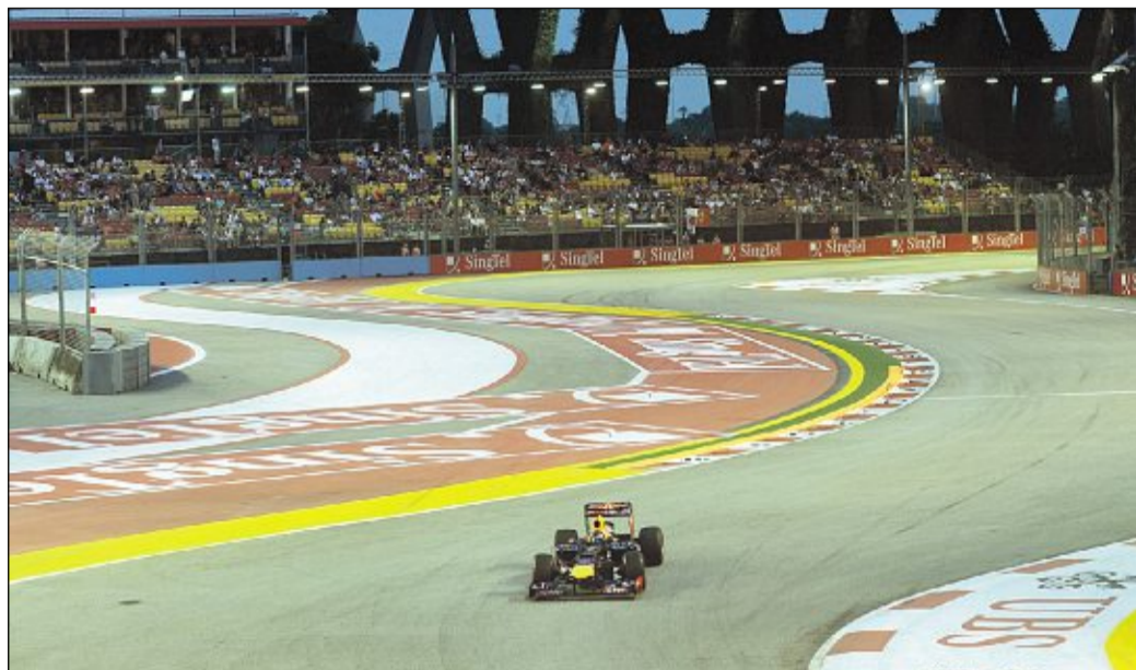
Sebastian Vettel muss sich mit Startposition 3 begnügen.

WM-Spitzenreiter Fernando Alonso (Ferrari) startet von Platz fünf hinter Jenson Button im zweiten McLaren. „Der fünfte Platz ist okay“, meinte der Spanier: „Ich habe im Rennen genug Möglichkeiten, aufzuholen. Dafür muss aber alles stimmen.“ Der aktuell Drittplatzierte Kimi Räikkönen (Lotus) belegte nur Rang 12. Die beiden Mercedes-Piloten Michael Schumacher und Nico Rosberg gehen nur von den Plätzen neun und zehn aus ins Rennen.