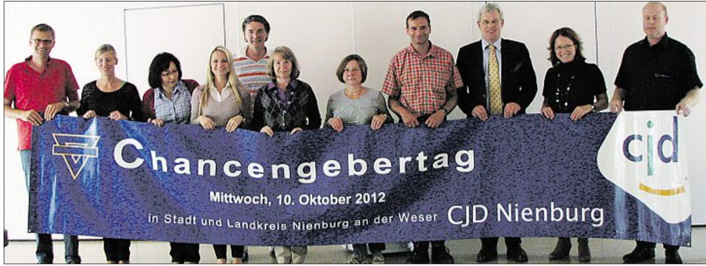
Die Partner des Chancengebortages 2012, der am 10. Oktober kreisweit stattfindet.