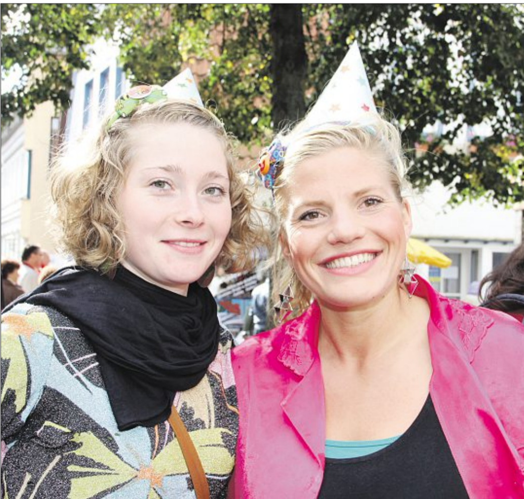
Die Laune ist gut - mit Hut!