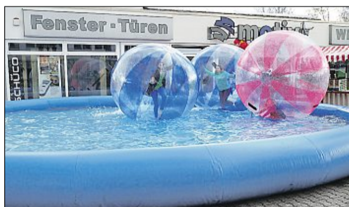
In diesen Water-Walking-Bällen dürfen die Family-Day-Besucher übers Wasser laufen.

Das Autohaus Südring ist mit einer Fahrzeugausstellung von VW, Audi und Seat sowie Gebrauchtwagen dabei. Zudem ist eine Hüpfburg für Kinder aufgebaut. Dort gibt es ebenso ein Glücksrad wie bei Wölk, wo auch ein Blumenwagen steht. Und bei Carlas Pizzabude gibt es Pizza und Eis.