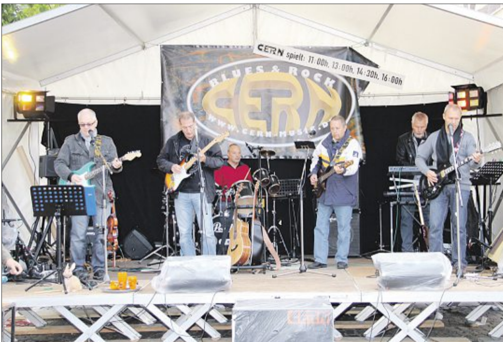
„Cern“ sorgte in der Leinstraße für Stimmung.